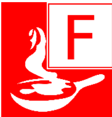
Slika 8. Piktogram požara razreda F

Požari razreda F (slika 8.) odnose se na požare biljnih i životinjskih ulja i masti u uređajima za prženje i drugoj kuhinjskoj opremi. Razlog ove podjele je u tome što ovakvi požari načelno pripadaju razredu požara B. Ovakvi požari su učestali, a pri njihovom gašenju postoje mnoge opasnosti. Požar ulja se razbuktava ako se gasi vodom, a ako se gasi postojećim sredstvima nastaju velike štete.