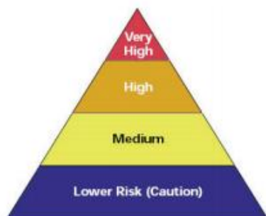
Slika 3. Piramida profesionalnog rizika za korona virus [20]

i niži rizik. Piramida profesionalnog rizika prikazuje četiri izloženosti razine rizika u obliku piramide koje predstavljaju vjerojatne raspodjela rizika [20].