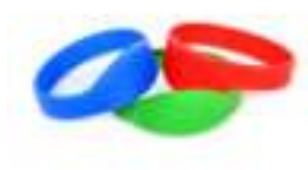
Slika 22: RFID narukvice

jednostavna provjera gostiju i zaposlenika. Narukvice mogu raditi na frekvencijama od 125 kHz i 13,56 MHz, a doseg na kojem prepoznaje broj iz narukvice je između 8 i 10 centimetara udaljenosti od RFID čitača. Narukvice su elastične, vrlo dobro prijanjaju uz ruku osobe koja ju nosi, te su 100% vodootporne. Također, otporne su na vanjske utjecaje i nemaju rubove, kopče i slično.[19]