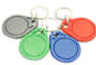
Slika 23: RFID privjesci

RFID privjesci prikladni su za upotrebu na sportskim terenima te u svrhu identifikacije pri ulasku i izlasku iz štićenih objekata. Praktični su jer se mogu koristiti kao privjesak za ključeve te su malih dimenzija i stanu u džep. Mogu biti različitih boja te različitih frekvencijskih izvedbi.[19]