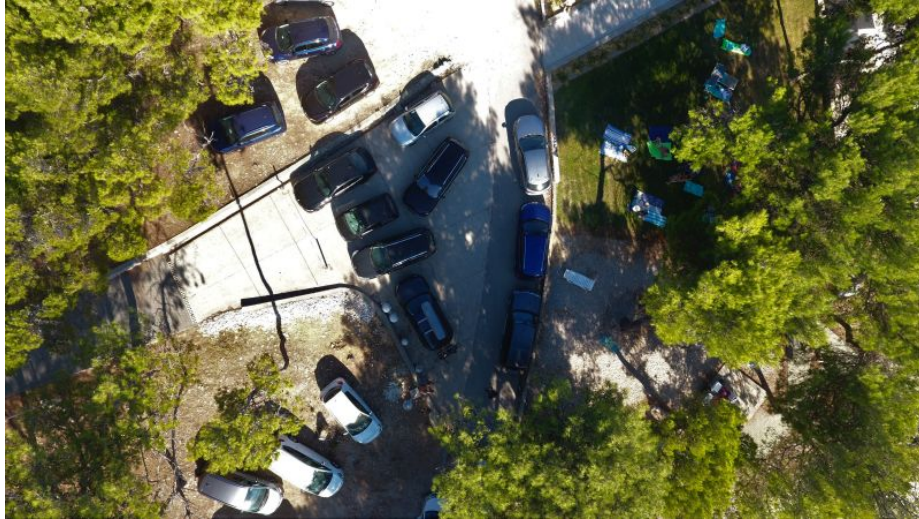
Slika 12.: Pristupni put Hotela Vespera i Aurora u ljetnim mjesecima