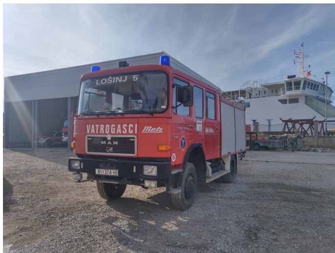
Slika 22.: Lošinj 5 – MAN