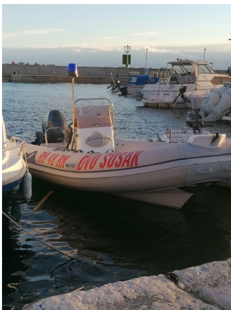
Slika 27. – Susak gliser