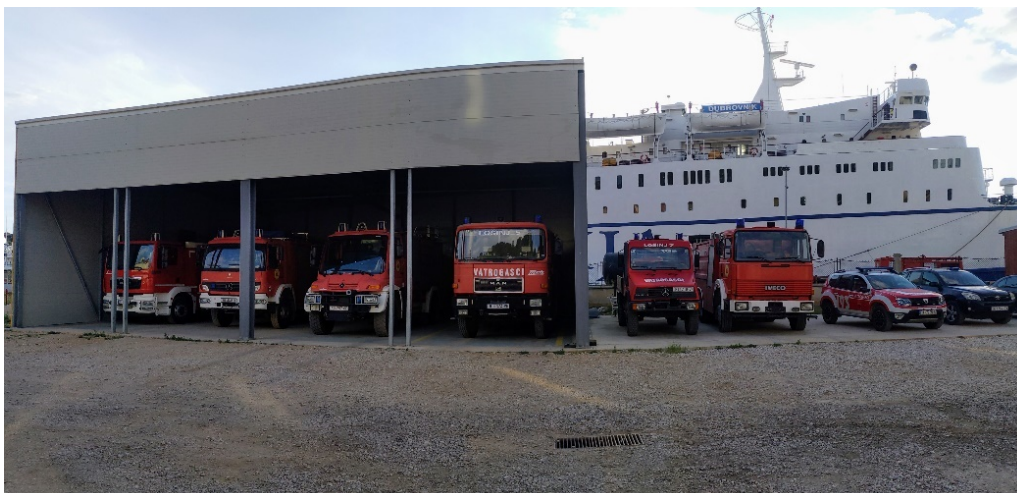
Slika 16.: Garaža za vatrogasna vozila

Stalnim zahvatima nastoji se Vatrogasni dom dovesti u zadovoljavajuće stanje. Lokacija postrojbe zadovoljava kriterije uključivanja vatrogasne tehnike na javnu prometnicu, ali je važno istaknuti otežano odvijanje prometa tijekom turističke sezone, a naročito kod prijelaza okretnih mostova na Privlaci u Malom Lošinj i mjestu Osor. [2]