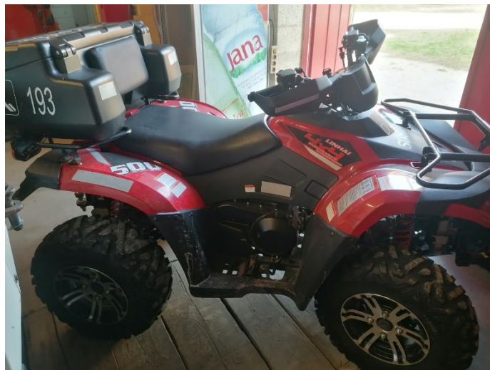
Slika 26. – Linhai (Quad)