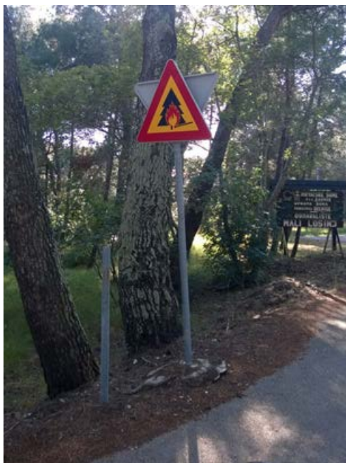
Slika 3.: Prometni znak opasnosti od požara

Kako bi se smanjili požari otvorenog prostora postavljaju se brojne oznake (Slika 3.), obavijesti, radijske poruke i plakati kako bi upozorili ljude da je opasno i zabranjeno paliti vatru na otvorenom prostoru.