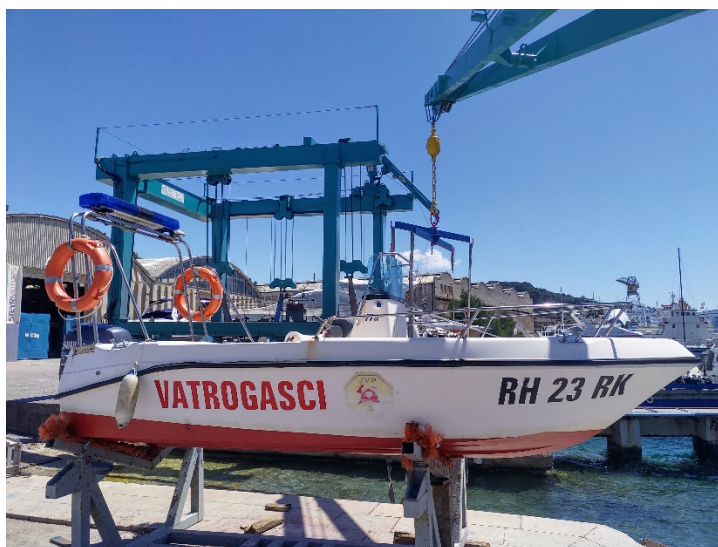
Slika 21.: ELAN Siela