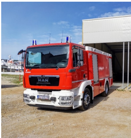
Slika 19.: MAN