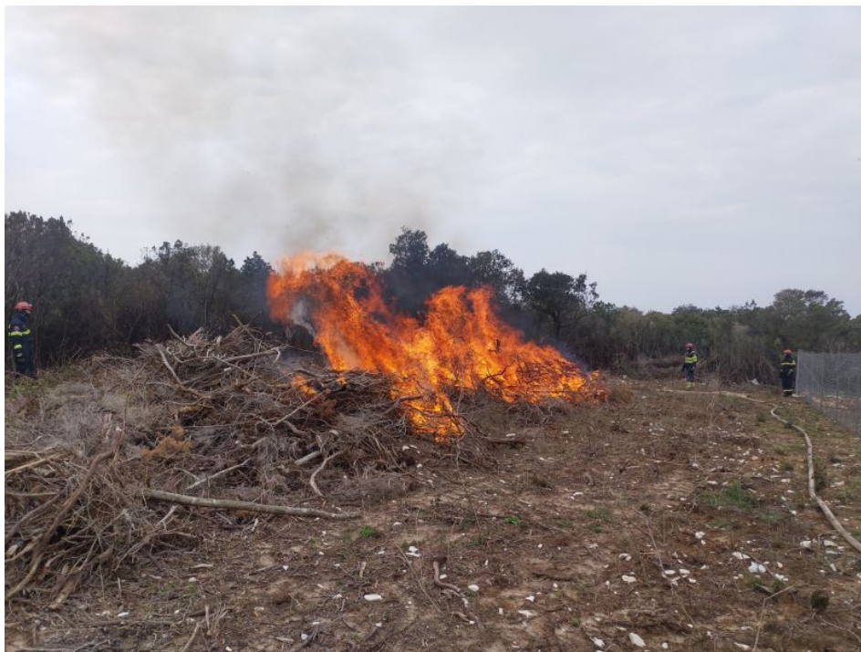
Slika 8.: Spaljivanje biološkog otpada

Tokom 6. aktivnih godina rada Dobrovoljnog vatrogasnog društva Lošinj, savjesni vlasnici zemljišta koja su obrađena i očišćena, tražili su pomoć vatrogasaca pri spaljivanju otpada radi velike količine biološkog otpada i opasnosti od mogućeg proširenja na okolnu vegetaciju. Jedan od primjera takvog spaljivanja prikazan je na slici 8.