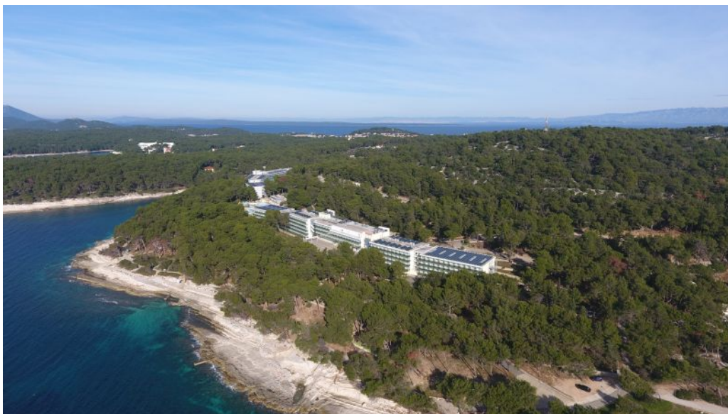
Slika 5.: Hoteli Aurora i Vespera