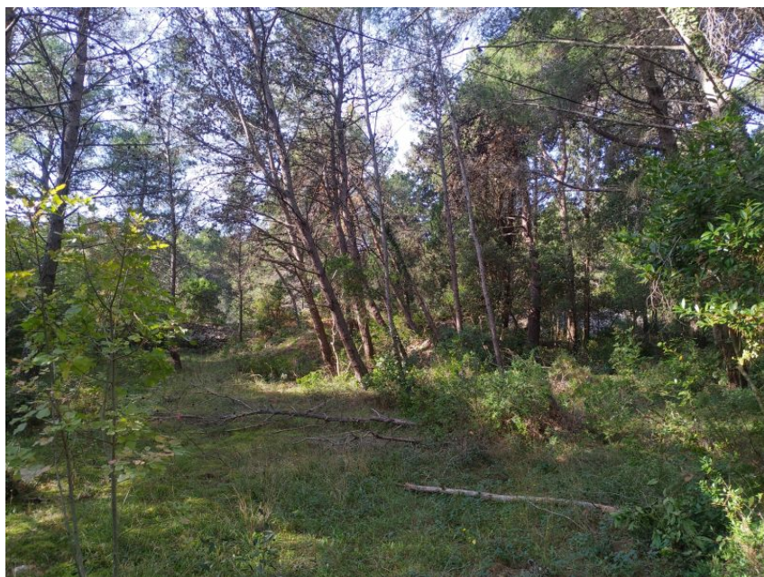
Slika 2.: Vegetacija na većeg dijela područja Grada

Održavanje šuma obavljaju Hrvatske Šume, no Hrvatske Šume održavaju samo neke dijelove šuma. Ostali dijelovi šuma su zarasli, neprohodni kao što je prikazano na slici 2. Primijećena je velika količina nakupljenog suhog lišća, trave i ostale sasušene biljne mase, a sve to povećava opasnost od zapaljenja i brzog širenja požara, osobito u ljetnim mjesecima kada su temperature vrlo visoke. Zapuštenost šume i niskog raslinja izravno utječe na smanjenu operativnost i kretanje vatrogasnih jedinica do mjesta požara, ali i ozbiljno utječe na širenje požara.