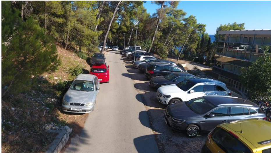
Slika 13.: Prolaz do pristupnog puta hotela Vespera i Aurora

Evakuacijski putovi također moraju biti redovno pregledavani iz razloga da bi ljudi mogli na vrijeme napustiti objekte ili područje zahvaćeno požarom. Na području grada evakuacijski putevi su gotovo uvijek ceste kojima se dolazi do samog objekta te su one uglavnom održavane tokom cijele godine.