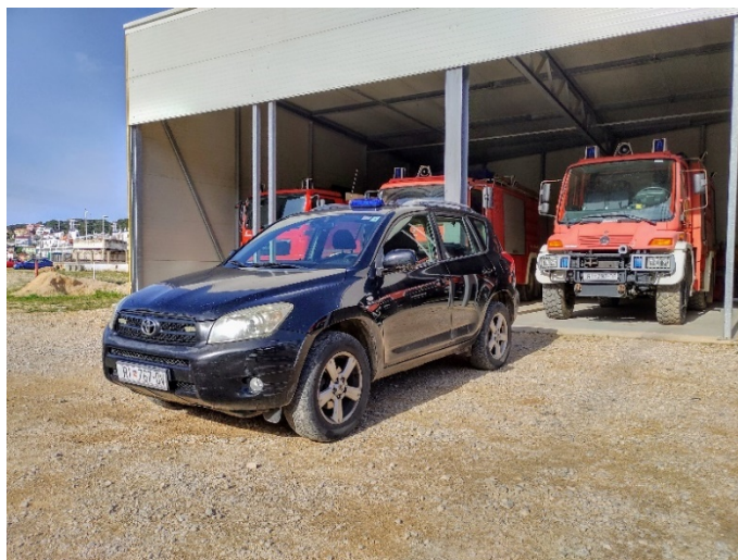
Slika 17.: Toyota RAV4 – Lošinj 1