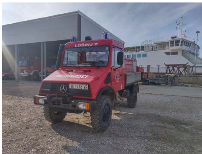
Slika 23.: Lošinj 7. – Mercedes U100