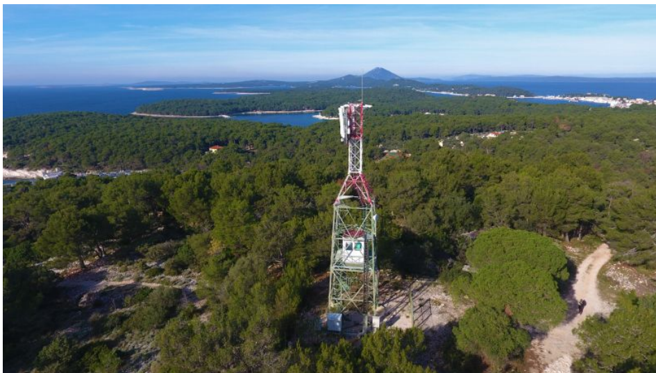
Slika 14.: Osmatračnica Hrvatskih šuma

Hrvatske šume kao pravna osoba koje temeljem posebnih propisa gospodare i upravljaju šumama i šumskim zemljištima u državnom vlasništvu na području grada prema Pravilniku o zaštiti šuma dužni su ustrojiti nadzor šuma.[11] Temeljem navedenog pravilnika na području Grada Malog Lošinja tokom ljetnih mjeseci oformljena je motriteljsko-dojavna služba te postoje dvije osmatračnice koje su u njihovom vlasništvu. Jedna od njih nalazi se nedaleko od lošinjske industrijske zone te se sa nje može vidjeti dim na području od jugozapadne obale otoka pa sve do naselja Osor kao što je vidljivo sa slike 14. Druga osmatračnica je smještena nedaleko od mjesta Punta Križa te se sa nje može vidjeti cijela istočna obala otoka Lošinja i područje do Beleja. Hrvatske šume u ljetnom periodu godine organiziraju osmatranje tijekom cijelog trajanja dnevnog svijetla.