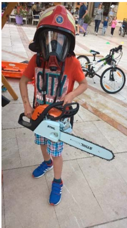
Slika 10.: Presentacija vatrogasne opreme