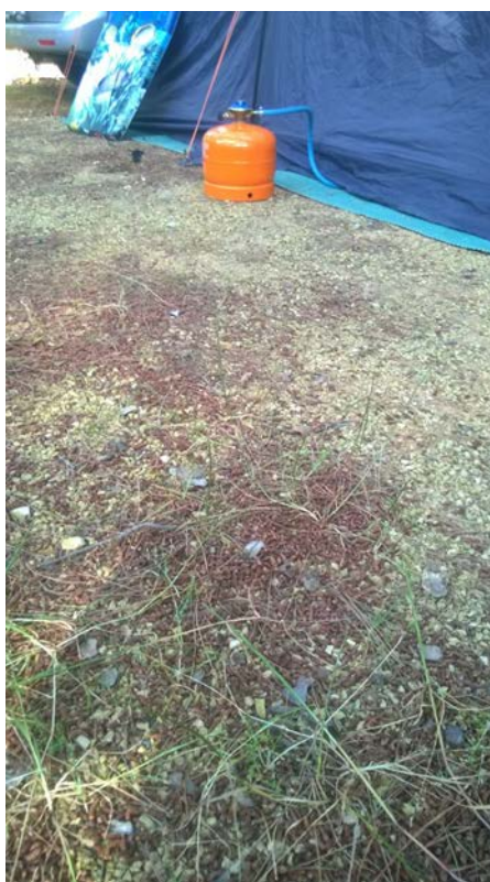
Slika 6.: Kamp oprema, šator i podloga

Požarne opasnosti u kampovima predstavlja pozicija kampova, a to su uglavnom šumoviti predjeli otoka, dok je tlo prekriveno osušenim lišćem i iglicama, što podiže požarnu opasnost. Kampovi, sami po sebi, ne predstavljaju opasnost već je u kampovima izraženija opasnost od nastanka i naglog širenja požara zbog navedenih razloga ali i činjenice što je kamp oprema izrađena od pretežito gorivog materijala. Primjer uređene podloge na prostoru kampa, šatora od lako gorivog materijala te opreme koje se koristi u kampu prikazano je na slici 6.