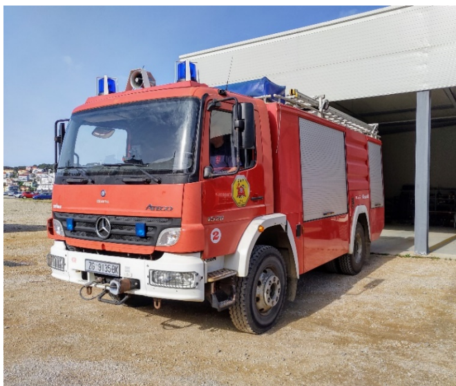
Slika 18.: Mercedes Atego