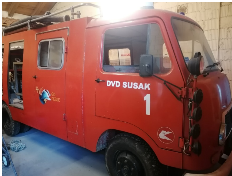
Slika 24 – TAM (Navalno vozilo)