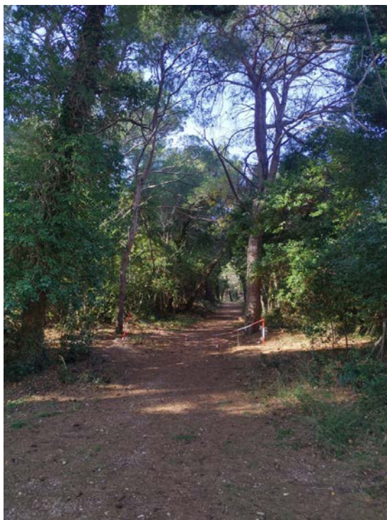
Slika 11.: Uređen pristupni put kampa Čikat

površine zahvaćene požarom, intenzitet požara,...). Posljednjih godina objekti i područja s velikim brojem ljudi shvatili su problematiku i pristupili rješavanju problema. Primjer dobro održavanog pristupnog puta prikazan je na slici 11.