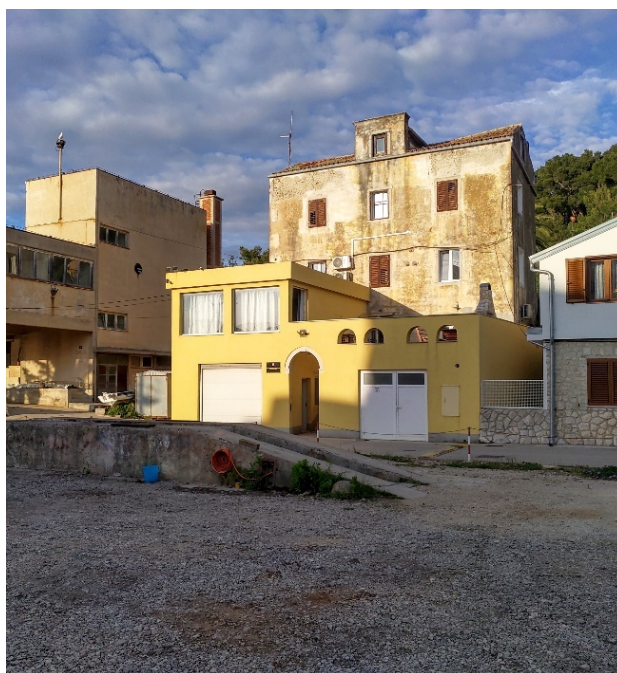
Slika 15.: Zgrada JVP Grada Mali Lošinj

Postrojba je smještena u Vatrogasnom domu prikazanom na slici 15. sa sjeverne strane matičnog grada Malog Lošinja na adresi Lošinjskih brodograditelja 37. Objekt je starijeg zdanja te do nedavno bez garažnog prostora za smještaj vatrogasnih vozila.