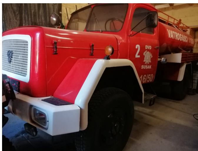
Slika 25. – TAM (Autocisterna)