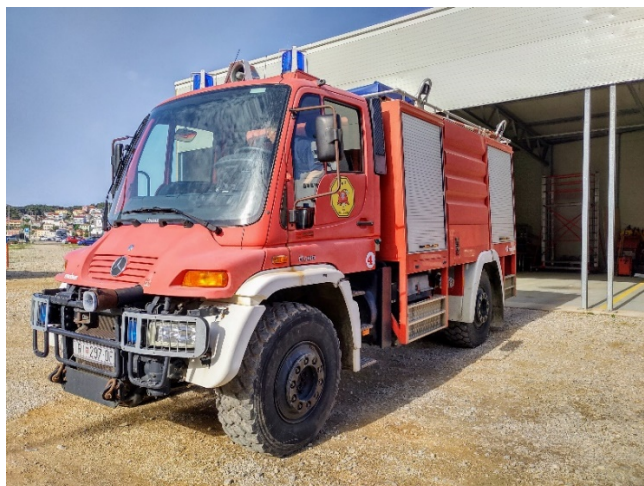
Slika 20.: Mercedes Unimog 500