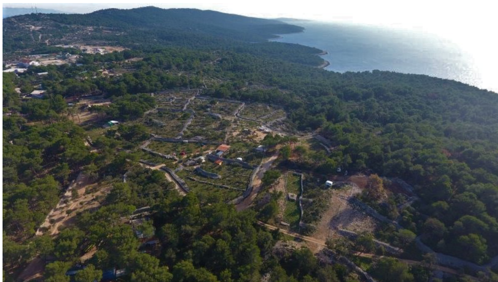
Slika 4.: Maslinik

manje požarne opasnosti te rascjepkanost obraslih sektora maslinicima kao što je prikazano na slici 4.