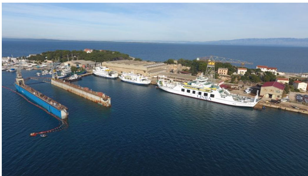
Slika 7.: Brodogradilište d.d.

Lošinjsko brodogradilište prikazano na slici 7. nalazi se na samom ulazu u Grad Mali Lošinj te je smješteno ispred Javne vatrogasne postrojbe.