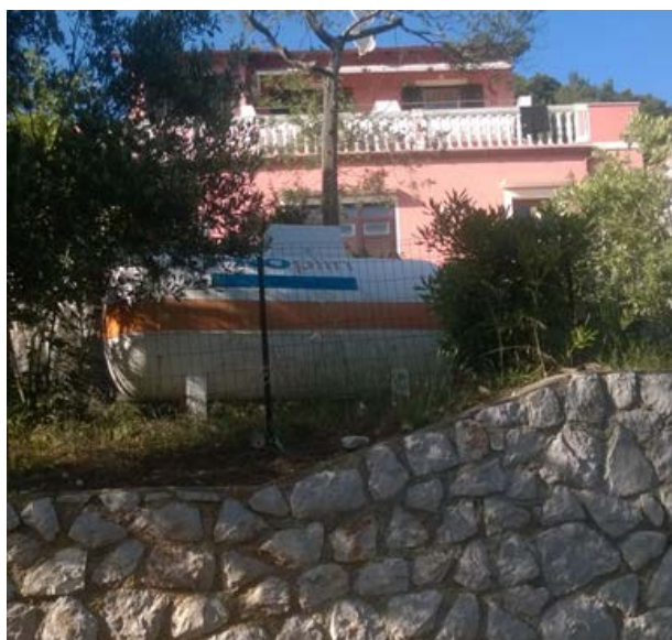
Slika 9.: Primjer plina u kućanstvu

Pojedina kućanstva imaju vlastite spremnike butan-propan plina koji se nalaze udaljeni od objekta u sklopu okućnice (Slika 9.). Popis, odnosno evidencija takvih spremnika nije dostupna Javnoj vatrogasnoj postrojbi. Tehnički uvjeti za postavljanje takvih spremnika zakonom su propisani i treba dobiti posebnu dozvolu. Problem nije kod postavljanja takvih spremnika nego u kasnijem održavanju tj. servisiranju.