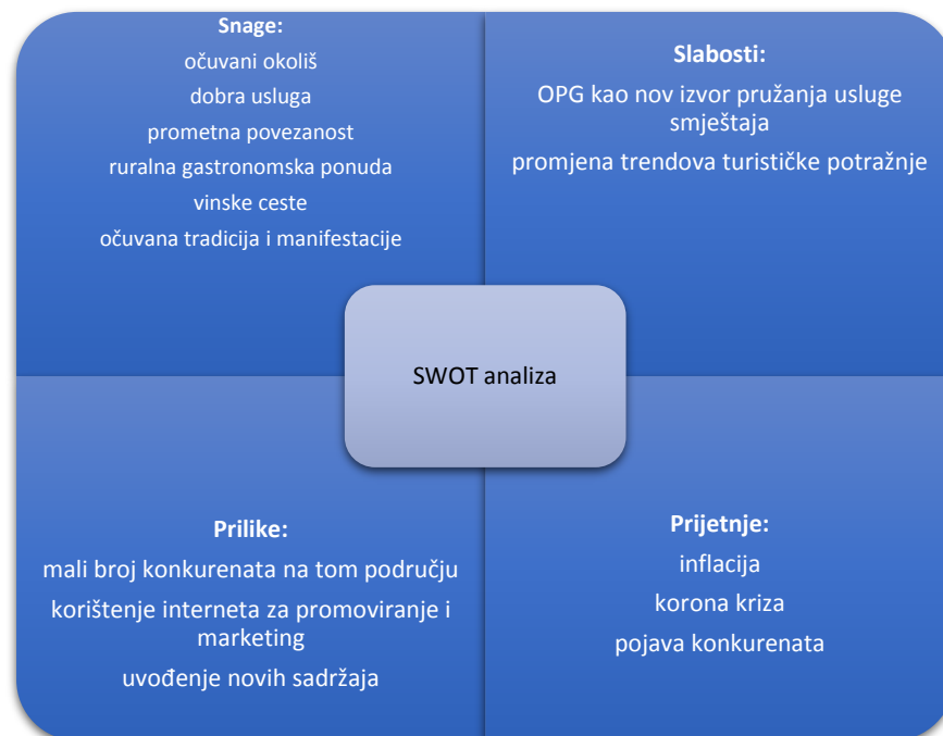
Slika 3 SWOT analiza

Kao prodajni rizik valja spomenuti sezonalnost koja kod nas zastupljena kako u ovoj vrsti turizma tako i u drugima. Planirana sezona uključuje mjesec lipanj pa sve do kraja rujna, s time da su srpanj i kolovoz udarni mjeseci. Klimatske promijene mogu nepovoljno utjecati na prodaju, no treba spomenuti da u ovakvoj vrsti turizma ima mnogo načina kako se sezona može produžiti. Slijedi SWOT analiza koja će nam prikazati snage, slabosti, prilike i prijetnje kojih treba biti svjestan.