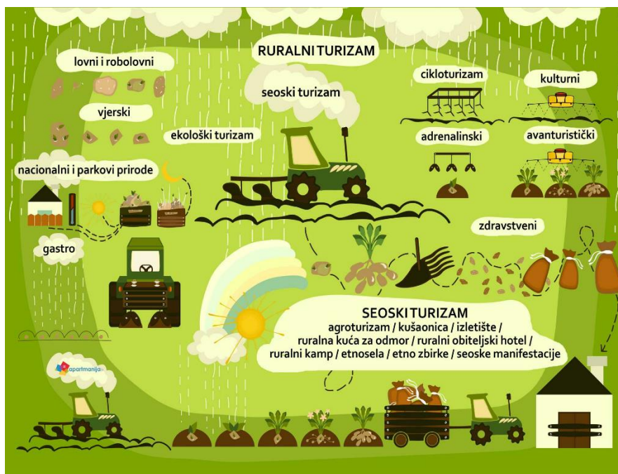
Slika 1 Ruralni i seoski turizam