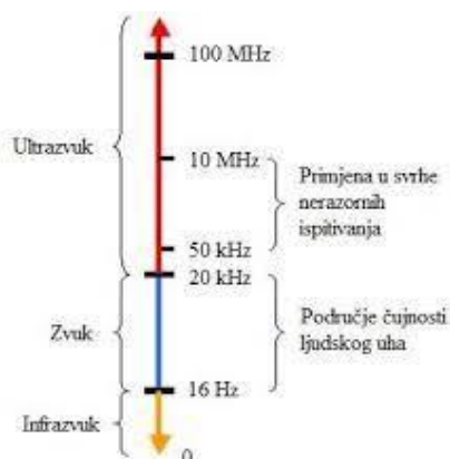
Slika 3. Infrazvuk, zvuk i ultrazvuk [8]

Postoje dvije mjerne jedinice buke, a to su: frekvencija koja se izražava u Hertzima (Hz) i intenzitet buke koji se izražava u decibelima (dB). Prag čujnosti je intenzitet buke od 0 dB kod frekvencije 1.000 Hz. Uho je najosjetljivije na zvukove od 1.000 do 7.000 Hz, a najveća osjetljivost je kod 4.000 Hz. U pravilu, zdravo ljudsko uho je sposobno za primanje zvučnih podražaja u području frekvencija od 16 Hz do 20.000 Hz (slika 3).