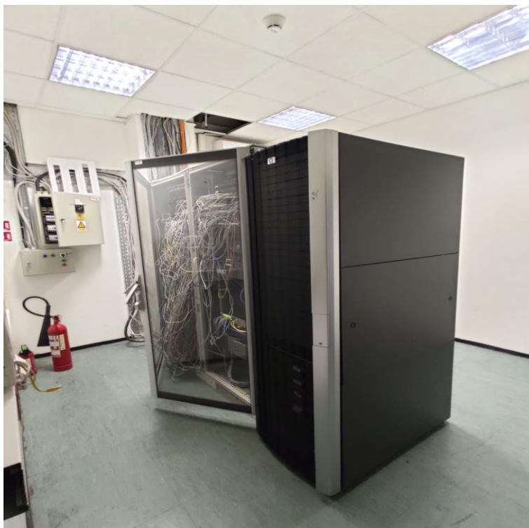
Slika 9. Soba sa serverima