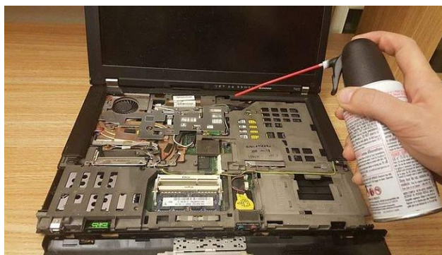
Slika 4. Čišćenje laptopa komprimiranim zrakom [11]

Kod prijenosnih računala možemo učiniti nekoliko stvari da smanjite ili spriječite onečišćenje kućišta, pogotovo donje strane gdje se nalazi ventilator. Jedan od savjeta je da prijenosno računalo uvijek držite na površini kao što su drvo koje je presvučeno lakom, ili bilo koja druga površina koja na sebi ne sadrži čestice prašine ili prljavštine (ako je podloga na koju želite staviti prijenosno računalo prljava, očistite je prije stavljanja laptopa na nju). Drugi savjet je da izbjegavate laptop držati na površinama poput kreveta, deke, prekrivača i sličnih površina. Tako ćete spriječiti da ventilator laptopa unutar kućišta „povuče“ čestice kao što su grinje, mekinje, prašina i sl. Komprimirani zrak je najbolje rješenje u slučaju da se laptopu poveća količina buke. Blagim upuhivanjem komprimiranog zraka (slika 4) oslobodit ćete laptop i ventilator od pritiska koji stvara nemogućnost prolaska zraka uzrokovan prljavštinom. Kod stolnih računala izbjegavajte držanje kućišta računala izravno na tepisima i umjesto toga kućište radije stavljajte na neku povišeniju platformu ili na stol. Tako ćete izbjeći kontakt kućišta s izvorima prašine i prljavštine. Prostor u kojem je računalo držite urednim i čistim. Tako će računalo duže vremena biti čisto, a buka koja će se čuti iznutra će biti niska ili je uopće neće biti. [11]