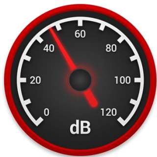
Slika 6. Aplikacija zvukomjer [15]

uzorke na grafu. U napomeni aplikacije stoji kako su mikrofoni u većini uređaja prilagođeni rasponu ljudskog glasa, a maksimalne vrijednosti su ograničene na hardver te kako ne može izmjeriti vrlo glasne zvukove (90 dB i više). [15]