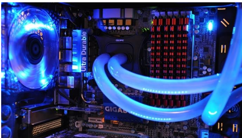
Slika 5. Vodeno hlađenje [12]

Takav način hlađenja većinom se koristi u računalima za igranje ili “gaming” računalima, dok se u “standardnim” osobnim računalima većinom koristi pasivno hlađenje. Pasivno hlađenje je hlađenje računala pomoću pasivnih hladnjaka koji koriste konvekciju zraka (najčešće kod grafičkih kartica). Sastoji samo od radijatora. Kod pasivnog hlađenja prirodna konvekcija omogućuje cirkulaciju zraka kroz rupe na poklopcu računala te se toplina iz procesora prirodno odvodi konvekcijom unutar systemske jedinice.