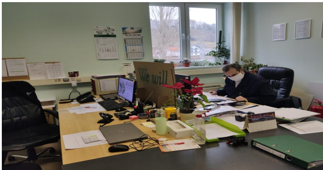
Slika 7. Ured zaštite na radu

Mjerenje razine buke sam proveo u tvrtki Valoviti papir Dunapack d.o.o. koja se nalazi u Zaboku. Tvrtka Valoviti papir Dunapack d.o.o. bavi se proizvodnjom i preradom kartonske ambalaže. Želi se pozicionirati kao tržišni lider u reciklažnoj, papirnoj i ambalažnoj industriji na ovim prostorima. Mjerenje razine buke sam proveo unutar tri ureda i sobe sa serverima. Prva lokacija na kojoj sam mjerio buku bio je ured zaštite na radu. U uredu zaštite na radu se nalaze 2 prijenosna računala marke Fujitsu povezanih s monitorima te printer marke Canon. Na slici 7 možete vidjeti kako izgleda ured.