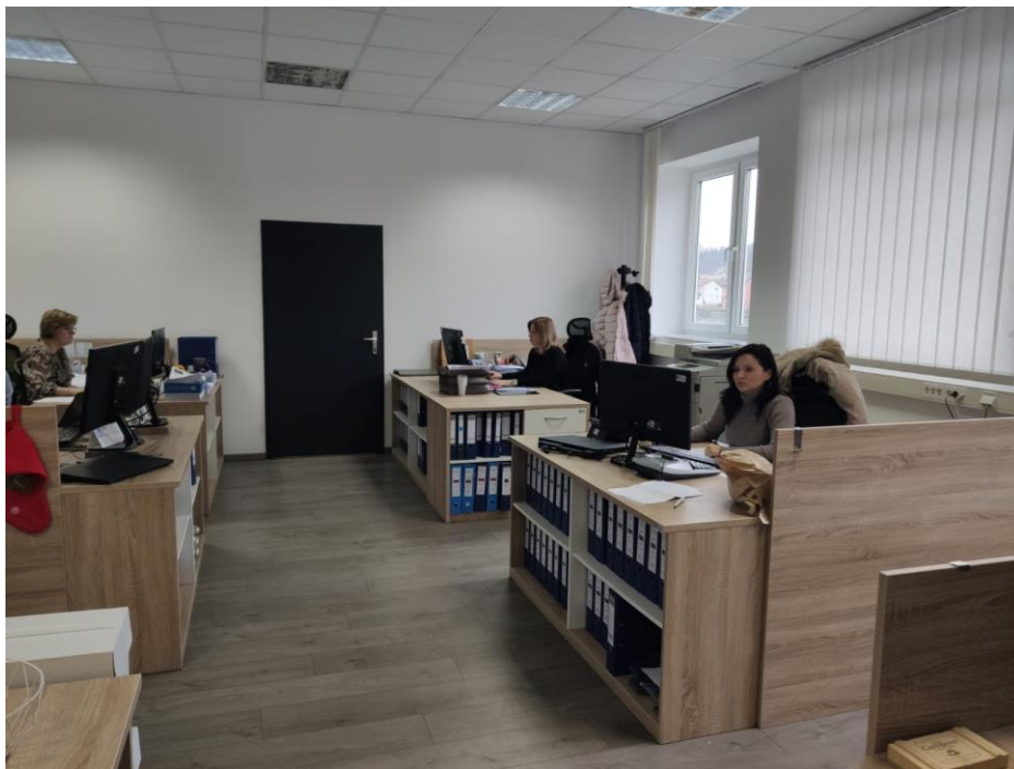
Slika 8. Ured računovodstva

Treća lokacija na kojoj sam mjerio razinu buke bio je ured računovodstva. U uredu se nalazi printer marke Canon te 6 prijenosnih računala marke Fujitsu povezanih s monitorima. Ured računovodstva možete vidjeti na slici 8.