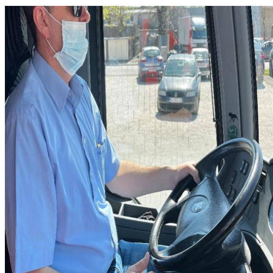
Slika 16. Nepravilno nošenje maske