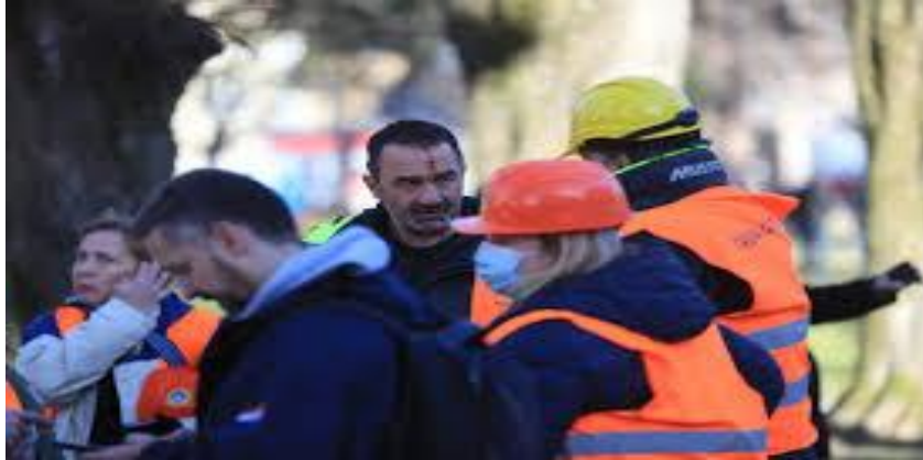
Slika 25. Nošenje zaštitnih maski za vrijeme potresa