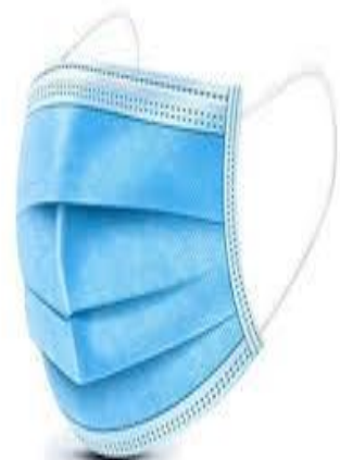
Slika 2. Četveroslojna medicinska maska