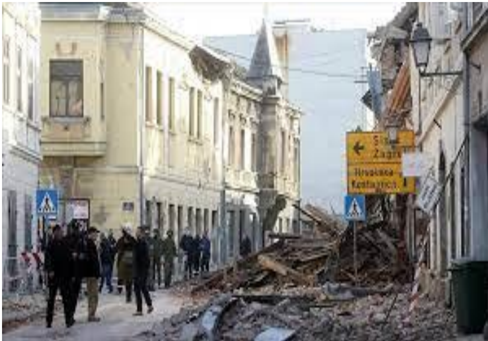
Slika 24. Elementarna nepogoda na potresnom području

Dana 29.12.2020.godine potres magnitude 6,3 pogodio je područje Sisačko-moslavačke županije. Razorni potres uništio je gradove te se još uvijek stanovnici tih gradova nalaze u vrlo teškom i izazovnom vremenu. S ovom elementarnom nepogodom zabilježen je povijesni trenutak u kojem svjedočimo teškom uništenju gradova i stradanju građana. Unatoč svim prirodnim ljepotama i bogatstvima koje imamo, priroda nas je opomenula da nismo njeni gospodari (Slika 24,25). Zaštitne maske u tom trenutku su građanima potresnog područja bile manje važne, najvažnije je bilo da nitko ne nastrada (Slika 26,27). No, poslije potresa po slikama se vidi da nekolicina ljudi ima maske te ih pravilno nosi, dok su drugi s maskom koja je nepravilno stavljena ili ju nemaju na licu.