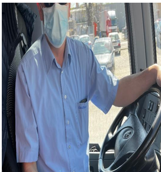
Slika 14. Pravilno nošenje maske