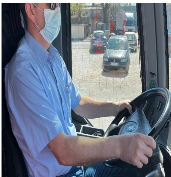
Slika 13. Pravilno nošenje zaštitne maske

Slika 13. i 14. predstavljaju pravilno nošenje zaštitnih maski vozača autobusa, slika 14. i 15. prikazuju nepravilno nošenje maske vozača autobusa.