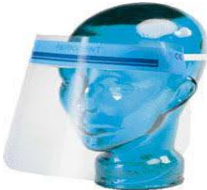
Slika 10. Zaštitni vizir za cijelo lice

Postoje zaštitni viziri za cijelo lice i zaštitni viziri za dio lica( točnije prekriva nos i usta). Zaštitni viziri za cijelo lice pružaju kompletnu prekrivenost u kombinaciji s visokim stupnjem zaštite od nepovoljnih utjecaja i prskanja (Slika 10). Vizir ima s obje strane zaštitu protiv magljenja kako bi se osigurala maksimalna vidljivost. Može se dezinficirati i koristiti više puta. Minimizira razmjenu kapljica između ljudi u izravnom kontaktu [12].