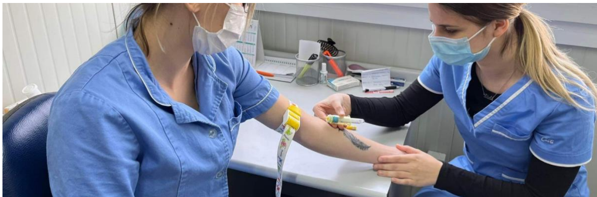
Slika 21. Pravilno nošenje zaštitne maske

Slika 21. prikazuje pravilno nošenje zaštitnih maski u ambulanti opće prakse, dok slika 22. i 23. prikazuju nepravilno nošenje zaštitne maske u ambulantama i trgovinama građevinskog materijala.