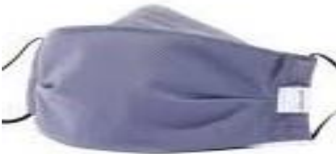
Slika 12. Zaštitne maske od pamuka i lana

Tijekom zime i hladnijih dana preporučljivo je da su zaštitne maske višeslojne i deblje u usporedbi na maske koje nosimo ljeti. Važno je da zaštitna maska štiti od hladnih temperatura i suhog zraka [15, 17].