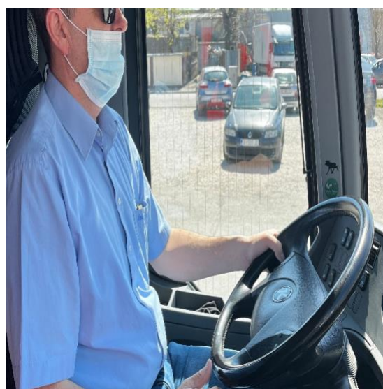
Slika 16. Nepravilno nošenje maske