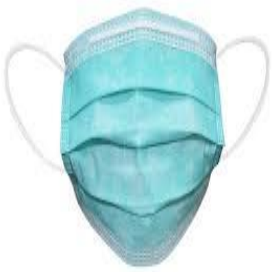
Slika 1. Troslojna medicinska maska

Četveroslojne medicinske maske su visoke kvalitete, prvenstveno namjenjene za bolnice te sve zdrave te sve zdrave ustanove, no koristi se i izvan njih, a imaju puno jaču zaštitu nego sve ostale jednokratne maske (Slika 2). Maske su ojačane i fleksibilne u srednjem dijelu (nosu) kako bi osigurale izvrsnu prozračnost zahvaljujući metalnoj kopči. Elastične vrpce koje se trebaju pričvrstiti na uši su dovoljno fleksibilne i izdržljive [2]