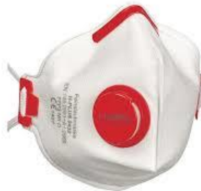
Slika 5. FFP3 maska

Filtrirajuće polumaske ubrajaju se u osobnu zaštitnu opremu u kontekstu zaštite na radu i namijenjene su zaštiti od čestica, kapljica, aerosola u zdravstvenim ustanovama. Njihova primjena je jednokratna (Slika 5). FFP3 ima bolje filtre od FFP2, stopa zaštite 95%.