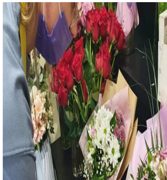
Slika 18. Nepravilno nošenje maske