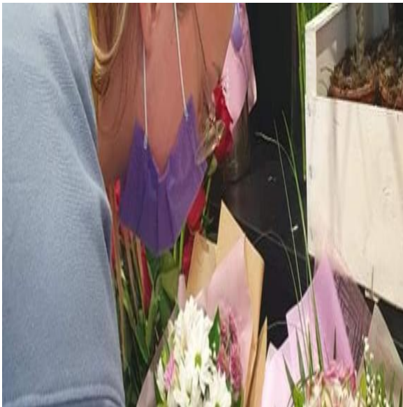
Slika 17. Pravilno nošenje zaštitne maske

Slika 17. i 19. predstavljaju pravilno nošenje zaštitnih maski tijekom radnog vremena u cvjećarnici, slika 18. i 20. prikazuju nepravilno nošenje zaštitnih maski u cvjećarnici.