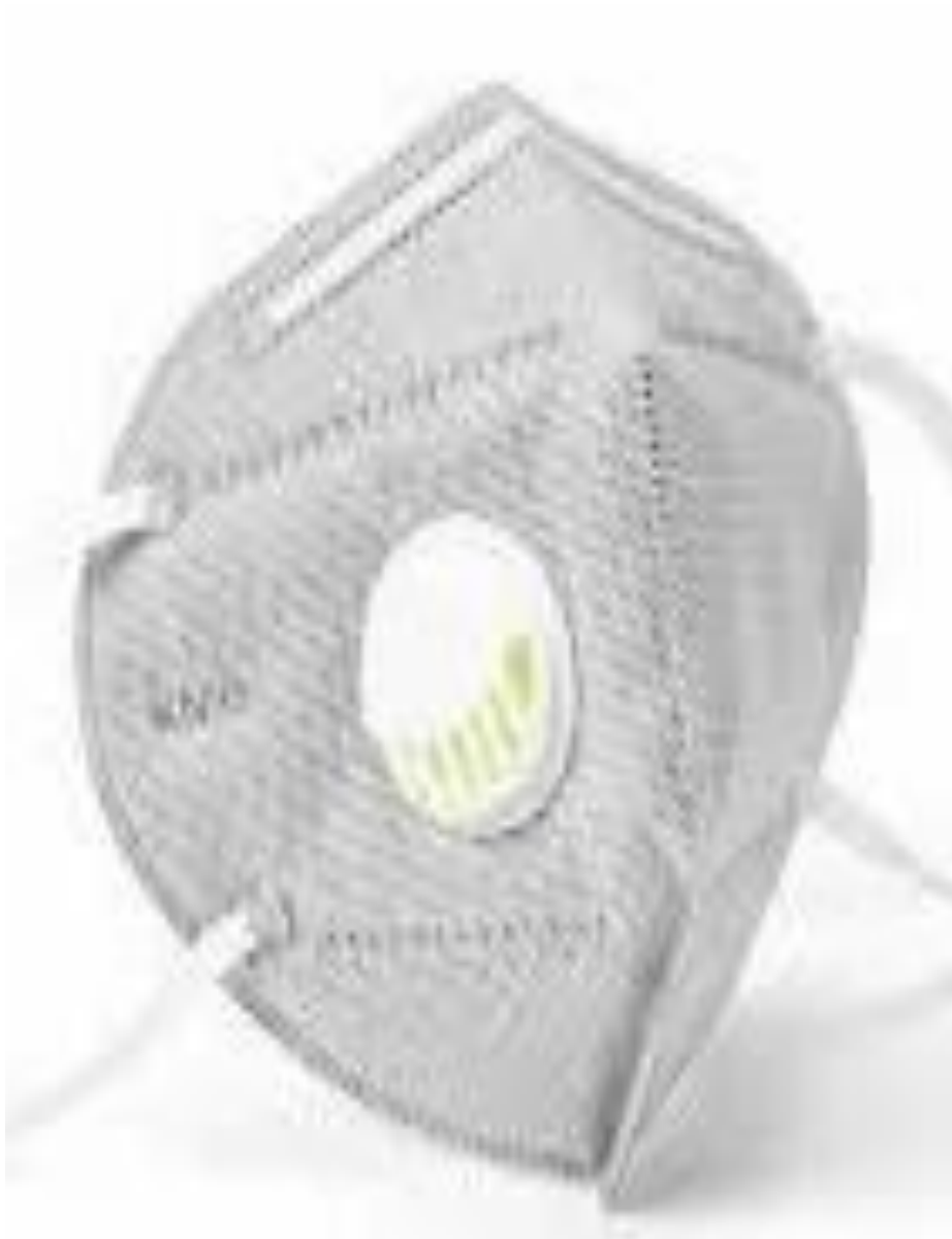
Slika 4. FFP2 sa ventilom

Maske s ventilima filtriraju samo udahnuti zrak i stoga osiguravaju samozaštitu (Slika 4). Višekratna upotreba s filtrima, skupi modeli mogu biti opremljeni uklonjivim filtrima. Plus je što se mijenja samo filter, a baza maske ostaje dugo. Čestom uporabom uštede su znatne. Uz to, prikladne su za „najprljavije“ poslove, na primjer s radioaktivnim tvarima. Nepraktično je kupiti takve primjerke kako bi se zaštitili od sezonskih izbijanja gripe [13].