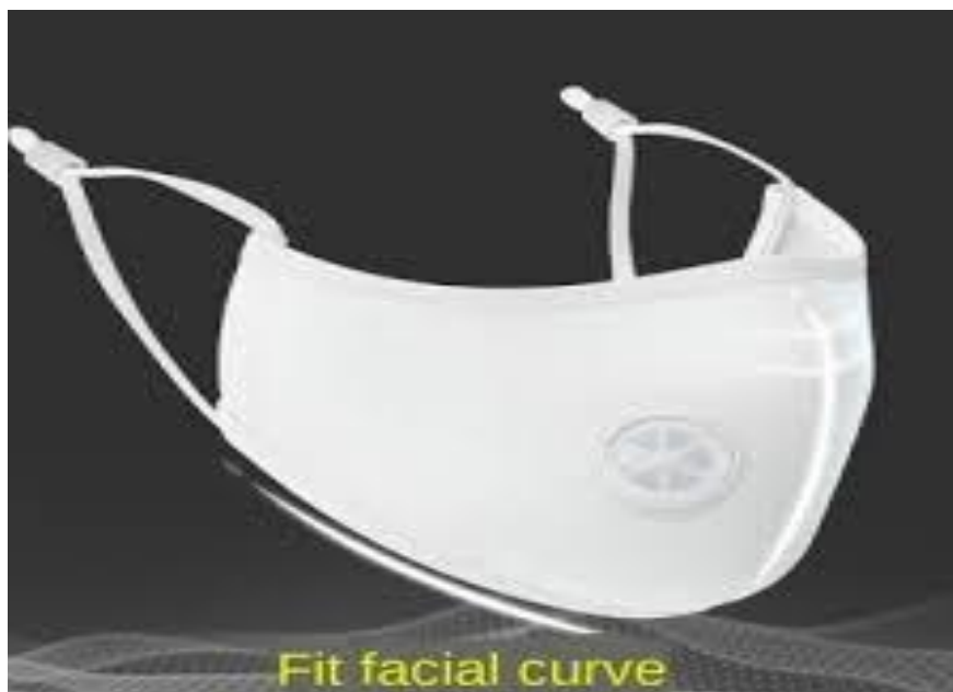
Slika 8. Pamučna maska za lice sa filterom

Maska sa džepom za filter izrađena je od visoko kvalitetne platnene tkanine. Džep omogućuje korištenje maske sa posebno izrađenim, vodonepropusnim filterom (Slika 8). Maske su izrađene od 100% pamuka. Riječ je o višekratnim maskama koje se mogu prati u perilici rublja i peglati. Lako ju je nositi i ne izaziva nelagodu. Osigurava udobnost i jednostavnost primjene te dobro prijanja uz lice. Hidrofobni filter (vodonepropusan) između dva pamučna sloja dodatno sprječava prolazak prašine, velikih kapljica i drugih nečistoća kroz masku. Maska je pogodna za kućnu i vanjsku uporabu, a filteri su izrađeni u Njemačkoj. Američki centri za kontrolu i prevenciju bolesti (CDC) preporučuju nošenje pamučnih maski za lice u javnim sredinama u kojima je druge mjere društvenog distanciranja teško održati. Pamučne maske mogu djelomično otežati prenošenje „obične prehlade i gripe“, ali ne i u slučaju korona virusa. Pamučne maske za lice su odlično rješenje jer su višekratne. Njima štite sebe i svoje bližnje, ali i okoliš. Tkanina od koje je maska izrađena uvelike utječe na kožu lica. Prirodni i mekani materijali poput pamuka su najbolji odabir, jer se koža ispod maski tog materijala ne znoji [14, 18].