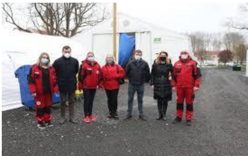
Slika 27. Nošenje zaštitnih maski u potresnom području