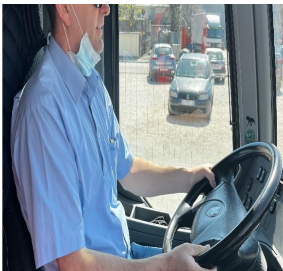
Slika 15. Nepravilno nošenje zaštitne maske