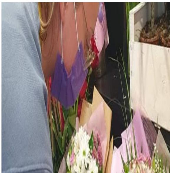
Slika 17. Pravilno nošenje zaštitne maske

Slika 17. i 19. predstavljaju pravilno nošenje zaštitnih maski tijekom radnog vremena u cvjećarnici, slika 18. i 20. prikazuju nepravilno nošenje zaštitnih maski u cvjećarnici.