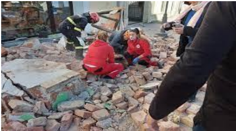
Slika 26. Nošenje zaštitnih maski tijekom spašavanja građana