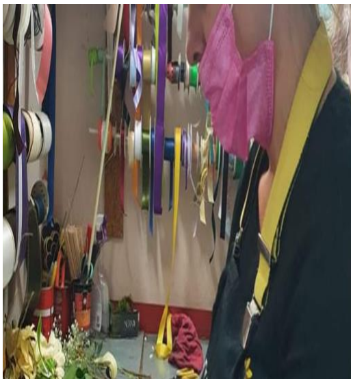
Slika 20. Nepravilno nošenje maske