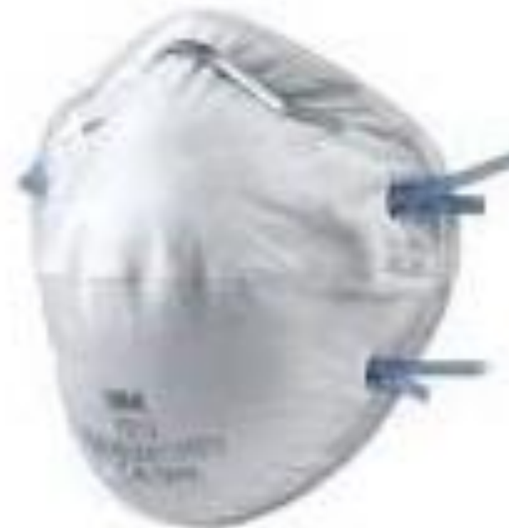
Slika 3. FFP2 bez ventila

KN95 – FFP2 zaštitna maska bez ventila filtrira udisani i izdisani zrak te tako osiguravaju zaštitu osobe koja ih nosi, ali i ljudi u njezinoj blizini (Slika 3). Takve maske mogu se nositi do 8 sati te se koriste u situacijama kada se zna da se pruža neposredna zdravstvena skrb zaraženoj osobi te pri zahvatima u kojima se generira aerosol jer zaustavljaju 95% i više, odnosno 98% čestica, ovisno o jačini filtracije [13].