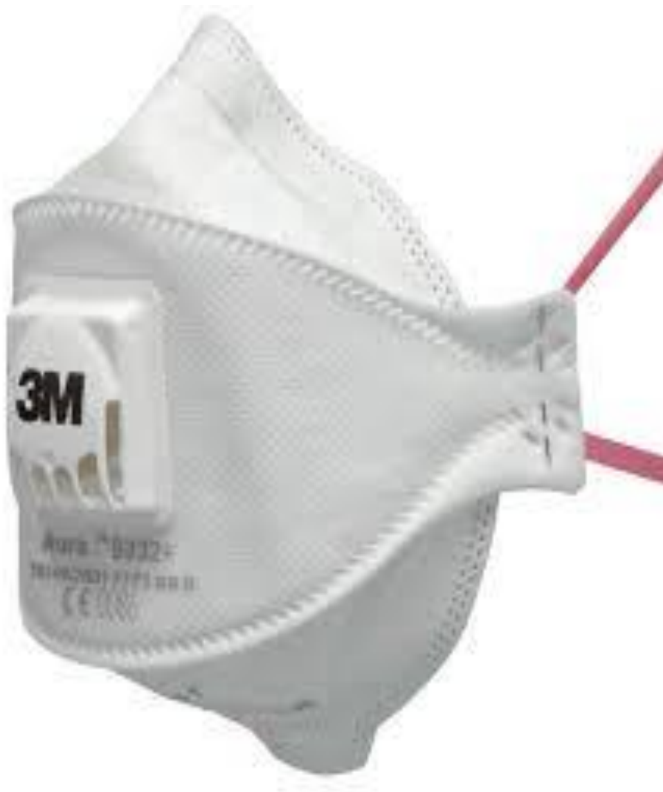
Slika 6. Filarska polumaska (respirator)

može se zaključiti da zaštitne maske s oznakom N95, KN95, P2 I FFP2 imaju podjednaku razinu filtriranja (>94%) i da su ekvivalentne. Isto tako, ekvivalentne su maske koje nose oznake N99, KN99, P3 I FFP3 po razini filtriranja čestica veličine 0,3 mikrometra (>98%). Takve maske mogu biti izvedene sa i bez ventila. Maske sa ventilom omogućavaju izbacivanje zraka iz pluća bez filtriranja i time štite osobu koja ju nosi, a ostale osobe u blizini uopće ne štiti ukoliko bi nositelj maske bio zarazan [4, 13].