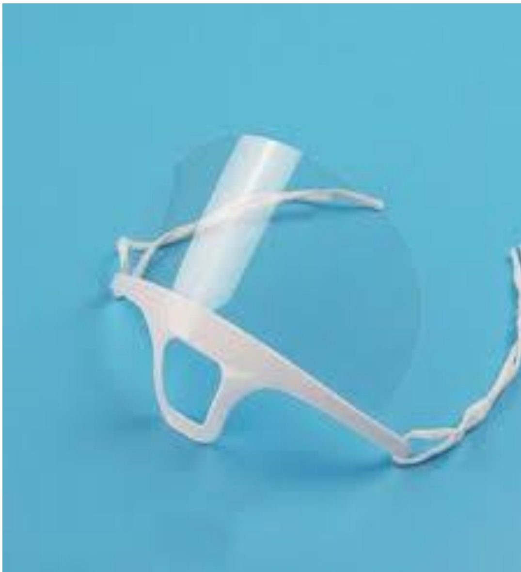
Slika 11. Zaštitni vizir za nos i usta