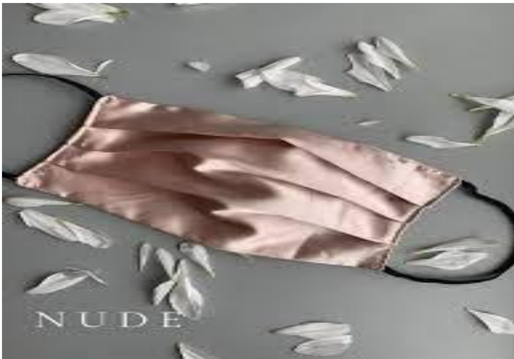
Slika 9. Svilena maska za lice