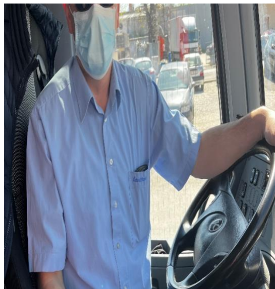
Slika 14. Pravilno nošenje maske