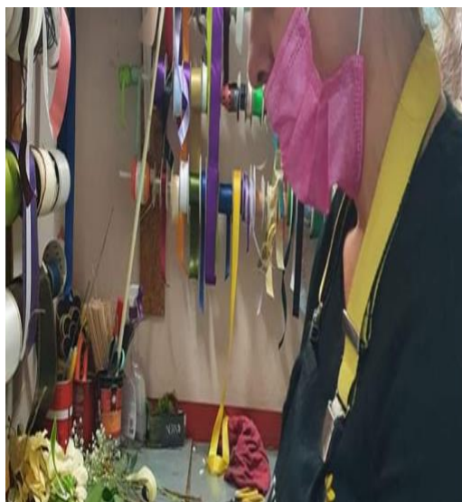
Slika 20. Nepravilno nošenje maske