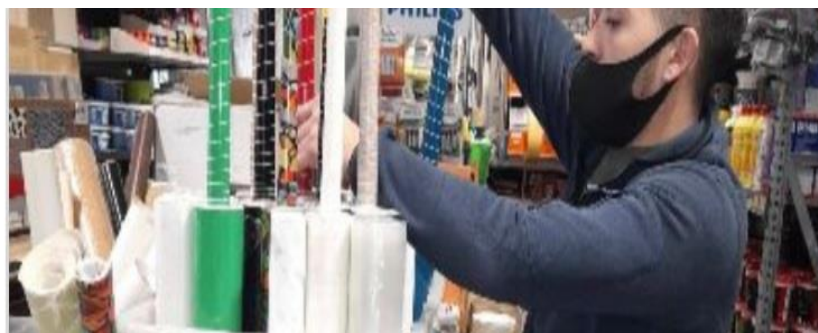
Slika 23. Nepravilno nošenje zaštitne maske