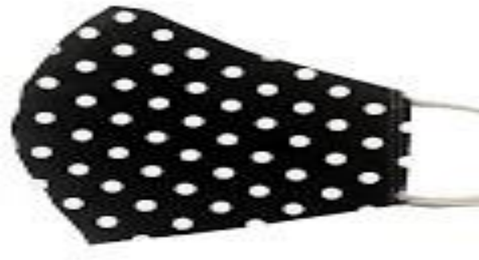
Slika 7. Platnena maska za lice