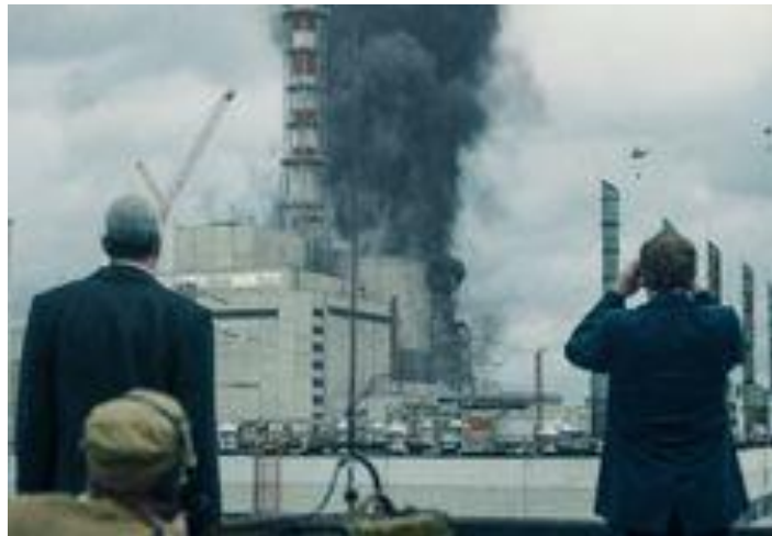
Sl. 3. Požar u Černobilskoj nuklearnoj elektrani [22].

te sustava za hlađenje. Nuklearne elektrane su posjedovale generatore koji bi stvarali električnu energiju u takvim slučajevima, no, cilj je bio utvrditi koliko će vremena proći od zaustavljanja turbine do pokretanja generatora. Svi u Sovjetskom Savezu su smatrali kako je ovakav test neophodan, te da ga je važno izvršiti prije puštanja reaktora u rad. Glavni problem je predstavljalo moguće pregrijavanje jezgre reaktora od nekontrolirane fisije što bi posljedično rezultiralo eksplozijom. U tom bi slučaju radioaktivni materijal otišao u čitavu atmosferu što bi rezultiralo velikim posljedicama kao što i jest [21]. Na slici 3. možemo vidjeti požar iz daljine na Černobilskoj nuklearnoj elektrani.