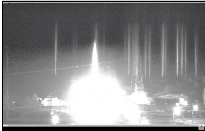
Sl. 4. Požar u nuklearnoj elektrani Zaporožja u Ukrajini [24].

osobe, no nije bilo smrtno stradalih. Ukrajinsko nuklearno regulatorno tijelo uspjelo je održavati komunikaciju s osobljem u nuklearnoj elektrani u kojoj trenutno rade dva od šest reaktora. Također, prema navodima IAEA-e, tehnički sigurnosni sustavi elektrane su ostali netaknuti, jedna telefonska linija je izgubljena, ali druga je funkcionalna kao i komunikacija putem mobitela. Bazeni za istrošeno gorivo ostali su netaknuti [23]. Nuklearna elektrana je nakon detaljnog pregleda i inspekcije nastavila sa svojim radom.