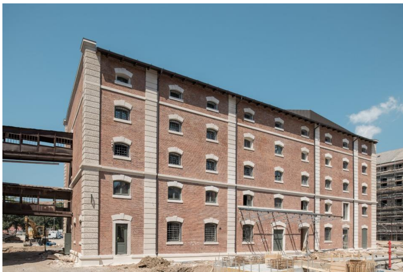
Slika 13. Dječja kuća [26]

Početakom 2019. g. započeli su prvi radovi na Ciglenoj zgrade kompleksa Benčić u koju će se nakon obnove pozicionirati Dječja kuća. Glavni projektant tog objekta bio je mr.sc. Saša Randić, dipl.ing.arh. Radove je izvodila tvrtka IN-GRAD d.o.o. iz Zagreba, a izvodili su se na površini od 1948 m 2 . U ožujku 2021. Dječja kuća je otvorena.