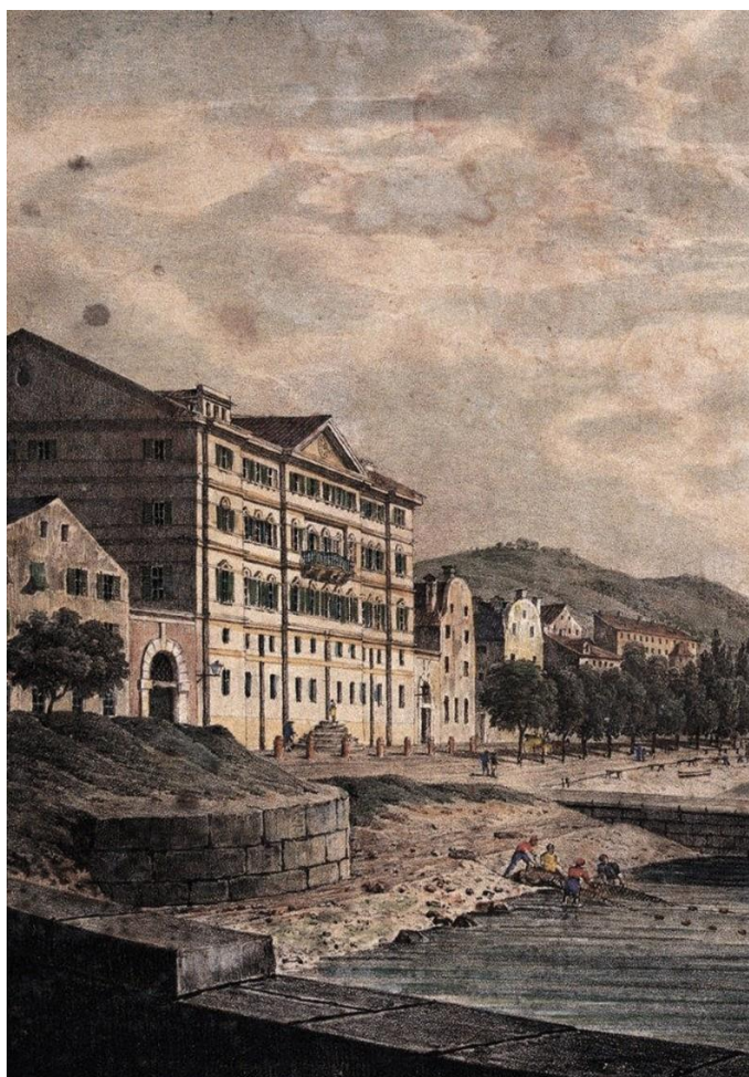
Slika 5. palača šećerane u XVIII. st. [10]

Središnji je objekt nekadašnjeg velikog kompleksa rafinerije šećera, a imala je i administrativnu, gospodarsku, te stambenu funkciju. Njome je upravljala povlaštena tršćansko-riječka kompanija. Trgovačko društvo iz Antwerpena „Proli i Arnold“ u Rijeci je osnovalo šećeranu pod nazivom „Haupt-Handlungs-Compagnie von Triest u Fiume“, u cilju jačanja gospodarstva primorja. S obzirom da je Rijeka u to doba bila pod vlašću Austrije i Habsburgovaca, željelo se stvoriti jaku šećernu industriju kakva do tada nije postojala u monarhiji.