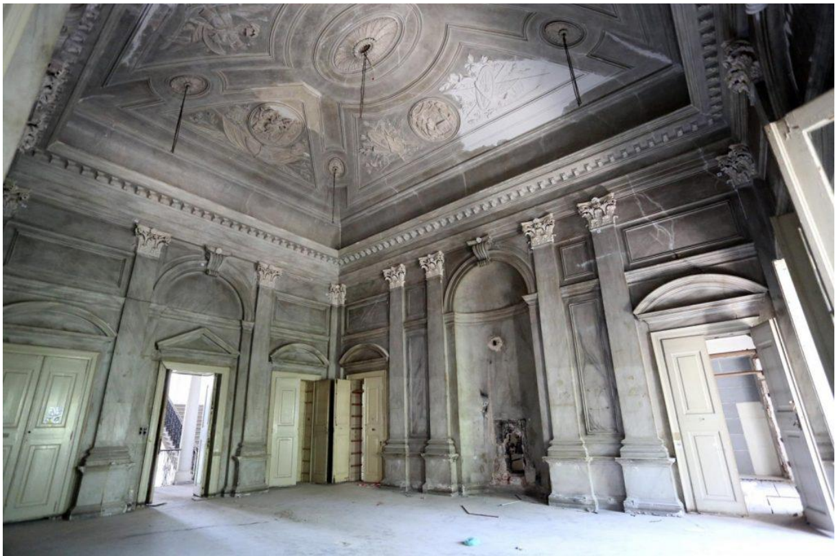
Slika 7. unutrašnjost palače prije restauracije [13]

O raznolikosti uređenja palače svjedoče i vrata, bravarija, kovane željezne ograde i ukrasni koloturi za spuštanje rasvjetnih tijela. [12]