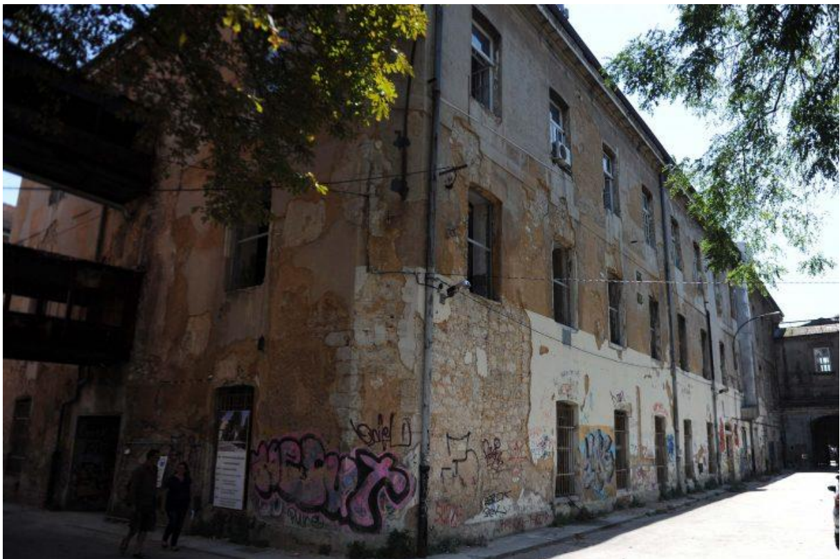
Slika 10. H-objekt prije rekonstrukcije[19]

u H – objektu smješten je Muzej moderne i suvremene umjetnosti Rijeka. [18]