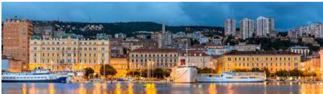
Slika 1. Panorama Rijeke [2]

Rijeka se nalazi na sjevernoj obali Riječkog zaljeva. Riječki zaljev sastoji se od Velih vrata (morski prolaz između istarskog kopna i otoka Cresa), Srednjih vrata (morski prolaz između Cresa i otoka Krka) te Malih vrata (morski prolaz između Krka i kopna). Spojen je s južnim dijelom Kvarnerskog zaljeva. Riječki zaljev velike dubine (u prosjeku 60 m) omogućio je Rijeci da postane važna morska luka. Dovoljno je dubok za uplovljavanje najvećih brodova, što je Rijeci omogućilo da postane važna morska luka, a time se razvijala i industrija. [1]