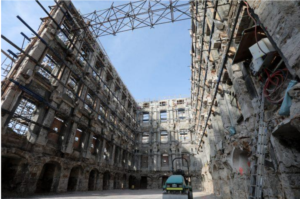
Slika 16. T-objekt tijekom rekonstrukcije [31]

Radovi na T- objektu počeli su u rujnu 2019. g. Radove izvodi tvrtka VG5 d.o.o., a vrijednost ugovorenih radova iznosi 68,5 milijuna kuna, a glavni projektant je mr.sc. Saša Randić, dipl.ing.arh.