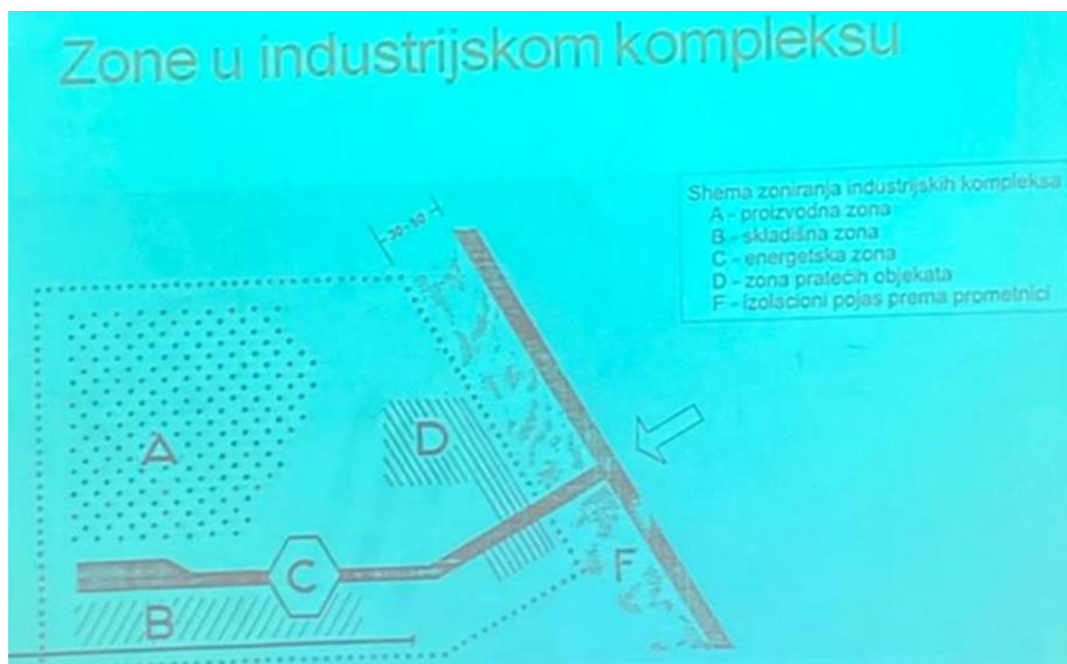
Slika 3. prikaz zona u industrijskom kompleksu [6]

Kompleks je sadržavao i energetska zonu, odnosno trafostanicu i kotlovnice, pa čak i zeleni pojas prema prometnicama.