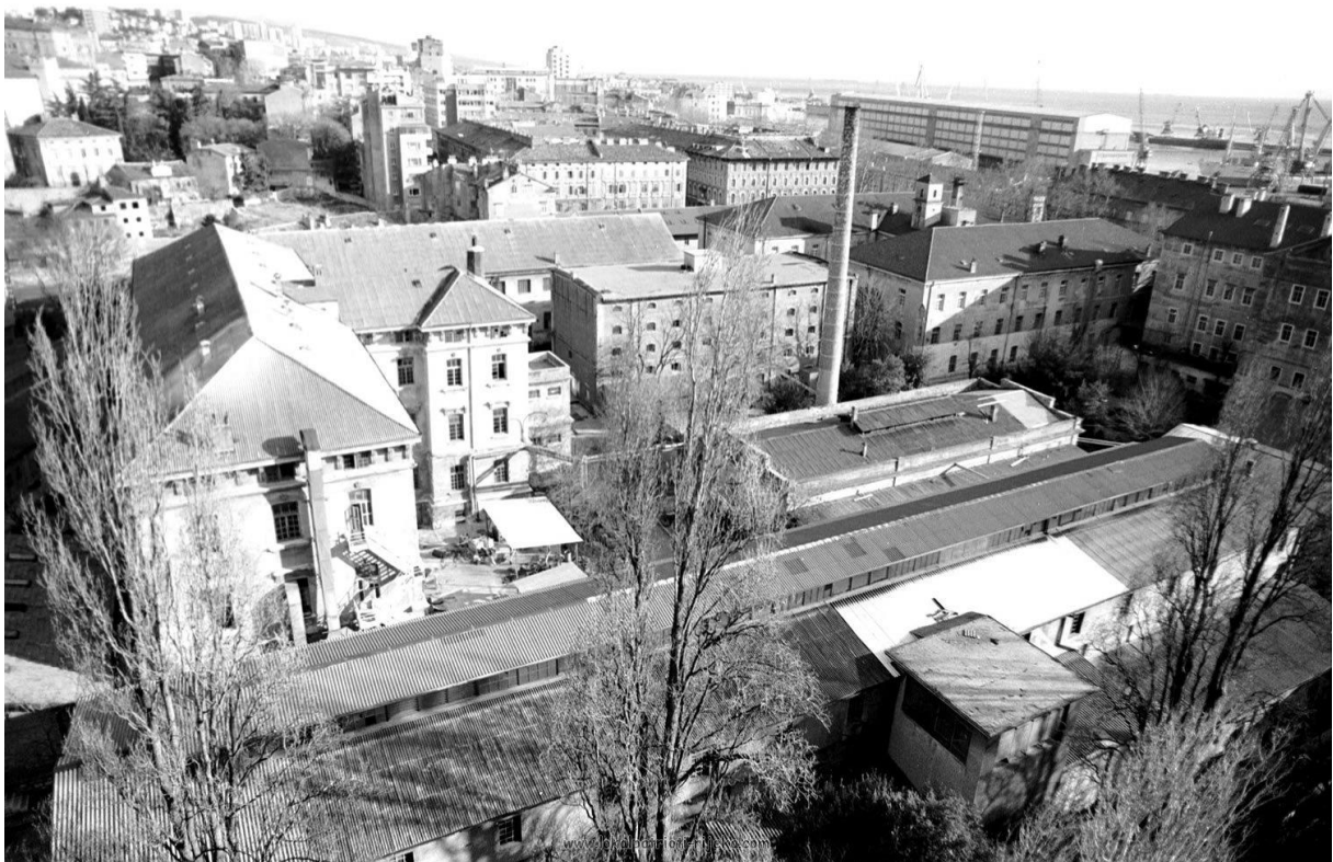
Slika 4. Tvornica Rikard Benčić slikana iz zraka[9]

Koliko je tvornica bila važna za Rijeku, njen razvitak i naseljavanje najbolje govori podatak da je tokom osnivanja tvornice, ona imala 371 zaposlenih radnika, dok je 1987. taj broj iznosio oko 1200 radnika svih profila. Od 1948. do 1988. tvornica je sagradila ili kupila 352 stana za svoje radnike (najviše na području Drenove). Bitni su bili i uvjeti rada, te benefiti kojeg su radnici imali: kantu koja se brinula o toplim obrocima, ordinaciju liječnika opće prakse i stomatologa u sklopu tvornice, razvijenu zaštitu na radu, knjižnicu, razne sportske aktivnosti i klubove... Izdavali su svoje novine u kojima su obavještavali svoje radnike o svemu što se dešava u tvornici, ostvarene rezultate, planove, novosti vezane uz rad u tvornici. [8]