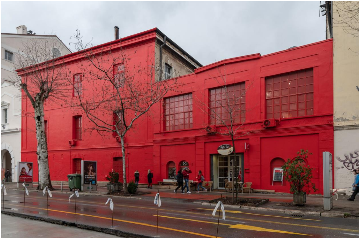
Slika 11. pročelje MMSU [20]

Drugom fazom prenamjene H – objekta planira se rad Muzeja na svim površinama objekta. Integritet Muzeja postignuti će se širenjem Muzeja na ostatak još neuređenih površina na dvije gornje etaže. Time će se napraviti mjesta za sav potreban sadržaj, te će se stvoriti preduvjeti za daljnje širenje i razvoj Muzeja. Te, još neuređene, prostori u H – objektu 2020.g. otkupio je Grad Rijeka od PIK Rijeka, te se uskoro planira nastavak adaptacije i proširenje Muzeja.