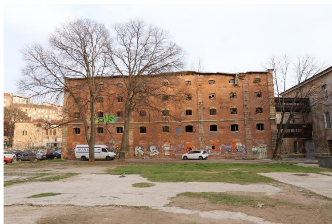
Slika 12. Ciglenu zgrada prije rekonstrukcije [24]

Ciglenu zgrada se nalazi se između T- objekta (buduće Gradske knjižnice Rijeka) i H – objekta (Muzeja moderne i suvremene umjetnosti) kompleksa “Benčić”, a na mostovima je povezana sa H – objektom u kojem se nalazi Muzej moderne i suvremene umjetnosti. [23]