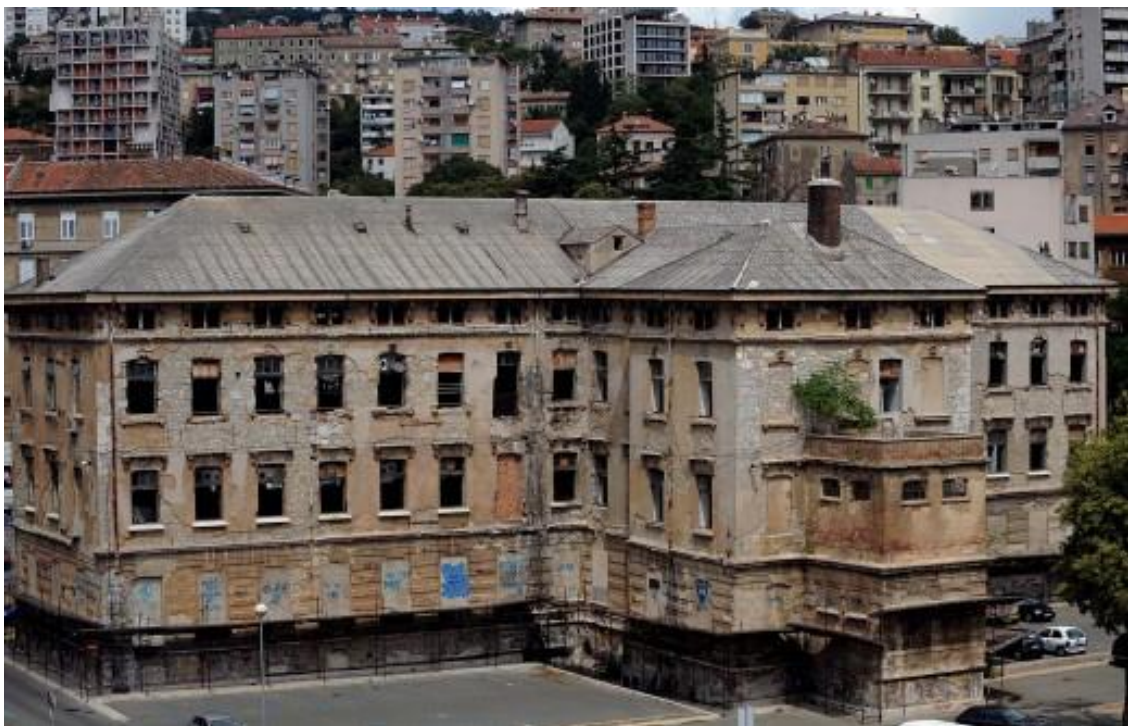
Slika 15. T - objekt prije rekonstrukcije [30]

Obnova i rekonstrukcija pogonske zgrade Rikard Benčić i njena prenamjena iz nekadašnje industrijske u urbanu, kulturnu i javnu namjenu je središnji i kapitalni projekt. U T – objekt pri završetku useljava se Gradska knjižnica Rijeka, a osim kulturne svrhe, obnovljena zgrada imati će u svojem manjem dijelu i komercijalnu namjenu (zalogajnica, bar, caffe..). S obzirom da rekonstrukcija i radovi na zgradi još nisu završili, ne mogu govoriti kako izgleda finalna rekonstrukcija, ali po projektu je jasno vidljivo kako će u konačnici sve izgledati. [29]