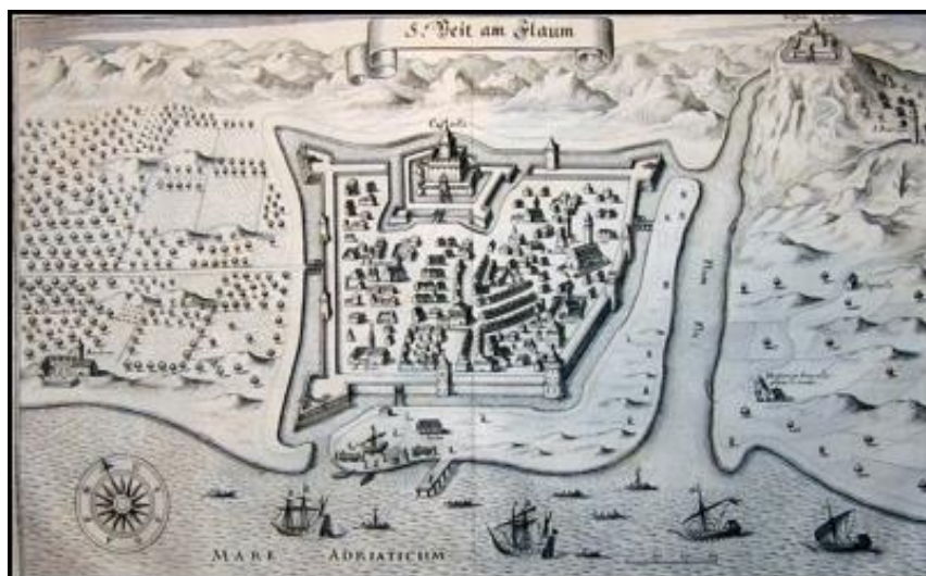
Slika 2. Rijeka 1650. g [3]

Tek 1848. grad je uključen u sastav Banske Hrvatske, ali unatoč tome, to nije doneslo mir. Borba za Rijeku između Hrvatske i Mađarske sve se više zaoštravala, te je 1868. donesena Hrvatsko-ugarskom nagodba, odnosno “riječka krpica”, kojom je postignut dogovor prema kojemu Rijeka dolazi pod neposrednu upravu. Tada se Rijeka ponovno ubrzano razvija i postaje najveći lučki i pomorski grad. 1918. godine, nakon raspada Austro-Ugarske i Rijeka i Sušak postaju sastavni dio Države Srba, Hrvata i Slovenaca, ali Rijeku ubrzo okupira Kraljevina Italija. To je prvi put da je Italija tražila Rijeku, već ju je prepuštala Hrvatskoj. Nastupa prijelazno razdoblje koje u konačnici dovodi da 1924. Rijeka ipak pripala Italiji. Opet se bilježi ubrzani gospodarski pad i Rijeka postaje periferni gradić, a Sušak, koji je ostao uključen u sastav Kraljevine SHS, ubrzano raste.