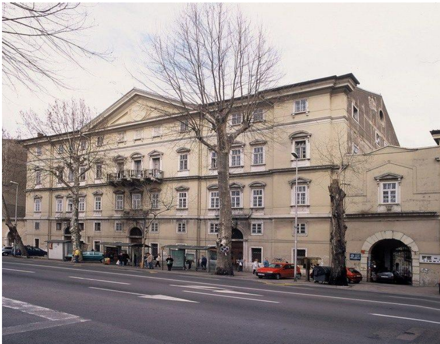
Slika 6. Vanjski izgled Palače šećerane [11]

Vanjski izgled karakteriziraju simetrični prozori, dok su iznad njih naizmjenični trokutni i segmentni nadstrešnici na prvom i drugom katu. Još jedna karakteristika osamnaestog stoljeća je vijenac oko strmog krova te timpan na vrhu zgrade. Prvi i drugi kat vidno su odijeljeni vijencem, a izbočeni kameni koji nose balkone na drugom katu, jedini su ukrasi na pročelju zgrade. Jedina nepravilnost na pročelju su mali, umetnuti prozori na polukatu (između prizemlja i prvog kata), koji su nastali zbog potrebe za visokim i svijetlim skladištima. Središnji izbočeni dio u fasadi (rizalit) dominira i na njemu se nalaze razni dekorativni ornamenti. Osnovnu tlocrtnu shemu zgrade čine 2 osi: poprečna koja je u cijeloj visini i određena glavnim stubištem i velikim prostorijama uz južno pročelje, i uzdužna, postavljena u smjeru istok-zapad i određena središnjim dugačkim hodnicima na svim etažama.