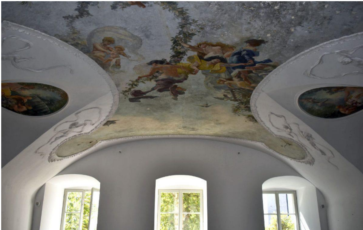
Slika 9. motiv oslika [17]

Na ostalih 4.272 m 2 pored stalnog postava, predviđene su povremene tematske izložbe i kreativne radionice te uslužni sadržaji. Jedna od posjećenijih postava i izložbi bila je „Nepoznati Klimt – ljubav, smrt, ekstaza“, prikazujući slike što su ih izradili Gustav Klimt, Ernst Klimt i Franz Matsch za riječko Hrvatsko narodno kazalište Ivan pl. Zajc.