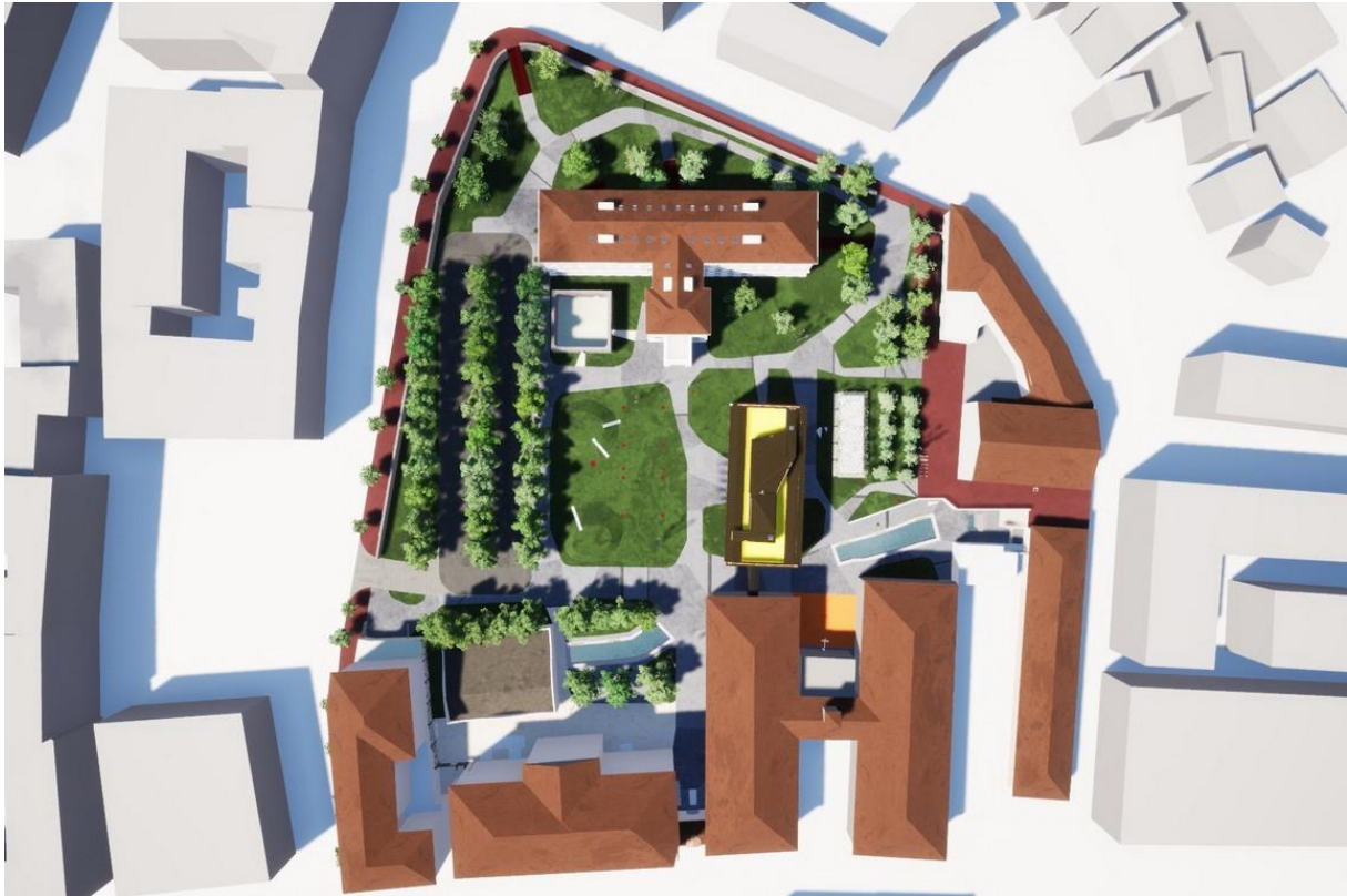
Slika 17. idejni projekt uređenja Art kvarta [34]

park između zgrada, koji ima funkciju trga sa zelenilom i otvorenim potokom po kojem je kvart i dobio naziv. To posebno veseli, s obzirom da je potok Brajda godinama bio prekriven, a sad je ponovo površinski i otvoren. Površine pod parkovima bile su prisutne kroz cijelu povijest tako da je zadržano zelenilo, uključujući i manji parkić uz Palaču šećerane.[33]