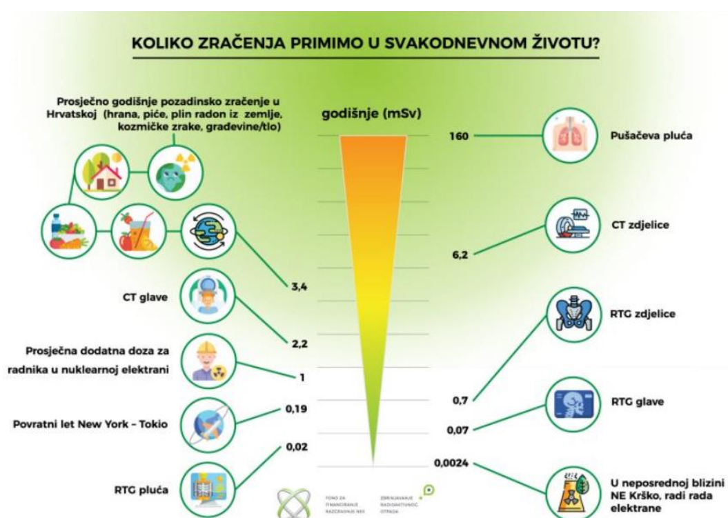
Slika 2. Radijacija tijekom čovjekovog života

U uobičajenijem analognom procesu, zvanom hvatanje elektrona, pronađeno je da neki nuklidi bogati protonima hvataju vlastite atomske elektrone umjesto emitiranja pozitrona, a zatim ti nuklidi emitiraju samo neutrin i gama zrake iz pobuđene jezgre (i često također Auger elektroni i karakteristične X-zrake, kao rezultat preuređivanja elektrona kako bi se popunilo mjesto nedostajućeg zarobljenog elektrona). Ove vrste raspada uključuju nuklearno hvatanje elektrona ili emisiju elektrona ili pozitrona, te tako djeluje na pomicanje jezgre prema omjeru neutrona i protona koji ima najmanju energiju za dani ukupan broj nukleona. To posljedično proizvodi stabilniju (nižu energiju) jezgru [8].