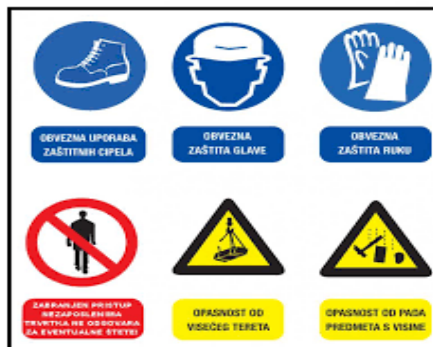
Slika 8. Znakovi zaštite kod rada na strojevima