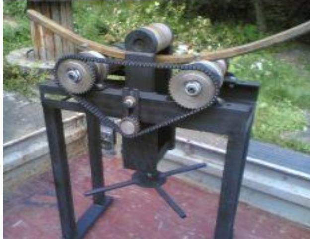
Slika 5. Stroj za savijanje cijevi

Isprešavanje ili ekstruzija služi u proizvodnji raznovrsnih profila, šipki, traka, cijevi konstantnog presjeka, od lakih i obojenih metala, te mekih čelika. Najveće prednosti su: mogućnost proizvodnje profila najsloženijih oblika te odlično stanje površine gotovog proizvoda. Gotovi proizvod može biti: kontinuirani (teoretski beskonačno dugi proizvod) ili polukontinuirani (proizvodnja rezanih ili kraćih predmeta).