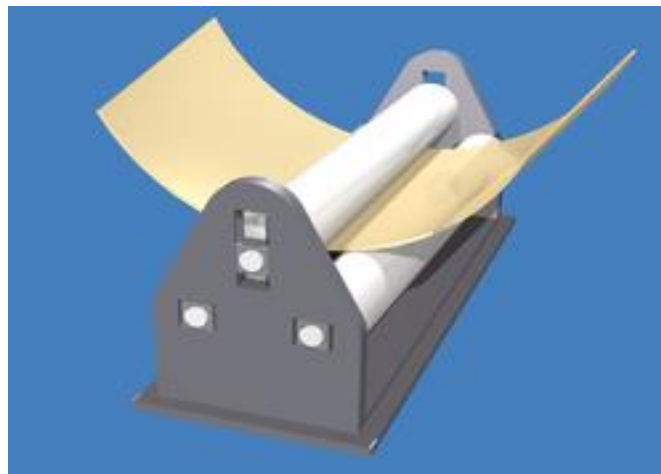
Slika 4. Mehanička savijačica s 3 valjka

Savijanje limova je postupak obrade metala bez skidanja strugotine kod kojeg se u poprečnom presjeku unutrašnji dio skraćuje i opterećen je na tlak, dok se vanjski dio produljuje i opterećen je na vlak. Savijanje lima se dijeli na: kružno savijanje, savijanje pod kutom (oštrokutno savijanje) i profilno savijanje, slika 4, mehanička savijačica s 3 valjka.