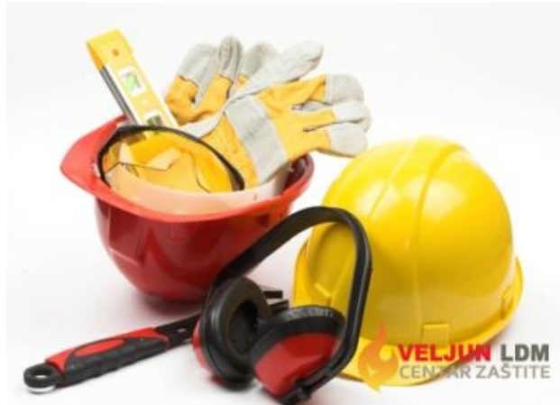
Slika 8. Zaštitna sredstva