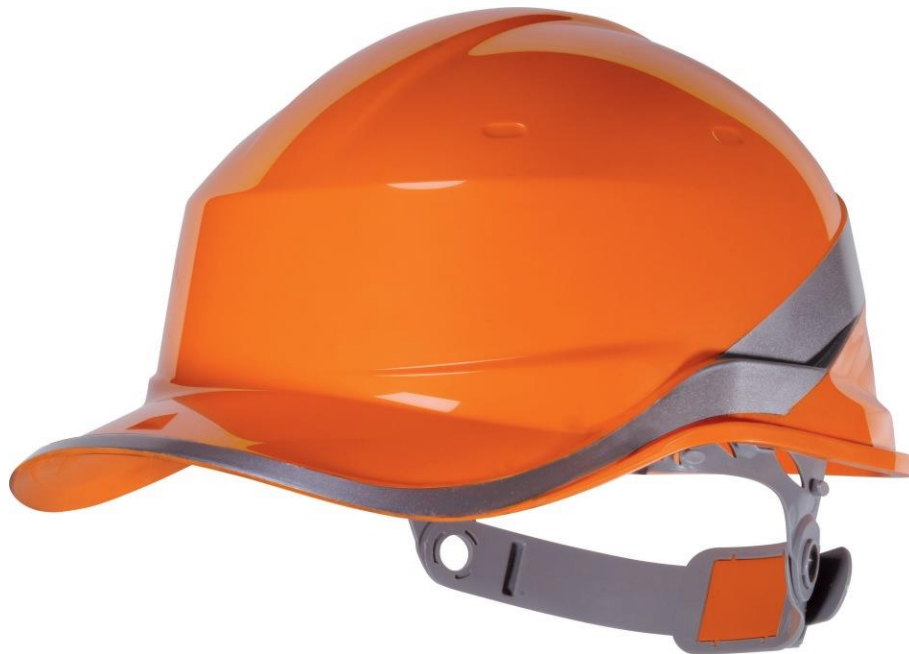
Slika 12. Zaštitna kaciga