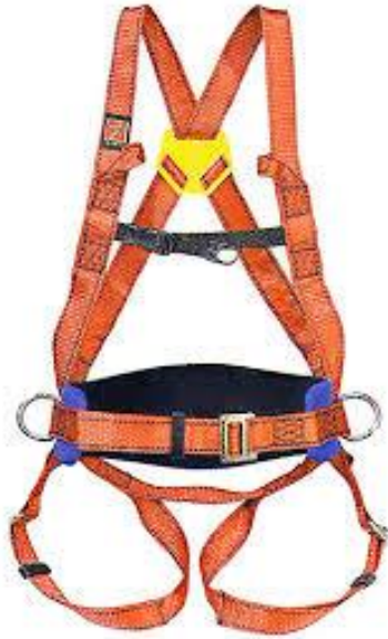
Slika 7. Zaštitni pojas