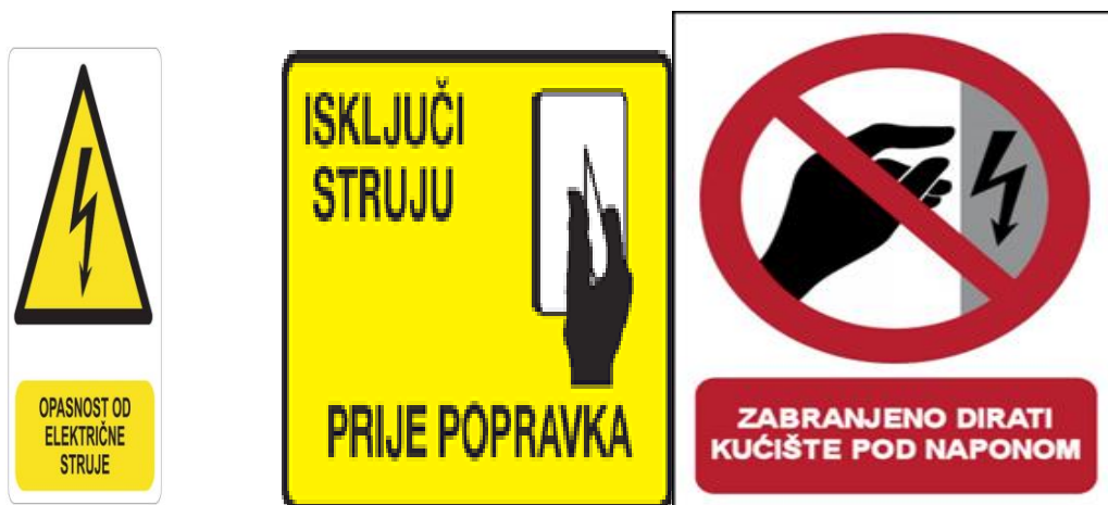
Slika 6. Znakovi opasnosti

Na vratima se mora postaviti sigurnosni znak zabrane pristupa nestručnim osobama, jasno vidljiv iz smjera ulaznja u prostoriju ili prostor u kojem se nalazi električno postrojenje ili instalacija.[11]