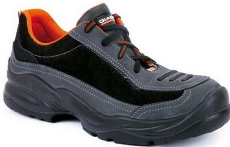
Slika 10. Zaštitne cipele

Cipele omogućuju maksimalnu zaštitu od svih mogućih štetnih utjecaja, a istovremeno osiguravaju maksimalnu udobnost.