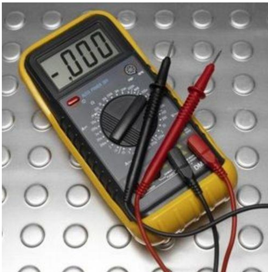
Slika 2. Uređaj za mjerenje struje(ampermetar)