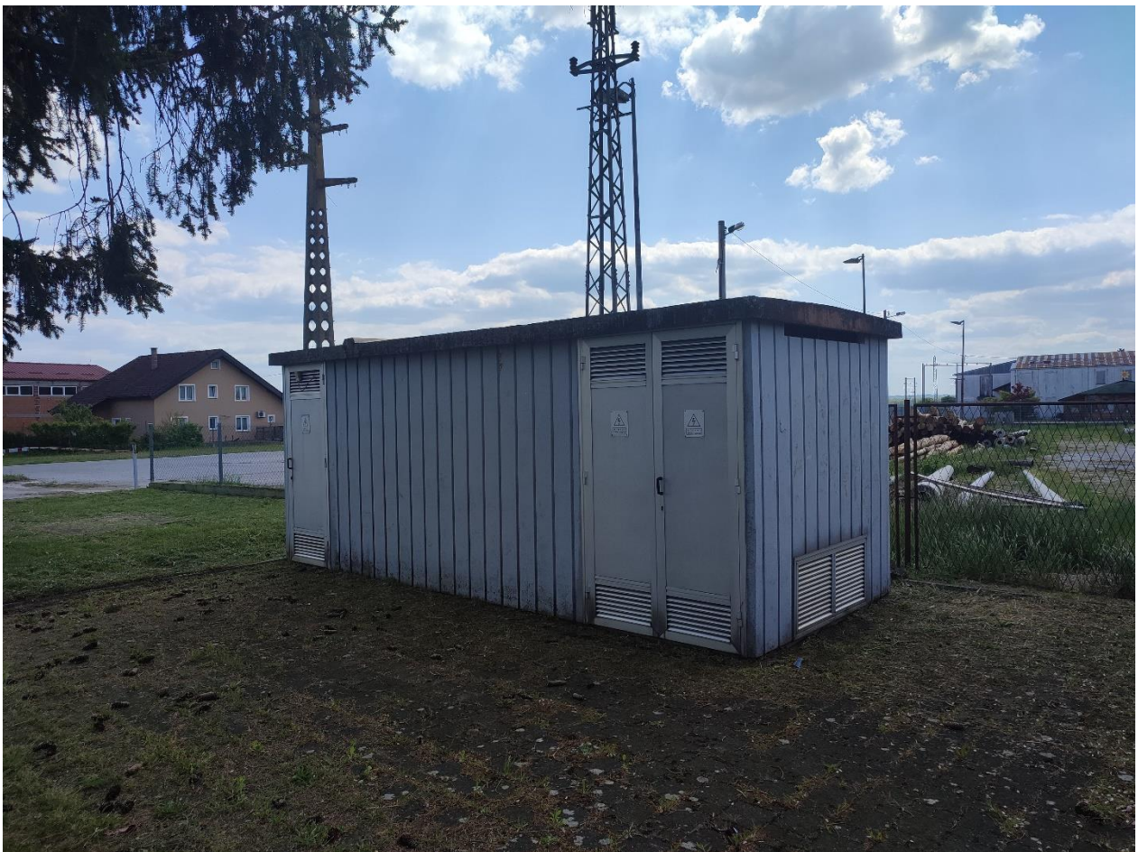
Slika 3. Trafostanica 20/04 kV