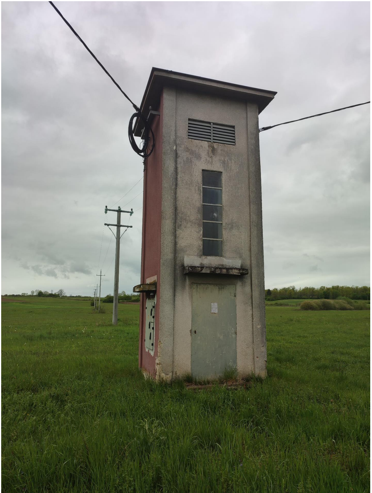
Slika 4. Trafostanica 20/04 kV