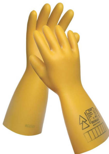
Slika 11. Zaštitne rukavice za električare