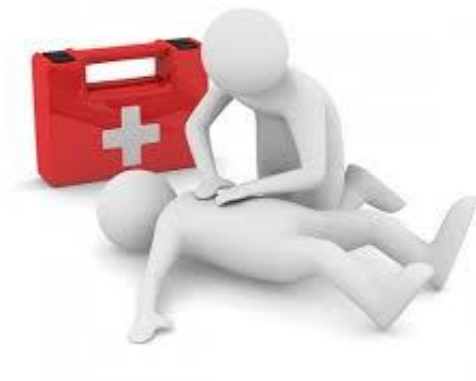
Slika 9. Pružanje prve pomoći