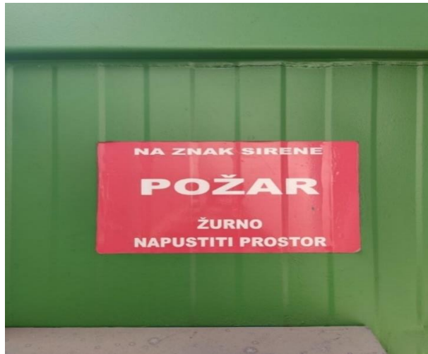
Slika 1: Oznaka obavijesti u slučaju požara