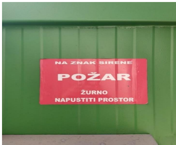
Slika 1: Oznaka obavijesti u slučaju požara