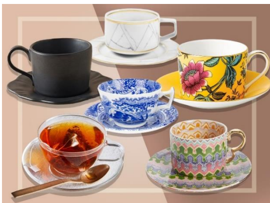
Slika br. 5 Izgled šalica za čaj (2)