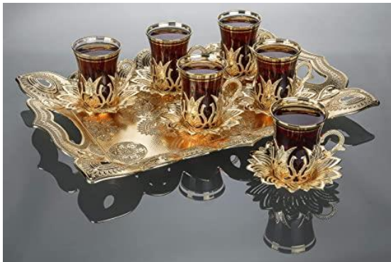
Slika br. 4 Izgled šalica za čaj

Ono po čemu će ugostiteljski objekt „Aroma“ prvenstveno biti poznat su kave i čajevi. U ponudi će biti raznih vrsta čajeva. Planirano je u asortimanu preko 50 različitih okusa čajeva. Čajevi su podrijetlom iz Engleske. Razlikuju se od čajeva u ostalim kafićima po znatno intenzivnijem, bogatijem i kvalitetnijem okusu. Čajevi će gostima biti servirani već napravljeni u šanku, sa svim potrebnim dodacima, u posebnim šalicama. Planirano je s vremenom proširiti asortiman te potencijalno zamijeniti okuse koji neće biti primamljivi gostima, tj. one koji se neće toliko prodavati. Bitno će biti da, bez obzira na sve, korisnici uvijek uživaju u kavi i čajevima. Kava će također imati kvalitetan i prepoznatljiv okus, budući će ih spravljati educirani bariste. Svaka kava će na sebi imati i Latte Art uzorak, te će svojim posebnim izgledom privlačiti goste. Proizvodi će se, također, moći kupiti i ponijeti za u šalicama za van. Šalice bi bile od papira. U ponudi se također nalaze svježe cijedena naranča i limunada. Asortiman ostalih pića nije toliko velik s posebnim razlogom. Lokal je prvenstveno namijenjen konzumaciji pića i čajeva.