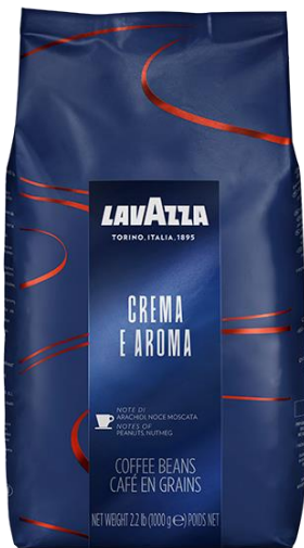
Slika br. 6 Lavazza kava