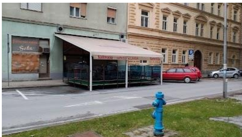
Slika br.3 Caffee bar Lavsa