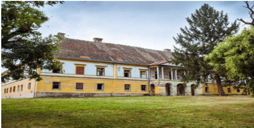
Slika 5 Dvorac Esterhazy u Dardi