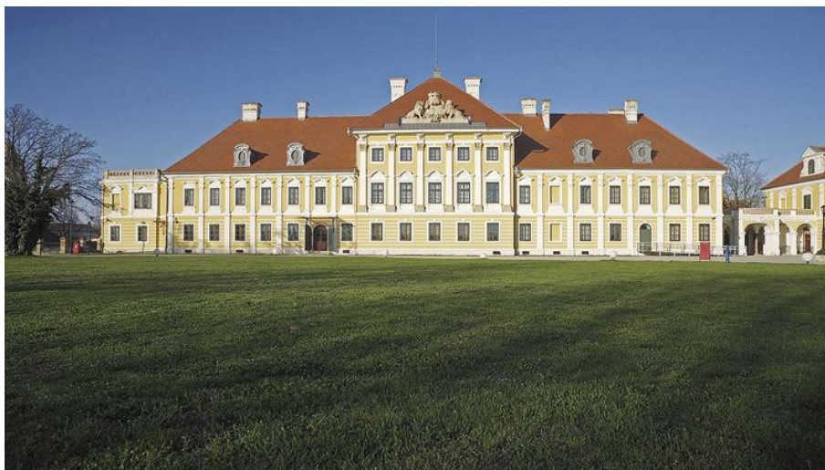
Slika 1 Dvorac Eltz u Vukovaru