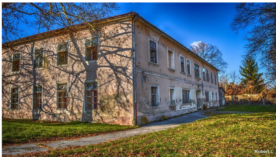
Slika 10 Trenkov dvorac u Pakracu