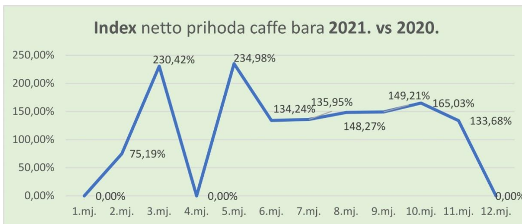
Grafikon 3. Indeks netto prihoda caffe bara 2021. vs. 2020.