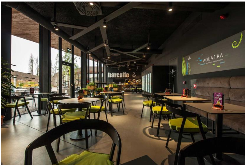
Slika 11. Caffe bar Aquatika – Slatkovodni akvarij Karlovac