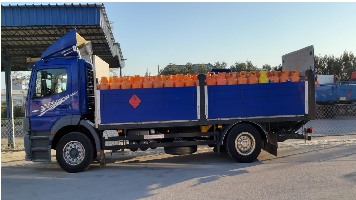
Slika 21. Prijevoz plinskih boca [31]