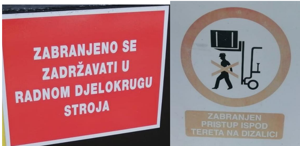
Slika 19. Zabrana zadržavanja u radnom Slika 20. zabranjen pristup ispod djelokругu stroja. [13] tereta. [13]

Znakovi sigurnosti vrlo su važni jer u postrojenju vizualno podsjećaju radnike na sigurnosne mjere koje moraju poduzimati. Također, znakovi mogu slati upozorenja ili širiti zabrane. U nastavku ću prikazati neke od znakova sigurnosti koji su bitni kod rada s viličarom.