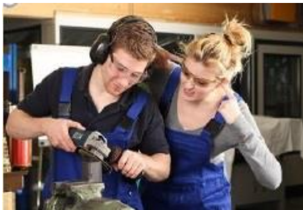
Slika 7. Buka prilikom obrade metala brušenjem. [10]

Slika 7. prikazuje jedan od mnogih mogućih izvora buke prilikom obrade metala, a to je dorada brusilicom.