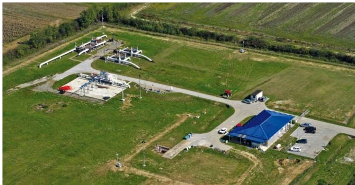
Sl. 6: Terminal Slavonski Brod [4]

Nadalje, naftovod se grana u dva smjera, istočni krak vodi do mjerne stanice Sotin (granica sa Srbijom), prema rafinerijama u Pančevu i Novom Sadu te južni krak vodi do granice s BiH, prema Rafineriji nafte Brod.