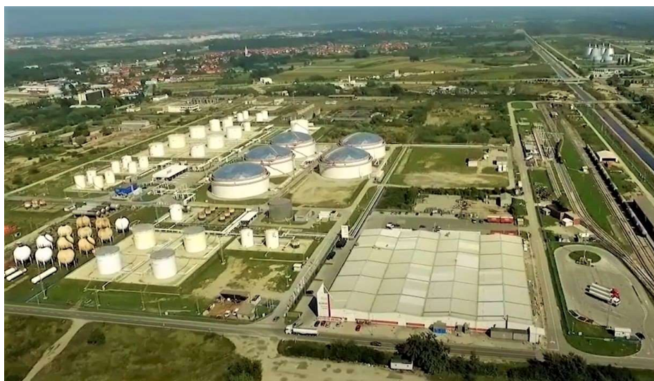
Sl. 4. Terminal Žitnjak [4]

Otprema i doprema naftnih derivata na Terminal mogući su putem autocisterni i vagon cisterni. Ukrcaj i iskrcaj autocisterni odvija se na auto punilištu s četiri ukrcajna otoka s donjim punjenjem cisterni što podrazumijeva bez mogućnosti isparavanja goriva u okoliš, opremljenom uređajem za rekuperaciju para ugljikovodika i mogućnostima dodavanja aditiva i biogoriva.