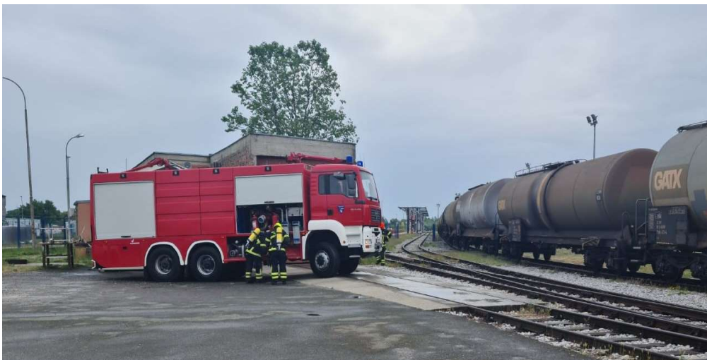
Sl. 10. Navalno vozilo s bacačima voda/pjena i praha za gašenje požara [7]