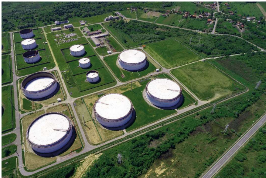
Sl. 3. Terminal Sisak [3]