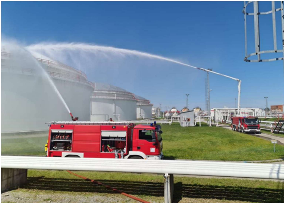
Slika 7: Vatrogasna vježba [7]

Pravne osobe obavezne su analizirati svaki događaj koji je mogao dovesti do požara te poduzimati mjere potrebne da do takvih događaja više ne dođe, o čemu su dužne voditi evidenciju te obavještavati nadležne službe sukladno posebnim propisima. (Članak 57., stavak 1.)