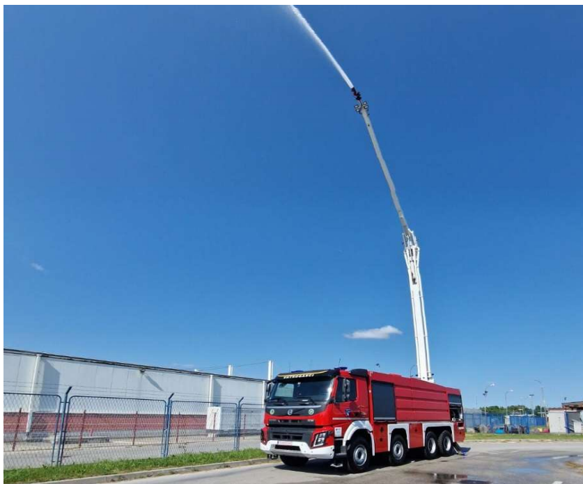
Sl.9. Navalno vozilo s artikuliranom rukom [7]