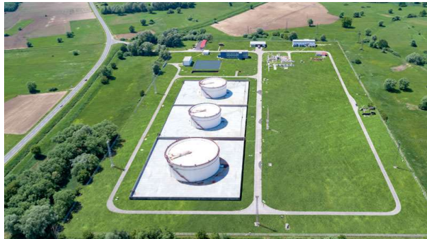
Sl. 5. Terminal Virje [5]

Dionica naftovoda od Terminala Sisak preko Terminala Virje do Szazhalombatte (Mađarska) je reverzibilna, odnosno osigurana je mogućnost transporta nafte u oba smjera, kroz jedan cjevovod naizmjenično.