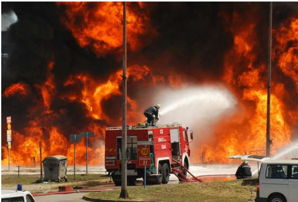
Slika 8: Gašenje požara u Rafineriji nafte Sisak 20.06.2011. [19]

Propisan obvezni sadržaj Izvješća o sigurnosti, način podnošenja zahtjeva za davanje suglasnosti na Izvješće o sigurnosti, obvezni sadržaj i način davanja suglasnosti, način podnošenja zahtjeva za produženje izdane suglasnosti i rokovi s tim u vezi, način i uvjeti za nadzor nad provedbom aktivnosti i mjera prema Izvješću o sigurnosti i obavijesti o prisutnosti opasnih tvari.