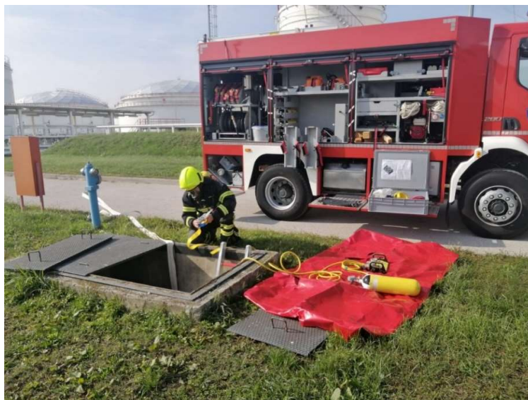
Sl. 11. Malo vatrogasno vozilo opremljeno za tehničke intervencije [7]

Popis količina i vrsta pjenila (u vatrogasnim vozilima, tlačnim dozatorima pjenila, i rezervnih količina na skladištu) prikazan je u tablici 1.