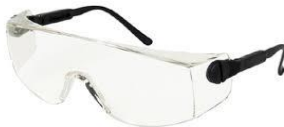
Sl. 4. Zaštitne naočale s jednim okularom [15]