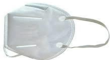
Sl. 10. FFP2 maska [21]

Maske je potrebno uzimati iz originalnog pakiranja, te ih se ne smije nositi u džepu uniforme. Mora pokriti nos i usta, te se obvezno treba primijeniti u slučaju kašljanja i kihanja ili ako je maska mokra. Ne smije se koristiti ponovno nakon skidanja. Ukoliko dođe do incidenta prskanja, tada je usta potrebno isprati velikom količinom vode i to nekoliko puta. Isti postupak je i s prskanjem po licu, u kojem se lice opere vodom te se odmah obavijesti rukovoditelj [22].