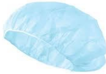
Sl. 7. Jednokratna zaštitna kapa [18]