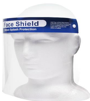
Sl. 6. Zaštitni vizir namijenjen za primjenu u zdravstvu [17].

Štitnici za oči i za lice se koriste u svrhu zaštite lica i očiju od prskajućih tekućina i letećih čestica, a svoju su posebnu namjenu i uporabu ostvarili za vrijeme pandemije bolesti COVID 19 (slika 6). Nazivaju se još i vizirom [16].