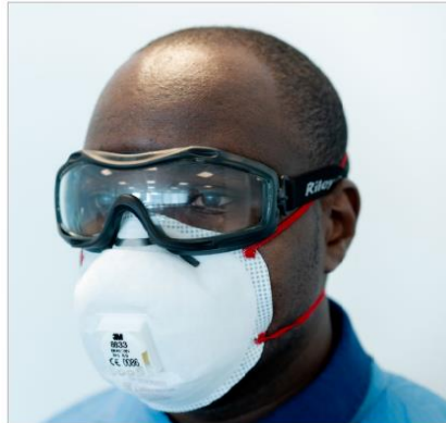
Sl. 5. Zatvorene zaštitne naočale [16]

Također, postoje i zatvorene zaštitne naočale koje gotovo potpuno štite očne duplje. Veći tipovi ovih naočala mogu se nositi preko korekcijskih naočala (slika 5) [15].