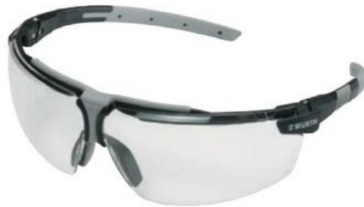
Sl.3. Zaštitne naočale s dva okulara [15]

Otvorene zaštitne naočale najčešće imaju dvostruki okular (dva „stakla“) s vidnim poljem podijeljenim na dva dijela učvršćena u uobičajeni tip okvira za naočale, koji se na glavi održava pomoću bočnih držača (nožica) kao što je prikazano na slici . Često zaštitne naočale često imaju bočne štitnike koji služe za bolju zaštitu očne šupljine od prskanja tekućina ili mehaničkih opasnosti. Također, postoje i naočale s jednostrukim okularom („panoramsko staklo“) što prikazuje slika 4 [15].