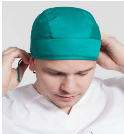
Sl. 8. Višekratna pamučna kapa [19]