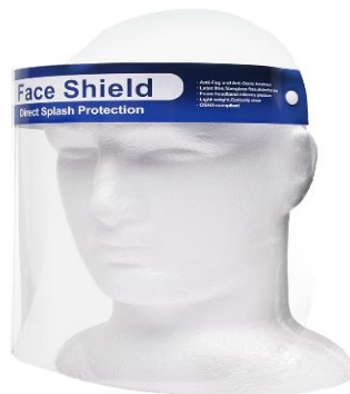
Sl. 6. Zaštitni vizir namijenjen za primjenu u zdravstvu [17].

Štitnici za oči i za lice se koriste u svrhu zaštite lica i očiju od prskajućih tekućina i letećih čestica, a svoju su posebnu namjenu i uporabu ostvarili za vrijeme pandemije bolesti COVID 19 (slika 6). Nazivaju se još i vizirom [16].