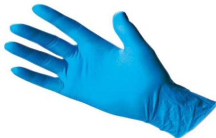
Sl. 11. Jednokratne polivinil rukavice [23]

Određenu vrstu zaštitnih rukavica treba upotrijebiti ovisno o vrsti planiranog posla. Neke od uputa za korištenje rukavica su njihova primjena ukoliko postoji mogućnost dodira s izlučevinama, ekskretima, sekretima, sluznicom, oštećenom kožom i krvlju bolesnika. Ruke je potrebno oprati i obrisati prije navlačenja rukavica te ih mijenjati nakon svake radnje i kontakta sa svakim bolesnikom. Rukavice treba promijeniti prije doticaja čistih dijelova tijela bolesnika nakon previjanja rane ili doticaja s nečistim mjestima. Važno je napomenuti kako dugo i nepotrebno nošenje rukavica povećava rizik od infekcije. Rukavice se uzimaju iz originalnih kutija te se ne nose u džepovima. Ukoliko postoji rizik od dodira s većim količinama tjelesnih tekućina, tada je potrebno upotrijebiti dva para rukavica kako bi se osigurala dodatna zaštita. Isto tako, dva se para rukavica koriste i prilikom postupaka pri kojima postoji opasnost od njihova oštećivanja. Rukavice se odmah skidaju nakon završenog rada, te se odlažu u označene spremnike za otpad, a ruke se peru obvezno. Važno je naglasiti kako rukavice nikako nisu zamjena za pranje ruku. Jedan od nedostataka jednokratnih rukavica je njihova niska mehanička otpornost kao i brzo pucanje po rubovima. Stoga se ne bi smjele upotrebljavati prilikom rada s otrovnim, infektivnim, nadražujućim i drugim sličnim tvarima [6].