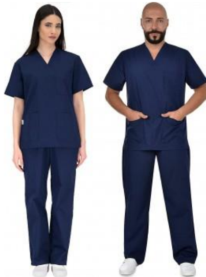
Sl. 12. Dnevna medicinska odjeća [24]

Uniforma je osobno zaštitno sredstvo koje služi za zaštitu tijela. Upotrebljavaju se različite vrste sredstava za zaštitu tijela kao što su haljine, hlače i ogrtači. Načinjena su od pamučnog materijala što ih čini ugodnim za nošenje jer omogućavaju slobodno kretanje i odavanje tjelesne temperature kao što je prikazano na slici 12. Uniforma ne smije sputavati djelatnika u radu prilikom izvođenja zahvata ili ga dovoditi u neugodnu situaciju (tjesna i kratka uniforma). Odabrana uniforma mora biti odgovarajuće dužine i veličine, može biti u raznim bojama koje omogućavaju prepoznavanje zdravstvenih djelatnika prema raspodjeli poslova i stupnju obrazovanja, time se postiže lakša komunikacija između bolesnika i osoblja. Pri postupcima u kojima se očekuje prskanje krvi, sekreta, ekskreta, tjelesnih tekućina, primjerice kirurška odijela u operacijskim salama (slika 13). Također, prilikom provođenja zdravstvene njege bolesnika, zdravstveni djelatnici bi trebali nositi dodatnu zaštitnu odjeću. Isto tako, zdravstveni djelatnici bi trebali imati mogućnost da tijekom rada prema potrebi zamijene uprljanu odjeću čistom. Za zaštitu tijela se koriste još i mekane potkošulje načinjene od pamuka kako bi se zaštitilo tijelo od štetnih klimatskih uvjeta i kako bi zaštitile mikroklimu tijela [6].