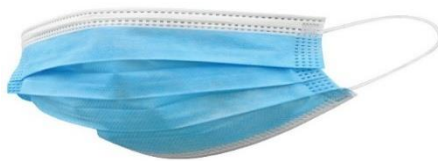
Sl. 9. Jednokratna kirurška maska [20]