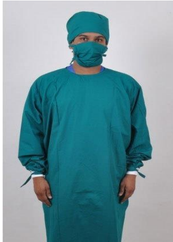
Sl. 13. Kirurška odjeća [25]