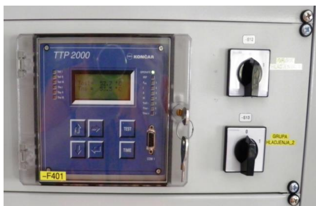
Slika 3. Termo slika na TS 110/10/10 kV Dubovac [4]

Energetski transformatori na TS 110/10/10 kV Dubovac zaštićeni su nadstrujnom zaštitom u tri stupnja, na primarnoj i sekundarnoj strani, autonomnom nadstrujnom zaštitom, diferencijalnom zaštitom te Termo slikom (slika 3), Buchholz relejom (slika 4) te stabilnim sustavom za gašenje požara CO 2 . S aspekta protupožarne i protueksplozijske zaštite najvažniji su Termo slika i Buchholz relej. Termo slika prati iznos temperature u normalnom pogonskom stanju, dok druga reagira na brzo podizanje ulja u kotlu transformatora uslijed kvara i predstavlja zadnju liniju obrane od požara i eksplozija [9].