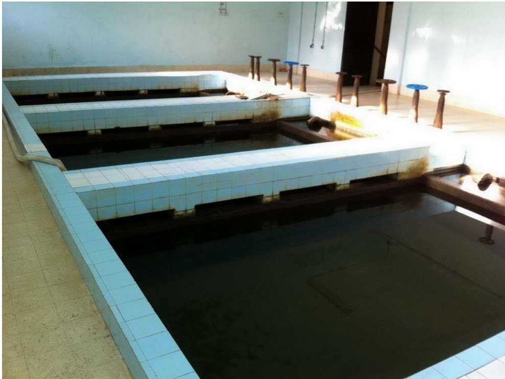
Slika 3: Filtrirna