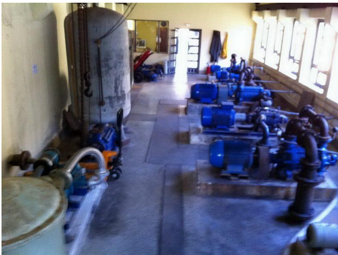
Slika 2: Crpna stanica iznutra