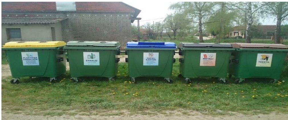
Slika 7 Zeleni otoci