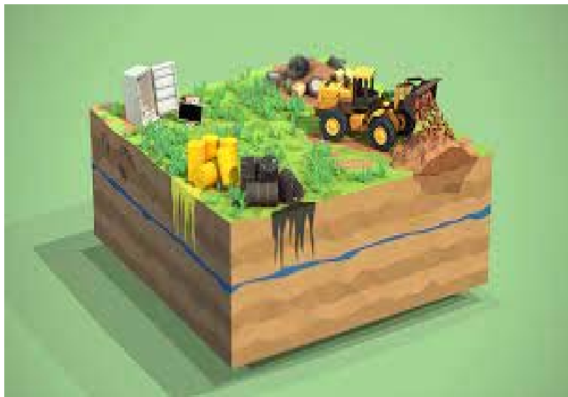
Slika 2 Uzroci onečišćenja tla

odnosno na tlo. Onečišćenje tla dovodi do toga da se smanjuje upotrebljivost zemljišta. Upotrebljivost zemljišta promatramo kao potrebe životinjskog i biljnog svijeta za život a i samim time i čovjeka. Štete mogu nastati izravno prilikom dodira objekta i tla, ili neizravno preko posrednika. Npr. životinje prilikom ispaše u sebe unose travu koja raste na onečišćenom tlu, ona se apsorbira u organizmu i unosi zagađene tvari. Takve tvari akumuliraju se u na primjer mlijeko ili meso životinje te ulaze u organizam čovjeka. Štetne tvari koje se nalaze u tlu, u tijelu čovjeka mogu izazvati alergijske reakcije koje mogu biti jeke ili slabije s obzirom na to koliko je tlo zagađeno. Jedan od najvećih i najznačajnijih utjecaja na tlo je intenzivno nestajanje šuma. Nestajanje šume povezujemo s nekontroliranom sječom, pojavom čestih požara i pojavom kiselih kiša, što za posljedicu ima eroziju tla, promijenjenu klimu i ne regulirani vodeni balans. Istraživanja govore da je čak jedna trećina tla oštećena toliko da se ne može popraviti (UDOVIČIĆ, 2009).