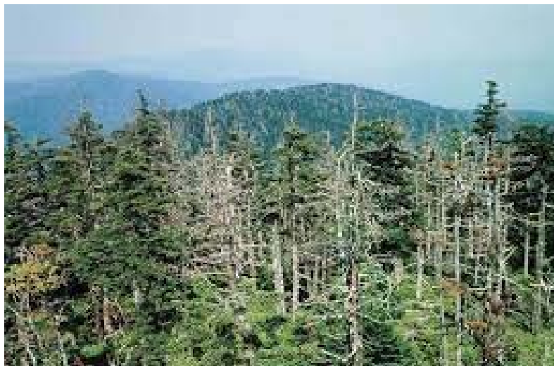
Slika 5 Utjecaj kiselih kiša na šumu

Kisele kiše - su posljedica gore navedenih onečišćenja. Prilikom izgaranja goriva spojevi koji se oslobađaju u obliku plinova dižu se u atmosferu te se zatim otapaju u kapljicama vode. Sumporov dioksid i dušikov dioksid u obliku kiše padaju na tlo te izazivaju velike probleme zbog toga što je kisela kiša koja nastaje otprilike 40 puta kiselija od obične kiše. Sumporni dioksid u spoju s vodom pretvara se u sumpornu kiselinu koja ima izuzetno negativan utjecaj na zelene biljke zbog toga što se prekida fotosinteza. Samim tim oštećuje se lišće drveća, a nakon nekog vremena drvo, korijenje i šuma. Prilikom oborina u vidu kiselih kiša dolazi i do onečišćenja voda i mora. Ukoliko se pH vrijednost smanji mijenja se cijeli ekosistem voda, izumirati će organizmi i ribe koje su izuzetno osjetljive na promjene pH vrijednosti, te će problem pitke vode biti na najvećoj razini. Kisele kiše predstavljaju najveći problem kod zagađenja voda jer postoji krug kruženja vode koja na kraju ulazi u sve dijelove zemlje (ANONYMOUS, 2017b).