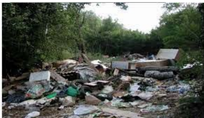
Slika 9 Dogovoreno odlagalište