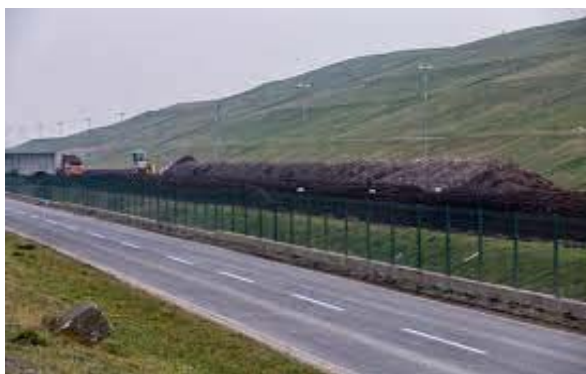
Slika 8 Odlagalište otpada Jakuševac