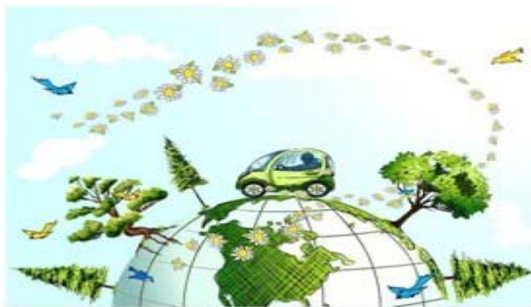
Slika 1 Ekologija

Sami početak govora o ekologiji povezuje se sa knjigom znanstvenika Charlesa Darwina (1809.-1882) koju objavljuje u Londonu 1859. godine pod nazivom „Porijeklo vrsta“. U svom djelu obuhvatio je sve uzajamne, stalne i promjenjive odnose živih organizama sa ostalom živom i neživom prirodom. Objasnio je također i mnoge evolucijske primjere poput adaptacije, prirodne selekcije, borbe za opstanak, izumiranje vrsta i dr. Godine 1866. Ernst Haeckel (1834.-1919.) (Generelle Morfologie der Organismen) prvi je upotrijebio termin ekologija, te ga objasnio kao znanost koja se bavi istraživanjima interakcija između organizama i okoliša. U knjizi „Generelle Morfologie der Organismen“ („Opća morfologija organizama“) objavljenoj u Berlinu 1866. Haeckel prvi definira pojam ekologije i opisuje ekologiju kao zasebnu znanost. Danas ekologiju podrazumijevamo kao sveukupnu znanost o odnosima određenih organizama prema okolini uz sve egzistencijalne preduvjete. Preduvjeti egzistencije mogu biti anorganskog (klima, svjetlost, toplina, vlažnost...) i organskog podrijetla (svi odnosi organizama prema drugim organizmima s kojima su u odnosu), iznimno su važni za opstanak odnosno egzistenciju jer organizme prisiljavaju na prilagođavanje njima (SRPAK, 2017).