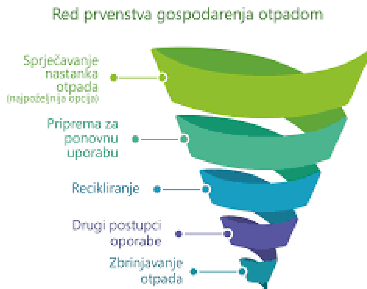
Slika 6 Red prvenstva gospodarenja otpadom

Ovakvom hijerarhijom odnosno redom prvenstva u gospodarenju otpadom određuje se koji načini gospodarenja otpadom su najpoželjniji (PRELEC, 2012).