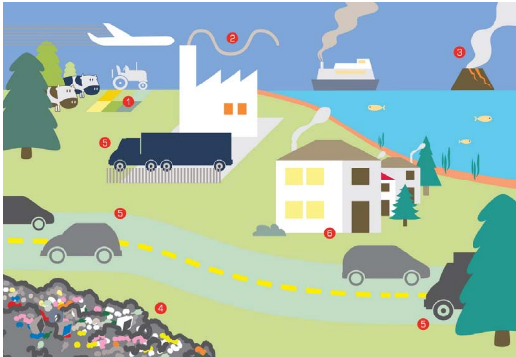
Slika 4 Izvori onečišćenja zraka

onečišćenje prilikom spaljivanja različitih vrsta otpada. Gospodarstvo i industrija u današnjem svijetu bazira se na korištenju fosilnih goriva, plin, nafta i ugljen. Prilikom izgaranja u zrak se ispušta veliki broj čestica koje predstavljaju najveći izvor onečišćenja zraka. Industrijski pogoni prilikom rada svojih postrojenja ispuštaju dim, prašinu i određene mirise. Promet predstavlja još jedan od zagađivača zraka jer se broj vozila konstantno povećava povećanjem broja stanovnika. Plinove koje ispuštaju vozila broje više od 200 različitih kemijskih spojeva (ČRNJAR I ČRNJAR, 2009).