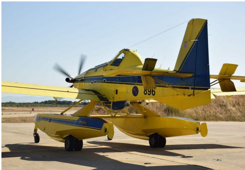
Slika 12. Air Tractor [16]

je i to što se „može zavući bilo kamo“, odnosno vodu može skupljati na dosta pozicija na moru, na jezerima, ali i na rijekama jer ima plovke za razliku od prijašnjih inačica. Air Tractor Fire Boss ima spremnik od 300 litara za pjenu, koje kad se pomiješa s vodom u omjeru od jedan posto, znatno povećava učinkovitost gašenja požara. Učinkovit je i kad se radi sa sporim retardantima koji se, pomiješani s vodom, bacaju ispred požara te tako sprječavaju gorenje. Ta se metoda u svijetu dosta primjenjuje, a kod nas intenzivnije od 2005. godine. [15]