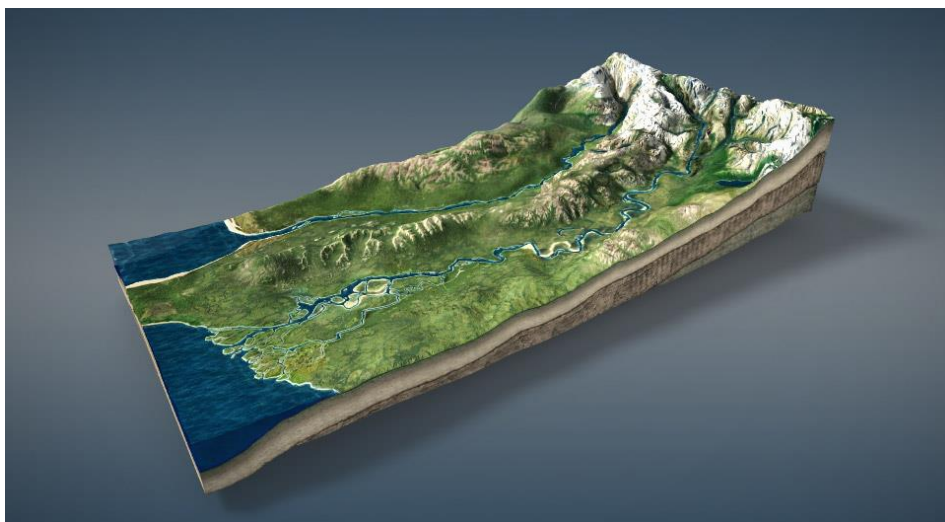
Slika 6. Primjer reljefa [9]

Reljef (prikazano slikom 6.) je površina zemljine kore s prirodno nastalim ravnim i neravnim krutim oblicima tla. Reljefni oblici su ravnice, brežuljci, brda, gore, predplanine i planine, vrhovi, padine, itd. O reljefu ovise gotovo sve pojave na površini Zemlje: osunčanje, naoblaka, tlak, temperatura i vlaga zraka, vrsta i raspored padalina itd. U ukupnom djelovanju reljefa na ponašanje požara utječe, osim geografskog smještaja, i njegova veličina, pravac pružanja i razvedenost te pojedinačni reljefni čimbenici, odnosno parametri: nadmorska visina, nagib, izloženost prema sunčanim zrakama ili vjetrovima, oblici terena. [1]