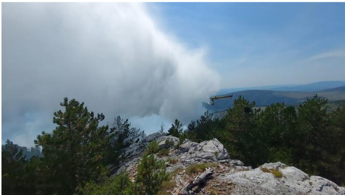
Slika 14. Požar otvoreno prostora - Split 14.03.2022. [28]

Dana 13. ožujka u 14:15 sati ŽVOC Split zaprimio je dojavu o požaru na otvorenom prostoru na području Imotskog, Podbablje. Požarom je bila zahvaćena trava, nisko raslinje i hrastove šume na površini od 6 ha. Na intervenciji gašenja požara sudjelovalo je četiri vatrogasaca s dva vatrogasna vozila iz JVP Imotski. Požar je ugašen u 17:00 sati.