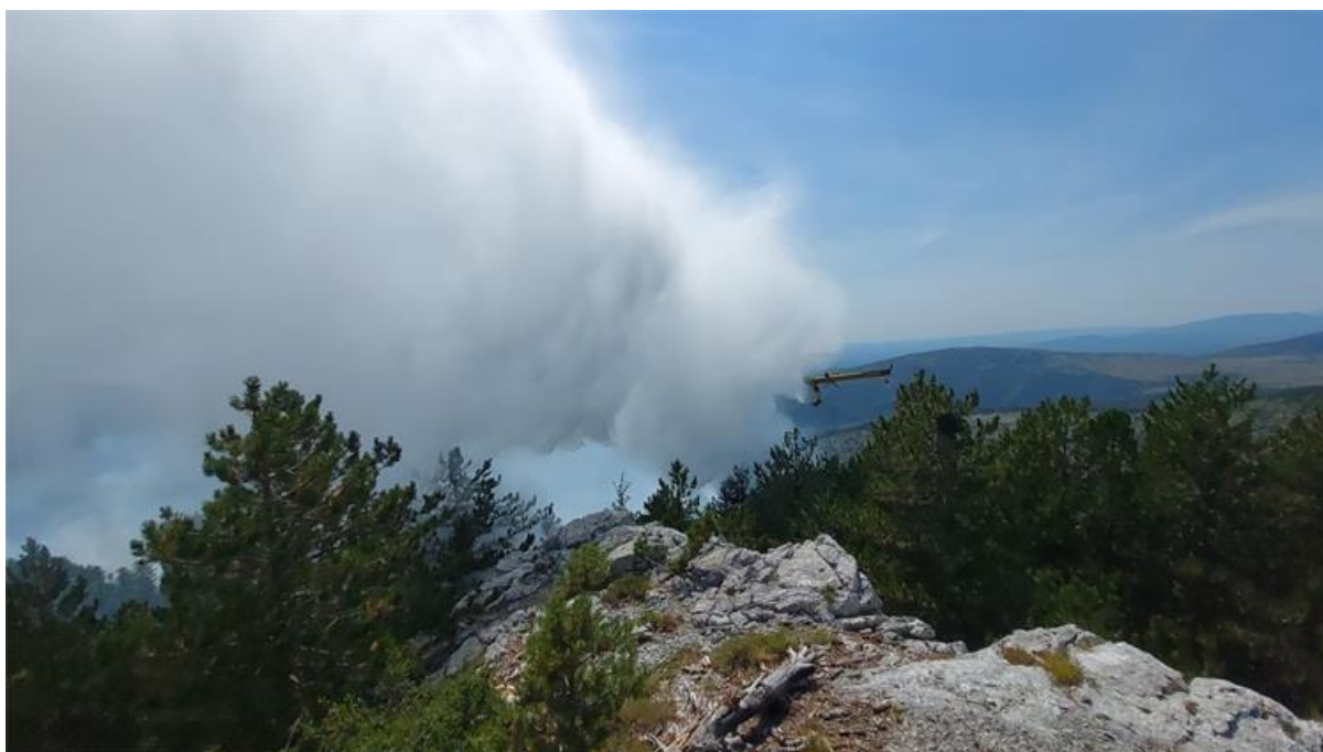
Slika 14. Požar otvoreno prostora - Split 14.03.2022. [28]

Dana 13. ožujka u 14:15 sati ŽVOC Split zaprimio je dojavu o požaru na otvorenom prostoru na području Imotskog, Podbablje. Požarom je bila zahvaćena trava, nisko raslinje i hrastove šume na površini od 6 ha. Na intervenciji gašenja požara sudjelovalo je četiri vatrogasaca s dva vatrogasna vozila iz JVP Imotski. Požar je ugašen u 17:00 sati.