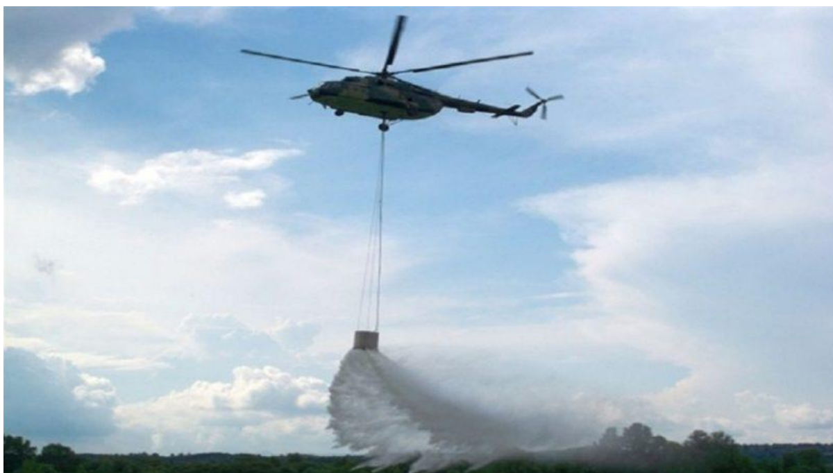
Slika 13. Helikopter [17]