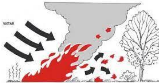
Slika 8. Frontalni zahvat požara [11]

vatre. Rub požara gasi se pomoću dviju grupa, počevši od sredine fronte s postupnim kretanjem prema bokovima i pozadini požara. To je najopasniji sektor požara, a njegovo kretanje brzo povećava opseg radova pri gašenju požara. [8]