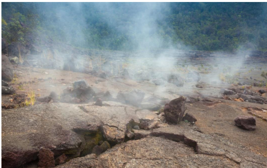
Slika 2. Podzemni požar [3]

Podzemni požar (prikazano Slikom 2.) nastaje kada se zapali listinac u tlu ili podzemne naslage treseta. Takva vatra polako napreduje i tinja. Zbog takvih uvjeta podzemni požari se teže otkrivaju pa njihovo širenje može obuhvatiti veće površine i učiniti velike materijalne štete prije nego što se otkriju. Kada se podzemni požar otkrije potrebno je spriječiti njegovo širenje kopanjem jarka ispod razine na kojoj se nalazi vatra i gorivi materijal. Požari na krševitom terenu duže gore i veća je opasnost da ugroze šume. U takvim slučajevima ta mjesta zalijevamo vodom. [1]