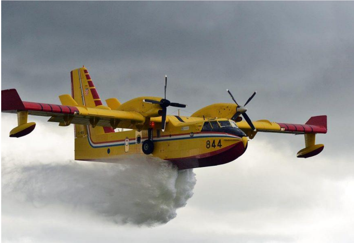
Slika 11. Canadair [14]

Canadaira koji se servisiraju i održavaju u Zrakoplovnim bazama Zadar i Divulje koje su u sklopu postrojbi Hrvatskog ratnog zrakoplovstva.