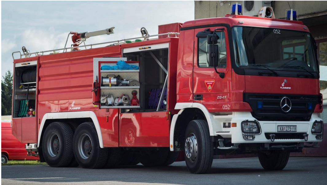
Slika 9. Vatrogasna cisterna [12]