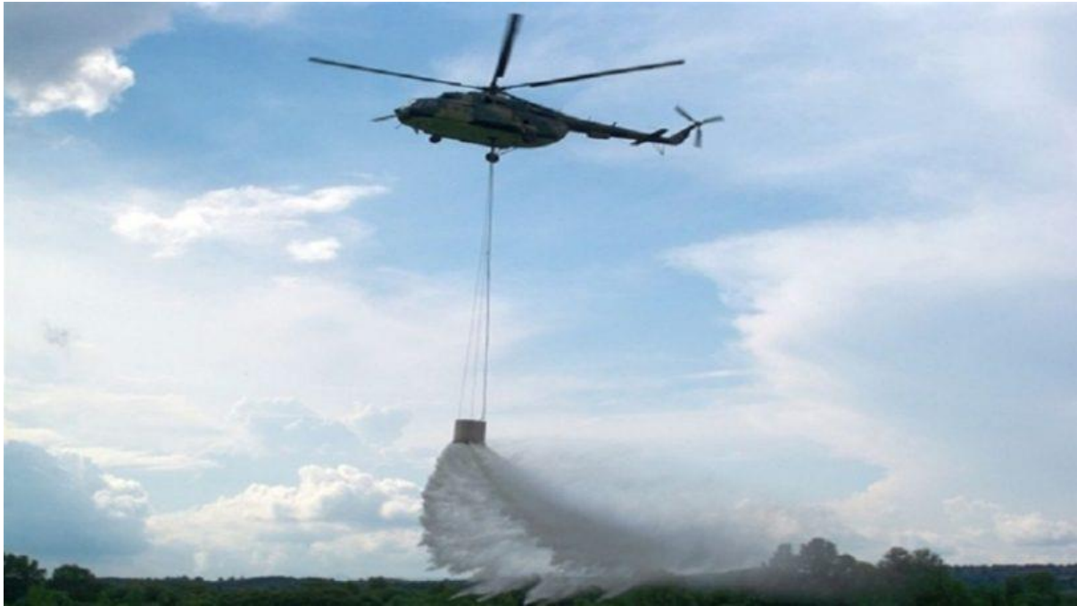
Slika 13. Helikopter [17]