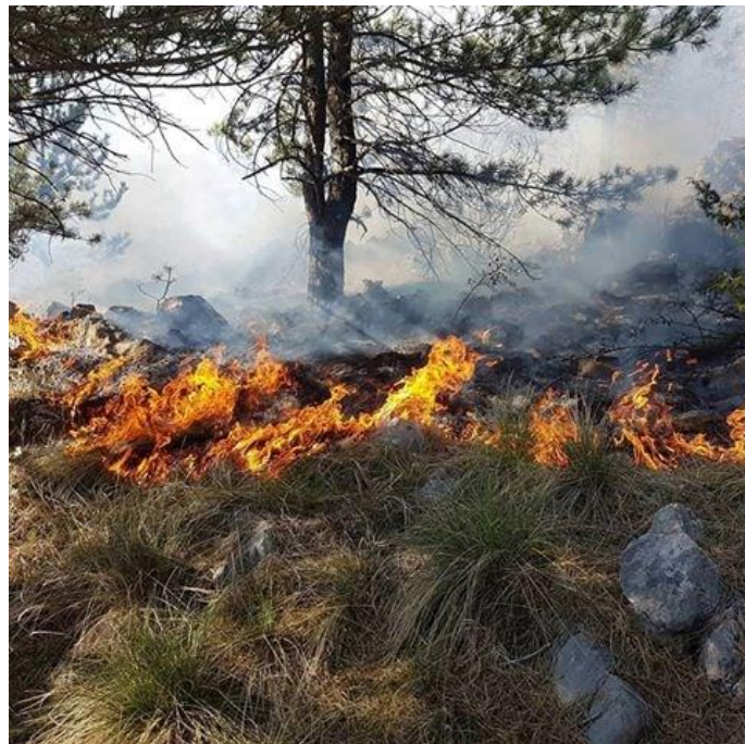
Slika 3. Prizemni požar [5]

Prizemni požar (prikazano Slikom 3.) je najčešći oblik šumskih požara. Nastaje kada se zapali: pokrov tla, humus, lišće, iglice, mahovina, suha trava, suho drvo, panjevi. Prizemni požar se može razviti naglo, a uz utjecaj vjetra i povoljan omjer gorive tvari, vlažnost i površinu na koju djeluje toplina. Kod naglog širenja, fronta požara kreće vrlo brzo i pri tome gori uglavnom sitniji gorivi materijal i eventualno pomladak. Kod razvijanja određene količine topline pale se i krupniji komadi prostirke, panjevi i nepotpuno razgrađen humus. Pod određenim uvjetima, prizemni požar može se prenijeti u krošnje stabala. [1]