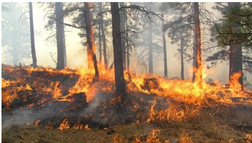
Slika 1. Šumski požar [2]

Požari otvorenog prostora ili šumski požari (prikazano Slikom 1.) su nekontrolirano, stihijsko kretanja vatre po šumskoj površini. Pripada u prirodne katastrofe. Razlikuje se po vrsti, načinu nastanka i štetama. Za nastanak požara potrebna je određena temperatura, tlak i kisik, ako se jedno od toga ukloni, požar prestaje. Prilikom šumskih požara isprepliću se različita termodinamička i aerodinamička događanja. Na njih značajno utječe konfiguracija terena kojim se požar kreće, karakteristike vegetacije koja gori te lokalni meteorološki uvjeti na mjestu požarišta. [1]