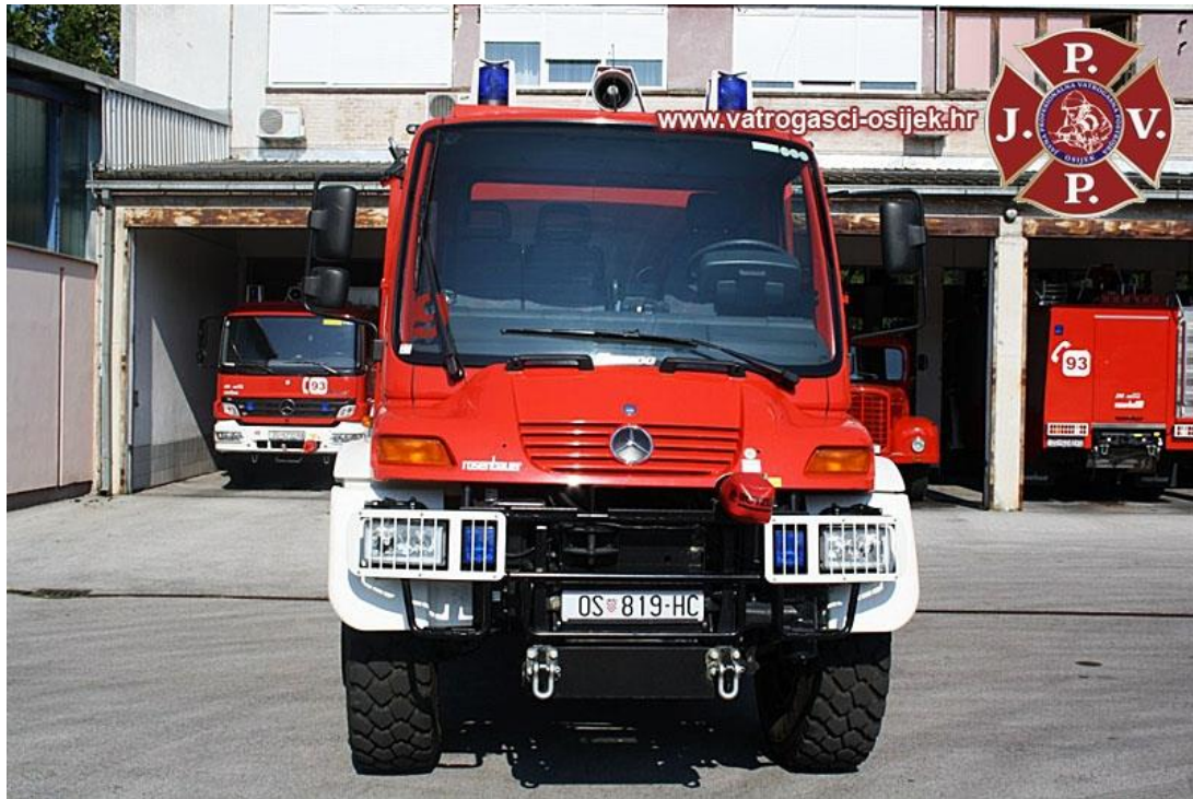
Slika 10. Vatrogasno šumsko vozilo [13]