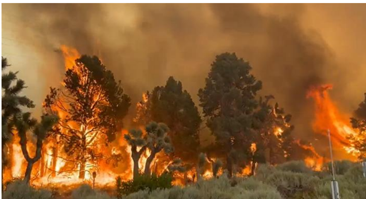
Slika 5. Vjetar kao faktor širenja požara

Vjetar je čimbenik (prikazano slikom 5.) koji najviše utječe na „ponašanje“ šumskog požara, a posebno na brzinu njegovog širenja. Statistike požara pokazuju da su se veliki požari zbili za vrijeme jakog vjetra, posebice bure. Vjetar je iznimno opasan čimbenik za širenje požara iz razloga što vjetar gura plamen prema naprijed omogućujući direktni kontakt plamena i novog još ne izgorjelog raslinja, a isto tako povećava zračenje sa izvora na prijarnike topline. Dobro poznavanje prilika vjetra pojedinog područja, modifikacije zračne struje izazvane reljefnim preprekama, kanaliziranje struje ili poznavanje ponašanja zračne struje u biljnim sastojinama preduvjet je donošenja ispravnih odluka prije i za vrijeme šumskog požara. Brzina vjetra mjeri se anemometrom (m/s, km/h), a smjer prizemnog vjetra određuje se pomoću vjetrulje. Brzina vjetra može se odrediti i na osnovu njegovog vizualnog efekta bez uporabe instrumenata. Tada je izražena u beaufortima. [1]