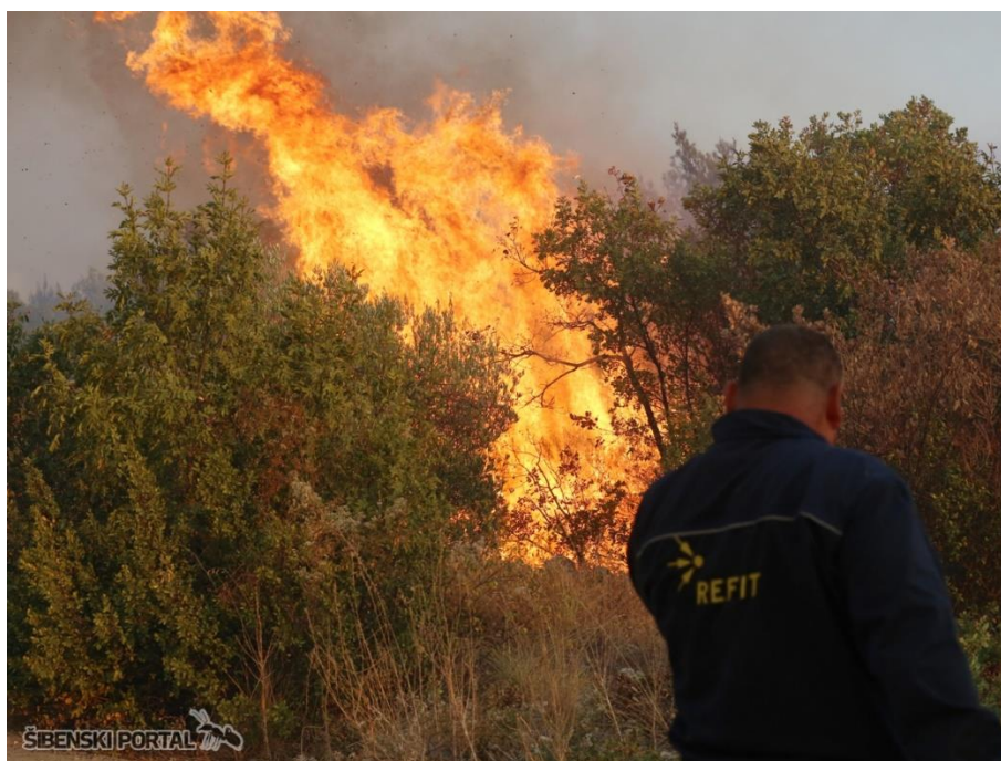
Slika 4. Ovršni požar [6]

Ovršni požar (prikazano Slikom 4.) razvija se iz prizemnog požara. Ovršni požari su požari u kojima gori krošnja drveća. Da bi se mogao širiti, potreban je prizemni požar te snažan vjetar. Pojavi ovršnih požara doprinose i strmine.. Vrtlozi vjetra mogu ga prenijeti i više desetaka metara dalje, ostavljajući ponekad iza sebe i veće neizgorjele površine. Ovršnim požarima najčešće podliježu guste mlade šume četinara na suhim i uzvišenim terenima, te žbunasti oblici hrasta. Požari u krošnjama stabala, mogu se učinkovito pogasiti jedino uz pomoć zrakoplova ili mlazova vode s većim volumnim protokom.