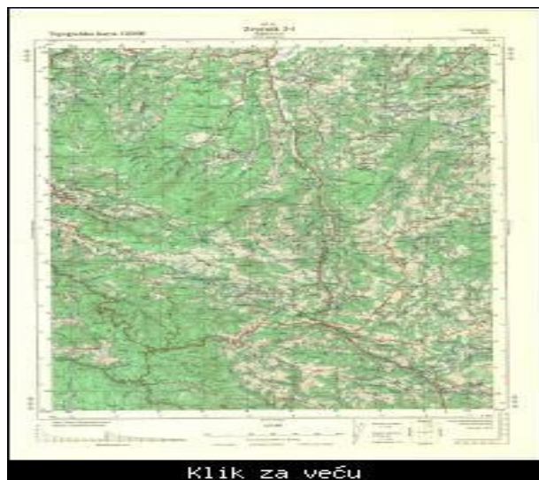
Slika 15. Topografska karta [10]