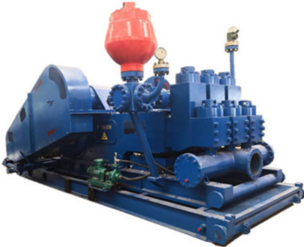
Slika 2. Isplačna pumpa