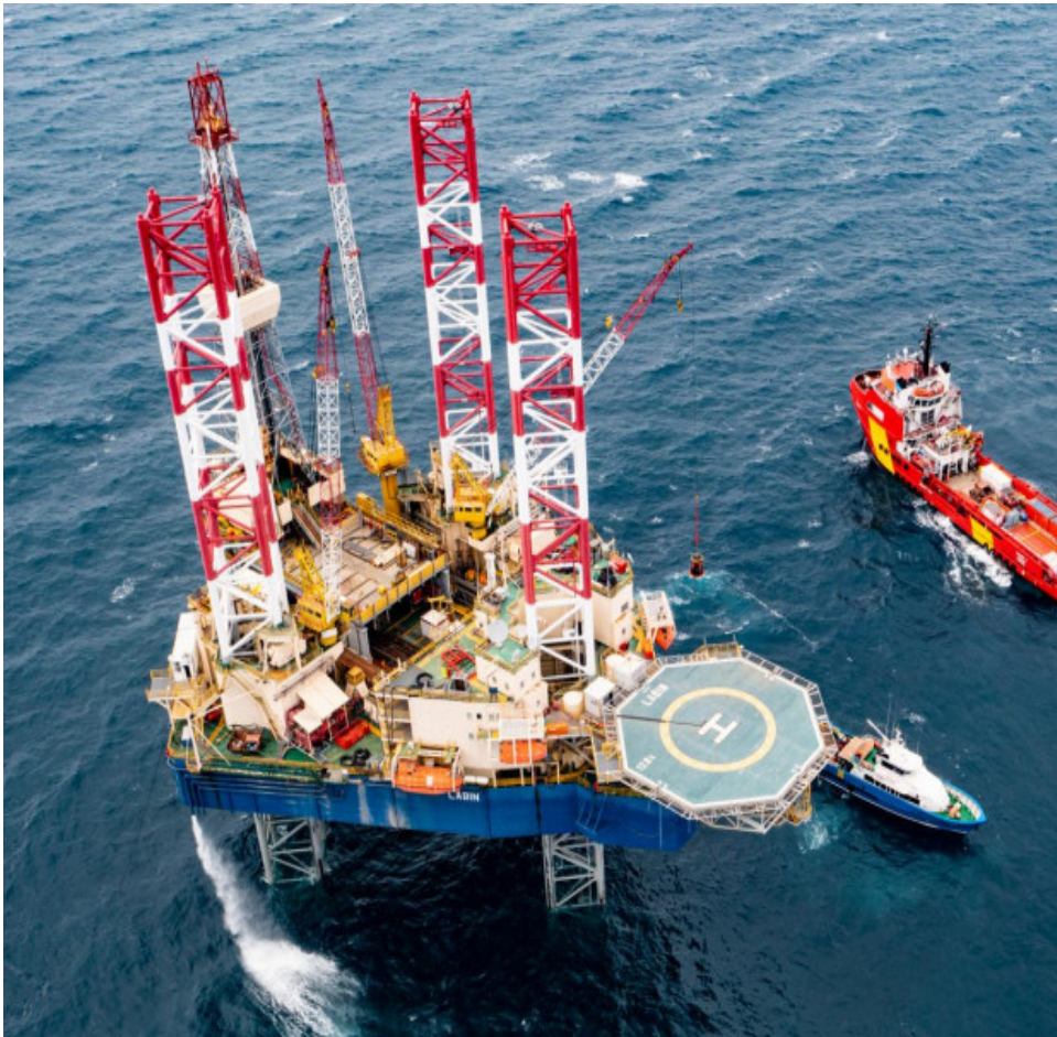
Slika 1: Samopodizna naftna platforma