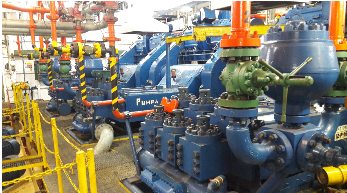
Slika 6. Prostorija isplačnih pumpi

U prostoriji su izmjerene vrijednosti buke : Mjerno mjesto 18 (MM18) = 94,4 dB; MM 19 = 94,3 dB; MM 20 = 94,2 dB; MM 21 = 93 dB; MM 22 = 89,9 dB; MM 23 = 87,6 dB. Prostorija isplačnih pumpi je zvučno izolirana prostorija u kojoj se nalaze tri pumpe. Zbog dimenzija prostorije obavljeno je mjerenje buke na šest mjesta. Na svih šest mjesta razina buke prelazi dozvoljene vrijednosti. Razina buke izvan zvučno izolirane prostorije isplačnih pumpi je zadovoljavajuća. Da bi se kvalitetno mogla procijeniti razina izloženosti djelatnika buci na radnom mjestu, potrebno je napraviti analizu radnih aktivnosti unutar radnog dana. Za radnike koji rade isti posao ili rade u istom prostoru očekuje se da imaju sličnu izloženost buci tijekom radnog dana. Aktivnosti su utvrđene u razgovoru sa djelatnicima i nadređenom osobom.