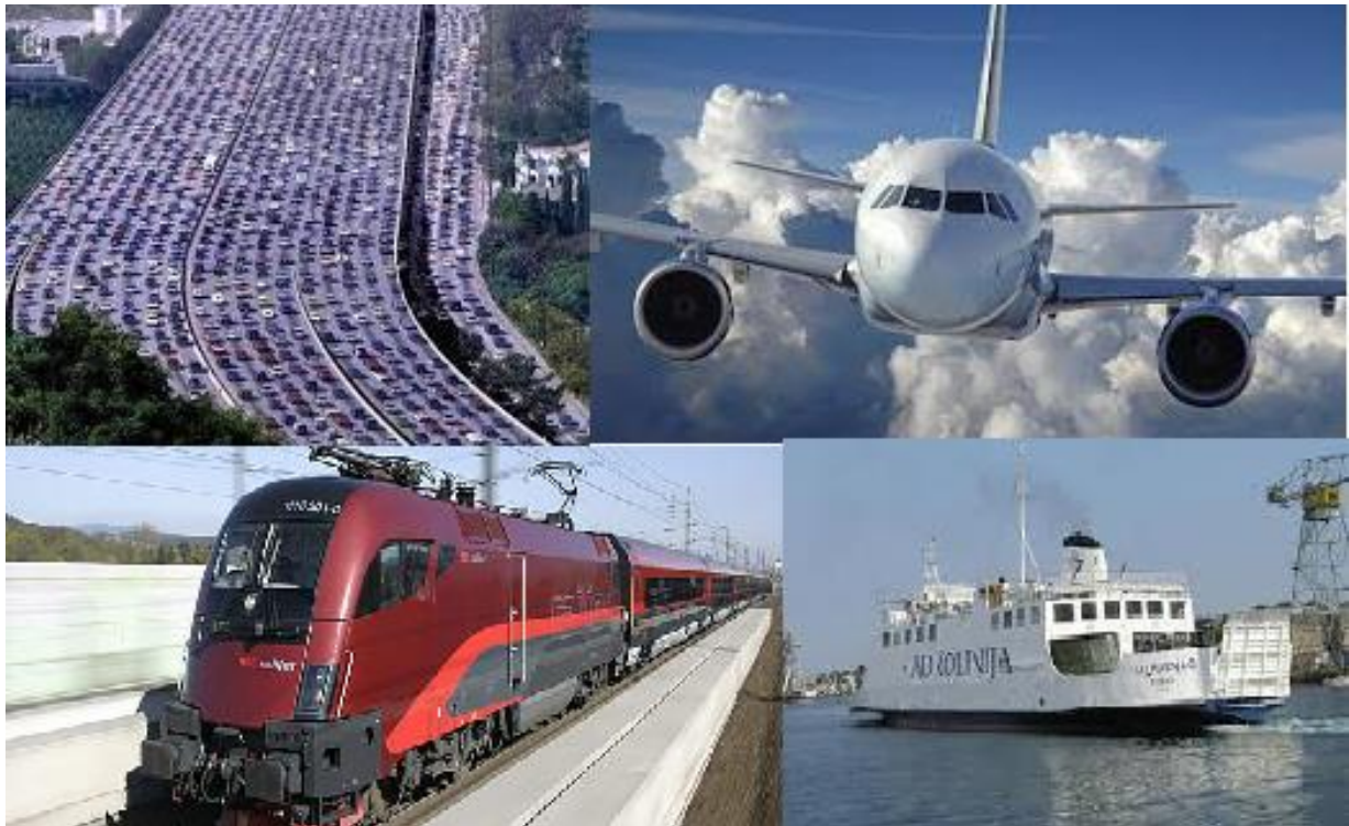
Slika 6: Vrste prometa

Promet je ne samo važan, već i nezaobilazan čimbenik gospodarskog i društvenog razvoja, osobito nakon industrijske revolucije do danas.