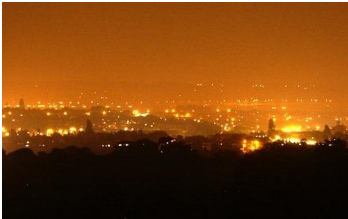
Slika 11. Svjetlosno onečišćenje

Svjetlosno onečišćenje (zagađenje) svako je suvišno rasipanje umjetne svjetlosti izvan područja, koje je potrebno osvijetliti (nepotrebna i prekomjerna rasvjeta), tj. promjena razine prirodne svjetlosti u noćnim uvjetima uzrokovana unošenjem svjetlosti proizvedene ljudskim djelovanjem. Uzrokuje mnoge štetne pojave poput zdravstvenih problema, narušavanja ekosustava te remećenja astronomskih promatranja. Od 80-ih godina 20. Stoljeća razvio se pokret protiv svjetlosnog onečišćenja s ciljem njegova smanjenja. U mnogim državama postoje zakoni koji reguliraju ovu problematiku. Najveće svjetlosno onečišćenje prisutno je u razvijenim industrijskim državama.