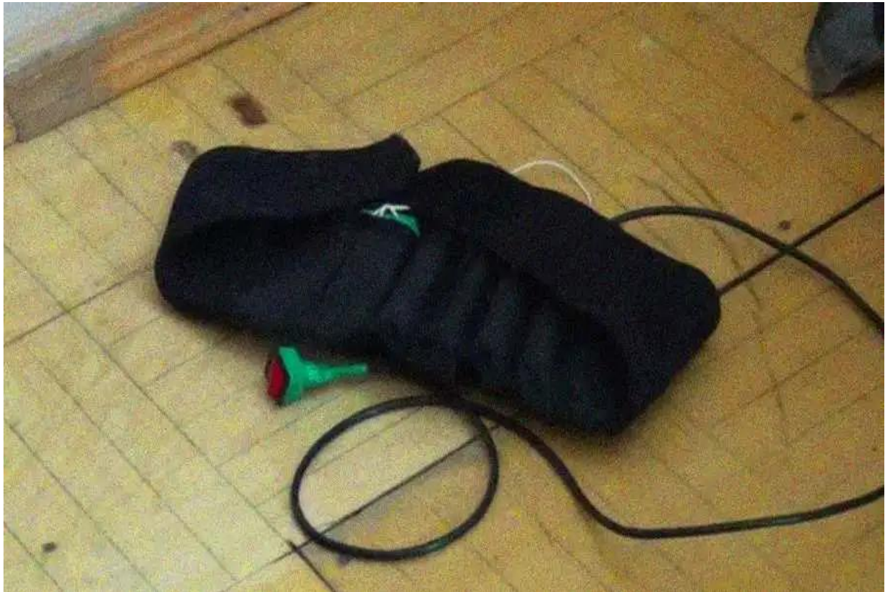
Slika 8. Samoubilački pojas (48)

5. prosinca 2003. dogodio se napad u kojemu je poginulo 47 osoba, a ranjeno je ih više od 186. Eksplozija se dogodila u električnom vlaku „ Kislovodsk-Mineralnye Vody “ (Slika 9). Prema istrazi, počinio ga je bombaš samoubojica. Eksplozija se dogodila u jutarnjim satima ispred stanice Yessentuki u južnoj Rusiji. [38, 46]