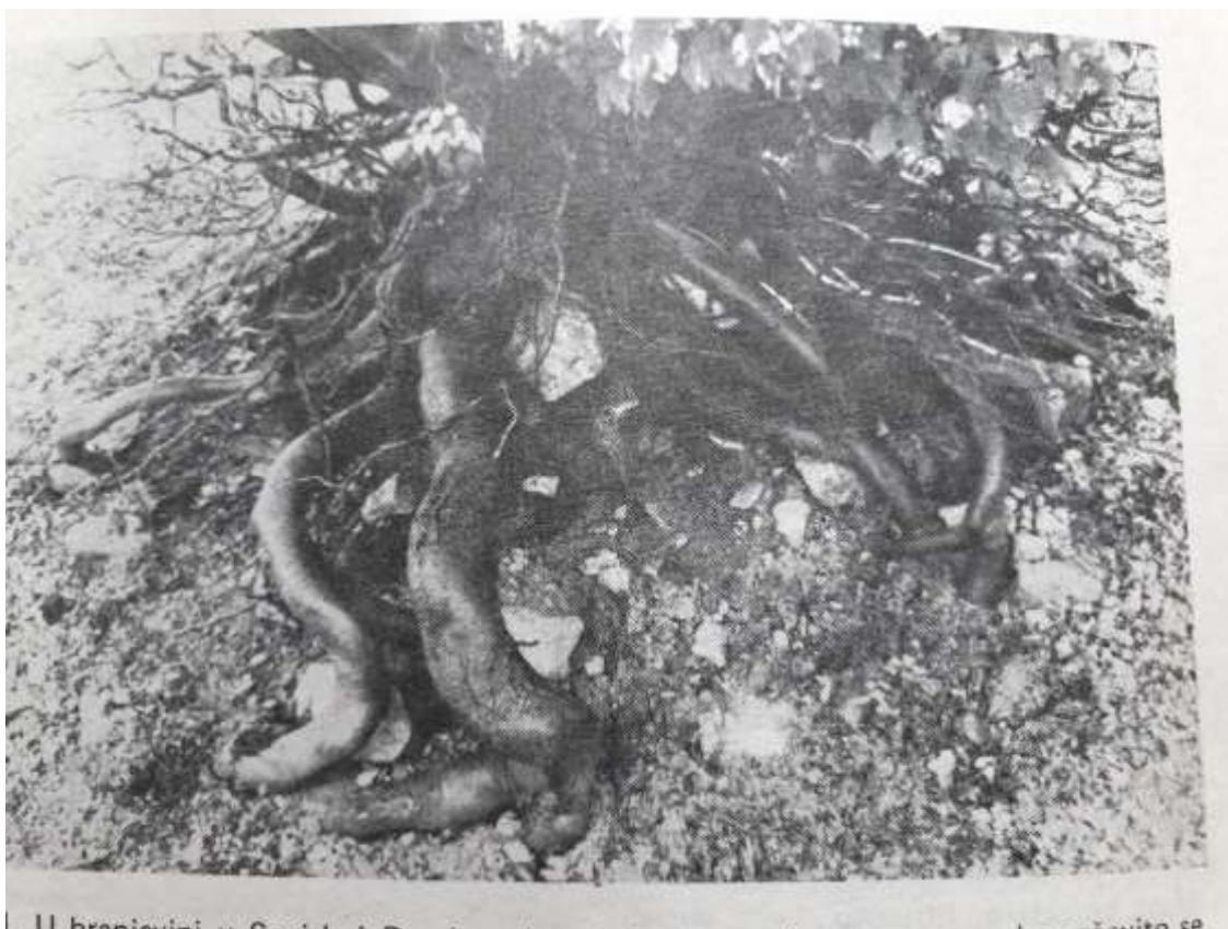
Sl.7. Branjevina u Senjskoj Drazi – korijen crnog graba [Kovačević, 1981;24]

U nastavku je prikazan korijenov sistem crnog graba koji prodire u skeletoidno i skeletno tlo te time sprečava otjecanje vode, eroziju i denudaciju (ogoljivanje stijena):