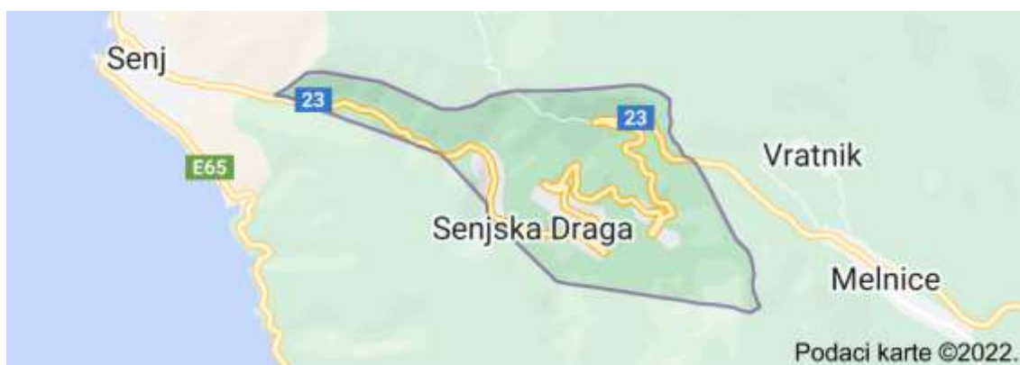
Sl.3. Senjska Draga – karta

Senjska Draga je naselje u sastavu Grada Senja, Ličko-senjska županija, koje prema popisu iz 2011. godine broji 85 stanovnika (Wikipedia, https://hr.wikipedia.org/wiki/Senjska_Draga ). Smještena je na površini od 2.515 ha, od čega je 1.540 ha obraslo, između planina Velike Kapele i Velebita te ju prohodnom čini Jozefinska cesta (Pentek, Pičman, 2003; 68).