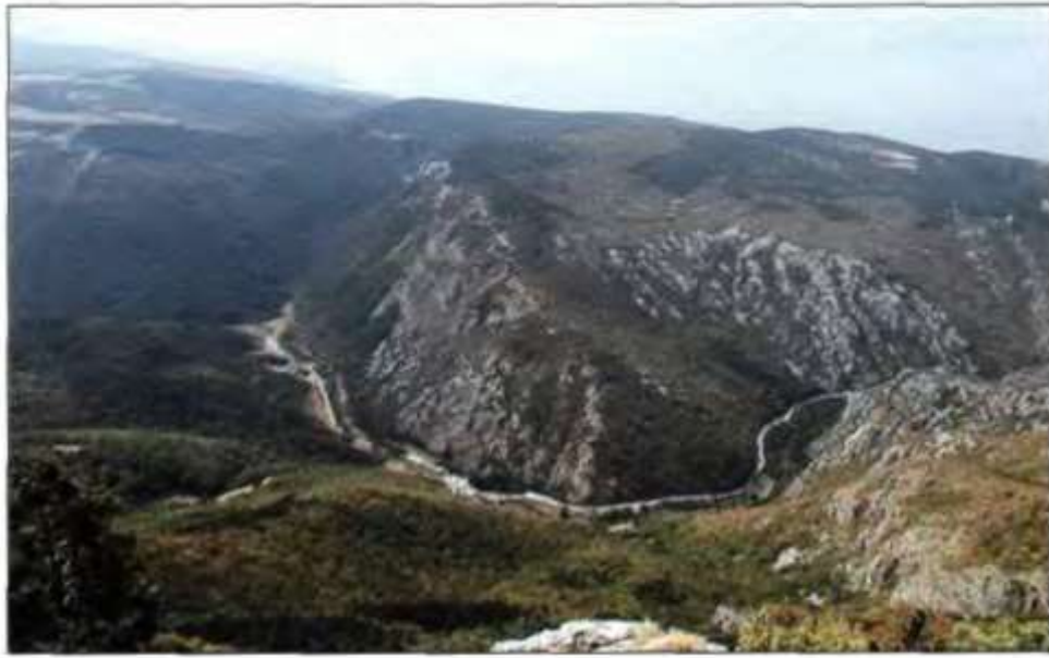
Sl.4. Senjska draga danas, najsačuvaniji ostaci šuma autohtonog crnoga bora u području Rončevića doča [Topić, 2003; 54].

Osim prevladavajućeg crnog bora U Senjskoj Dragi je prisutan i hrast medunac i crni grab te bukovo-jelove i pretplaninske bukove šume, uz kojih dolazi jesenska šašika, osobito u vratničkom dijelu Senjske Drage. (Grupa autora, 2005; 112).