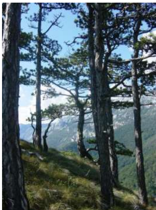
Sl.1. Primjeri zaštitnih šuma – sastojina bukve na Dinari (gore), sastojina crnog bora na Velebitu (dolje) [Šumskogospodarska osnova 2016-2025; 704,705]