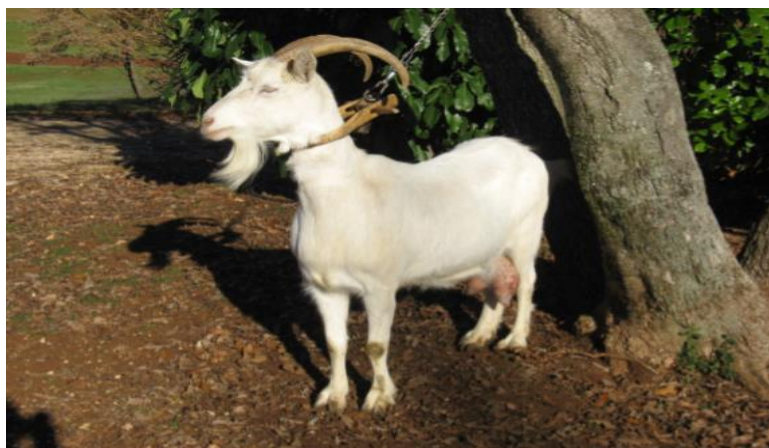
Slika 3: Istarska koza (autohtona hrvatska pasmina)