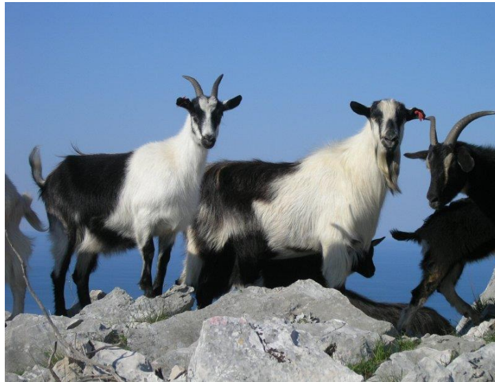
Slika 1: Hrvatska šarena koza

kozjeg vlakna. U jarca su rogovi dužine oko 29 centimetara i uglavnom rastu unazad (Jotić, 2021). Vime kod koza je pigmentirano ili je pjegavo te obraslo dugom dlakom. Kod dobivanja potomstva najčešće se radi o samo jednom jaretu. U današnje vrijeme najviše se uzgaja na područjima Dalmatinske zagore, Biokova, podno Velebita i Dinare, te Kamešnice i Biokova.