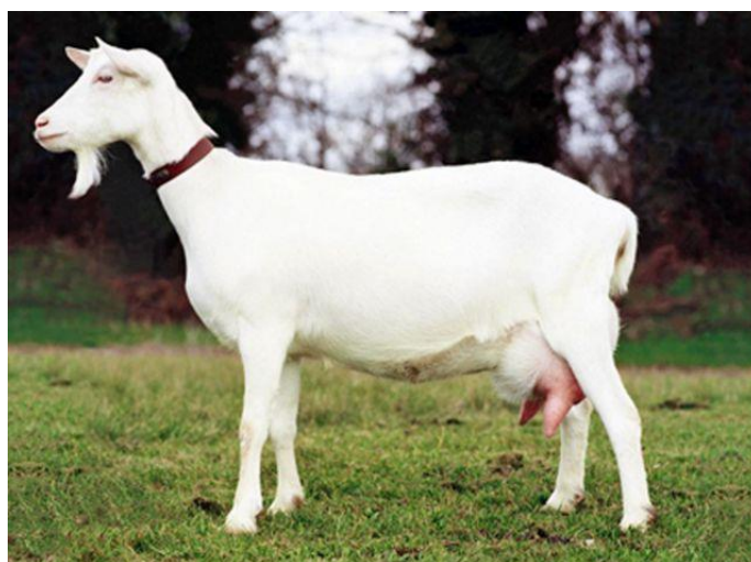
Slika 4: Sanska vrsta koze

Sanska koza se smatra najboljom mliječnom kozom koja je stvorena u Švicarskoj, pored rijeke Sane prema kojoj je i dobila ime. Ima mršavu glavu i blijedog je izgleda, vrlo gustu i svilenkastu dlaku. Vrlo dobro razvijeno tijelo. Masa jarčeva seže i do 75 kilograma, dok koza seže do 50 kilograma. Mogu dati i više od 700 litara mlijeka godišnje, proces laktacije traje 280 dana (Gavranović, 2017). Masnoća mlijeka iznosi od 3.5 do 4%. Ova vrsta pasmine vrlo dobro prenosi svoje osobine, a također treba spomenuti kako je iz ove pasmine nastalo još nekoliko pasmina.