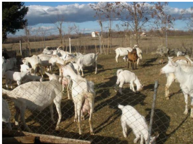
Slika 2: Hrvatska bijela koza