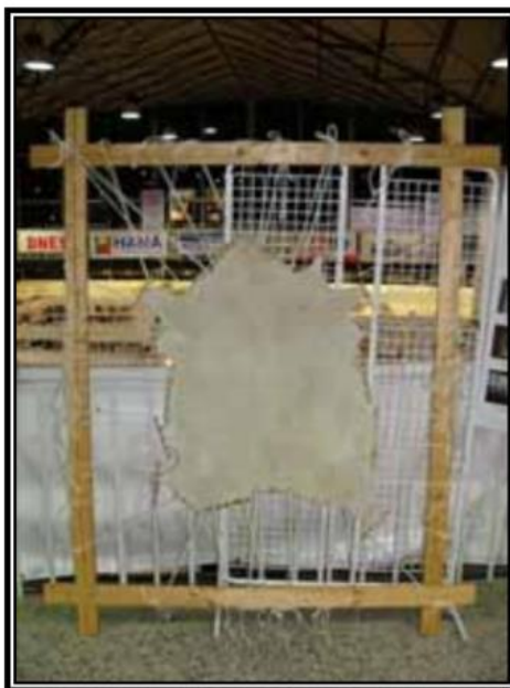
Slika 5: Način sušenja kože kako nebi došlo do oštećenja