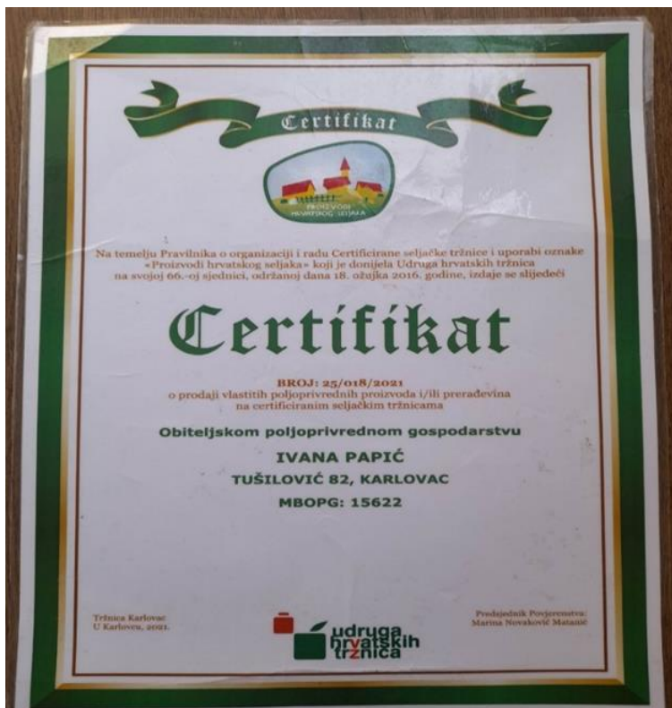
Slika 7. Certifikat