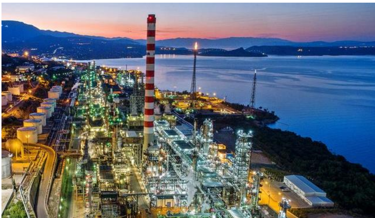
Sl. 2. Rafinerija nafte Rijeka

Da bi sve te izvore zapaljenja sveli na najmanje moguće potrebno je provoditi mjere zaštite.