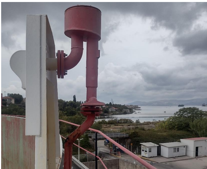
Sl. 9. Mlaznica za zračnu pjenu na spremniku s plivajućim krovom

Mlaznice za zračnu pjenu – mlaznice podtlakom dodaju zrak u mješavinu i tako se stvara pjena koja gasi nastali požar.