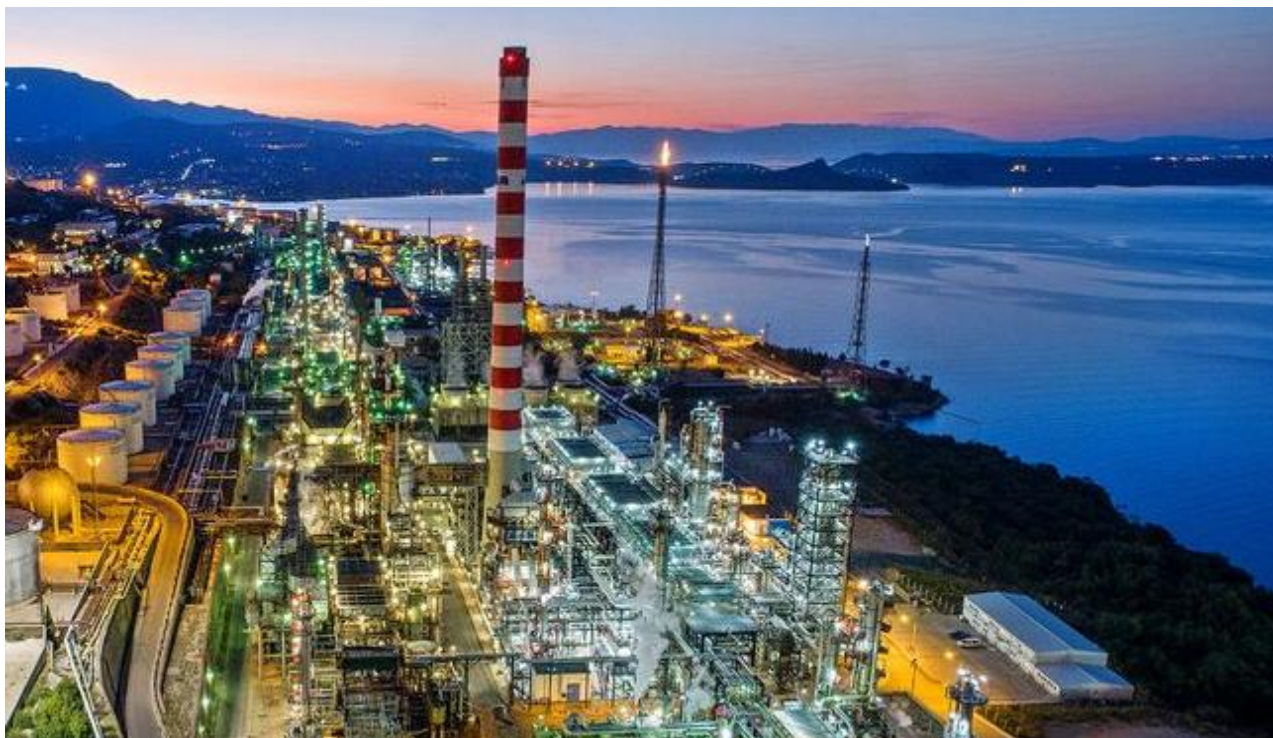
Sl. 2. Rafinerija nafte Rijeka

Da bi sve te izvore zapaljenja sveli na najmanje moguće potrebno je provoditi mjere zaštite.