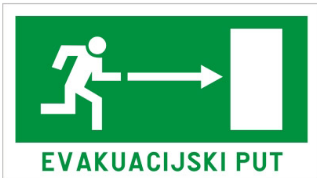
Slika 6. Oznaka smjera evakuacije.[17]

propisuje temeljne postupke zaštite od požara građevine. Na svakom izlaznom putu evakuacije mora biti jasno označen smjer sa strelicom (slika 6), a gazna površina ceste ne smije imati mehanička oštećenja (izbočine, promjene visine, pukotine i sl.).[6]