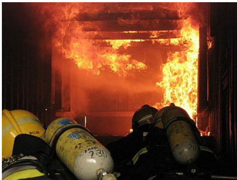
Slika 3. Rollover.[9]