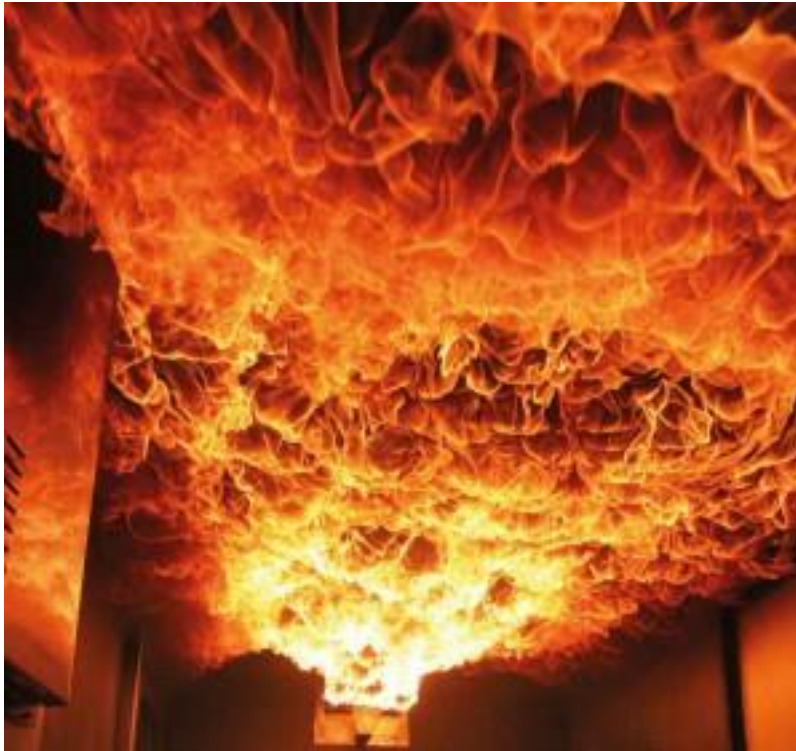
Slika 4. Flashover.[10]