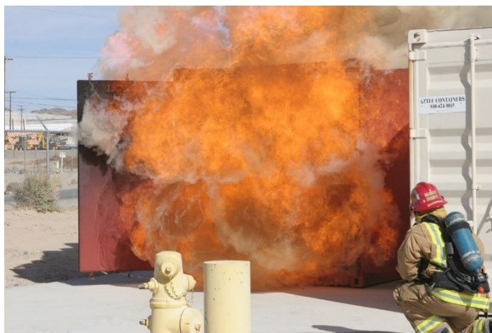
Slika 5. Backdraft.[11]

Povratno prostorno buknuće je vrlo opasno za vatrogasce i druge osobe koje se nalaze u blizini požara, jer se eksplozija može dogoditi bez upozorenja i stvoriti vrlo visoke temperature, plamenove i eksplozije koji se šire prostorijom. Zbog toga je važno da vatrogasci i druge osobe koje se bore protiv požara pažljivo planiraju svoje aktivnosti i upotrebljavaju odgovarajuće mjere sigurnosti kako bi se izbjegle situacije koje bi mogle dovesti do povratnog prostornog buknuća.[8]