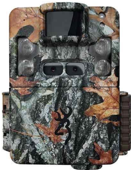
Slika br. 2 Browning trail cameras model btc-5pxd