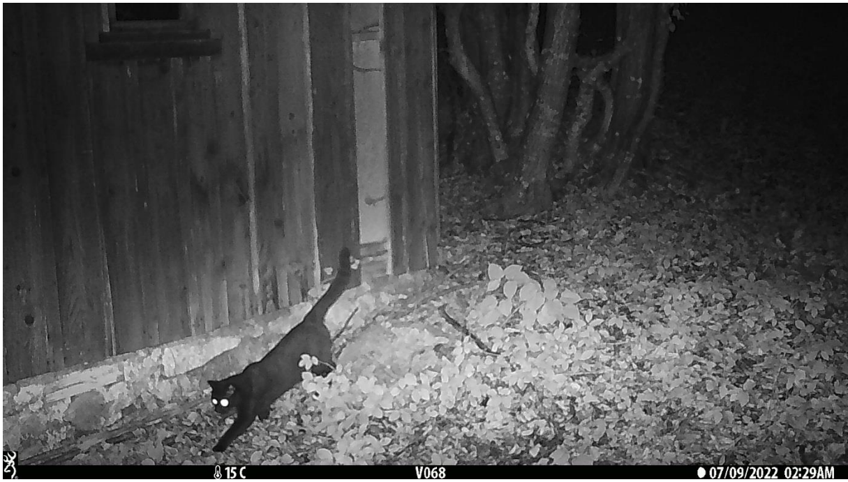
Slika br. 5 Domaća mačka ( Felis silvestris forma catus )