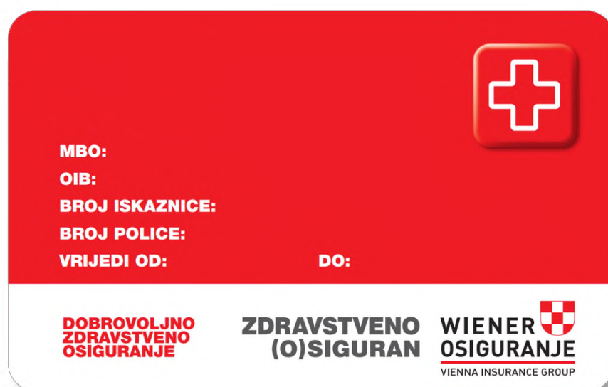
Slika 14 Iskaznica Wiener dopunskog osiguranja

Kao usporedbu (Tablica 3) prikazana je polica HZZO dopunsko osiguranje te Wiener dopunsko zdravstveno osiguranje (Slika 14). Za razliku od HZZO-a, Wiener osiguranje je privatno osiguravajuće društvo u čijoj ponudi osim osiguranja kao što su: životna osiguranja, osiguranja automobila, broдика te plovila itd. nalazi i dopunsko zdravstveno osiguranje. Kao i kod HZZO-a tako i kod Wienera dopunsko osiguranje počinje vrijediti nakon 15 dana od dana sklapanja ugovora o dopunskom osiguranju. Za razliku od HZZO-a koje ima jednu vrstu dopunskog osiguranja, Wiener u svojoj ponudi nudi četiri vrste dopunskog osiguranja, a to su: dopunsko classic, dopunsko classic plus, dopunsko B1000, dopunsko B1000 autorizacija. HZZO ima fiksnu cijenu dopunskog osiguranja za sve osiguranike bez obzira a njihovu životnu dob, dok kod Wienera cijena dopunskog osiguranja ovisi o vrsti dopunskog osiguranja, što znači da osiguranik prilikom sklapanja ugovora o dopunskom osiguranju bira jedan od četiri ponuđena osiguranja. Svako od četiri dopunska osiguranja ima različitu mjesečnu premiju, tako primjerice mjesečna premija za dopunsko classic iznosi 5,97 eura, dopunsko classic plus iznosi 6,90 eura, dopunsko B1000 iznosi 9,16 eura te dopunsko B1000 autorizacija 11,81 eura (Tablica 2). Osim što se međusobno razlikuju cjenovno, razlikuju se i po opsegu pokrivanja sudjelovanja u zdravstvenom osiguranju. [6]