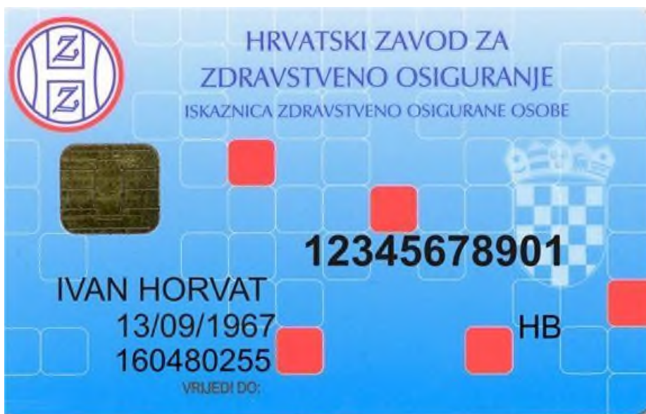
Slika 4 Zdravstvena iskaznica iz obveznog zdravstvenog osiguranja

Dopunsko zdravstveno osiguranje pokriva sva sudjelovanja u načinjenim troškovima iz zdravstvene zaštite u punom iznosu bez ograničenja. Pokriva i B listu lijekova pod određenim uvjetima uz određenu nadoplatu pacijenta. Ukratko dopunsko zdravstveno osiguranje pokriva troškove zdravstvene usluge koje ne pokriva obvezno zdravstveno osiguranje HZZO-a.