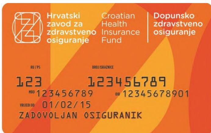
Slika 6 Iskaznica dopunskog zdravstvenog osiguranja

Postupak ugovaranja dopunskog zdravstvenog osiguranja pri HZZO-u provodi se na više načina. Najčešći oblik ugovaranja je osobnim dolaskom u Zavod gdje osiguranici ispunjavaju i potpisuju ponudu za sklapanje ugovora o dopunskom zdravstvenom osiguranju (Slika 7). Dolaskom Covida-19 uspostavljen je su mnogo-brojne e-mail adrese radi komunikacije osiguranika i djelatnika Zavoda te je tako omogućeno slanje ispunjenih ponuda za dopunsko osiguranje i putem e-maila što je omogućeno i dan danas. Također, dopunsko osiguranje može se ugovoriti na stranicama HZZO-a u elektroničkom obliku odnosno e-ponudom gdje u sustav upisujemo osobne podatke, međutim na taj način mogu ugovoriti samo osobe koje posjeduju visoku razinu sigurnosti, odnosno osobe koje imaju mogućnost prijave u sustav E-građani putem e-osobne iskaznice, Certilia poslovni certifikat ili FINA certifikat. Dopunsko osiguranje uz našu suglasnost može ugovoriti i tvrtka kod koje radimo ukoliko je voljna plaćati premiju dopunskog osiguranja. Osnovom dobivenih i obrađenih podataka Zavod putem pošte šalje iskaznicu dopunskog zdravstvenog osiguranja (Slika 6) i primjerak police dopunskog zdravstvenog osiguranja sa uputama za plaćanje na adresu osiguranika.