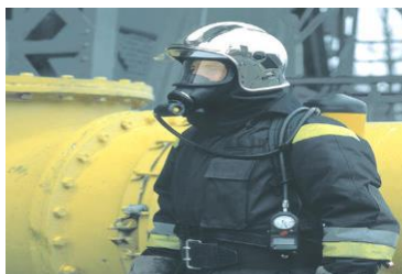
Slika 1 Zaštita dišnih organa

respiratora i manometara, što omogućuje zavarivanje u zagušljivim ili zatrovanim atmosferama, gdje nije moguć dovod svježeg zraka. Postoje i automatizirani sustavi za nanošenje sredstava za zaštitu i čišćenje sapnice pod nazivom Nozzle Cleaning System. Takav sustav se najčešće koristi u kombinaciji s robotiziranim MIG/MAG uređajima gdje se nakon programiranog vremenskog intervala izvodi čišćenje sapnice. Robot dovodi pištolj u sustav, a sapnica se steže pomoću pneumatskih klješta. Nakon toga rotirajući alat čisti nataložene kapljice nastale prilikom prskanja. Na kraju se kapljice ispušu i pištolj, odnosno sapnica se zaštite sredstvom protiv ljepljenja.