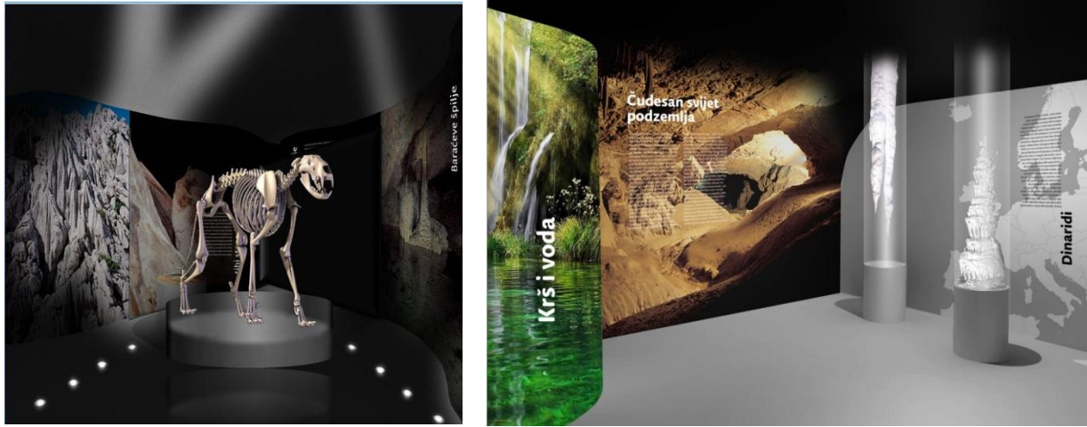
Slika 3. Izgled interijera s pojedinim tematskim područjima