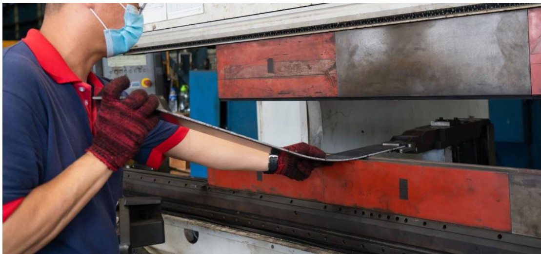
Slika 17. Rad na stroju za savijanje lima [18]

upravljačku jedinicu, uređaj za nožno upravljanje, hidrauliku, vodilicu za škare i opasnosti od dijelova pod naponom [5, 7, 19]. U radu sa strojevima za savijanje lima radnik ne smije zaboraviti nositi zaštitne rukavice. One štite njegove ruke od ozljeda oštrom opremom. Uvijek mora koristiti zaštitne naočale kako bi zaštitio oči od sitnih čestica koje lete tijekom procesa savijanja (slika 17). On mora nositi radne čizme. One će spriječiti da bilo kakav otpad ili šiljasti materijal ozlijedi njegova stopala. Trebao bi izbjegavati prelaziti rukama preko oštre posjekotine, čak i ako nosi rukavice. Trebao bi uvijek provjeriti jesu li sve oštrice pravilno isturpijane. Trebao bi uvijek održavati radnu površinu čistom. Treba očistiti sav otpad jer može predstavljati opasnost od ozljeda. Kada rukuje mokrim limovima, treba biti izuzetno oprezan. Mokre površine sadrže vlagu koja, kada se pomiješa s prljavštinom i uljem, može učiniti površinu plahte skliskom, što otežava držanje [19].