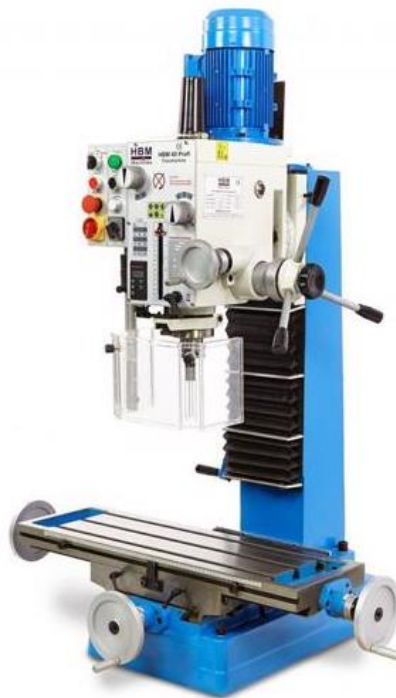
Slika 13. Opasnosti rada na vertikalnoj glodalici uključuju zahvaćanje odijela radnika s vretenom, pucanje alata uslijed greše alata ili u radu, izmicanje ili odlijetanje obratka, opasnosti od prijenosnih elemanta, zakrčenosti radnog mjesta, poskliznuća, letećih strugotina ili neispravnih instalacija [10]