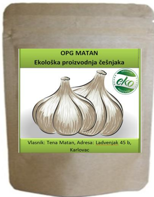
Slika 6: Pakiranje domaćeg sušenog češnjaka u listićima i granulama

Izvor: vlastita obrada autora, 17.7.2023.