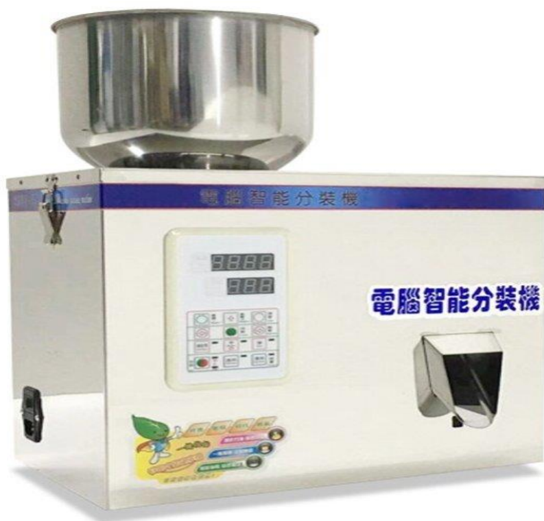
Slika 7: Stroj za automatsko vaganje i pakiranje sušenog češnjaka