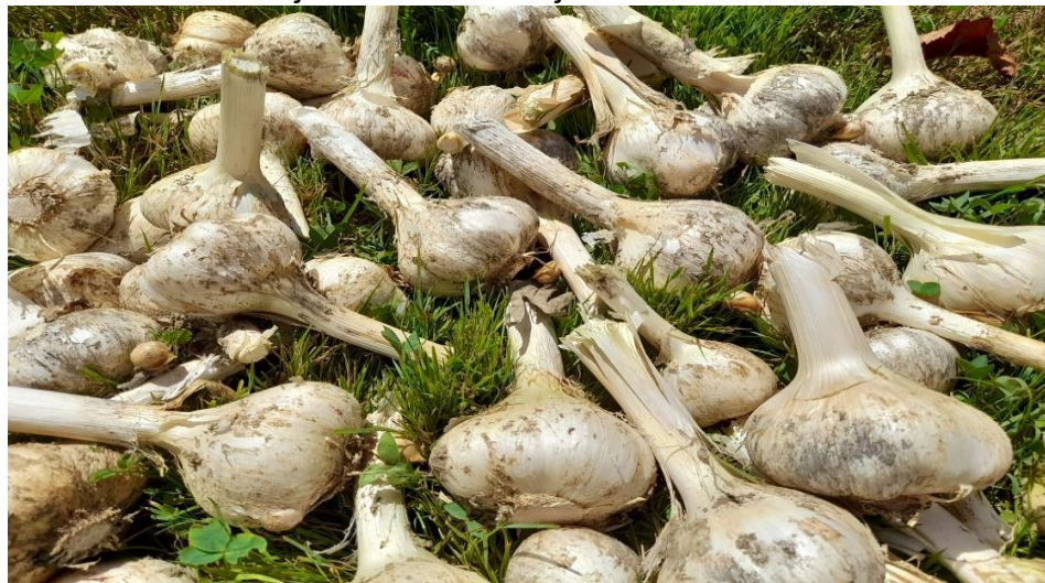
Slika 5: Svježi domaći češnjak OPG-a Matan