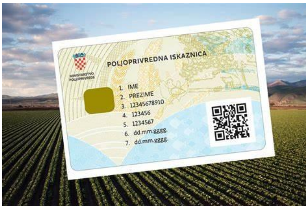
Slika 1: Poljoprivredna iskaznica