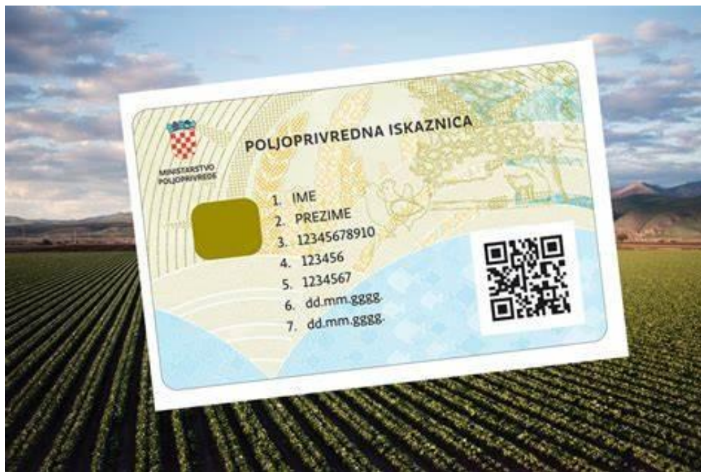
Slika 1: Poljoprivredna iskaznica