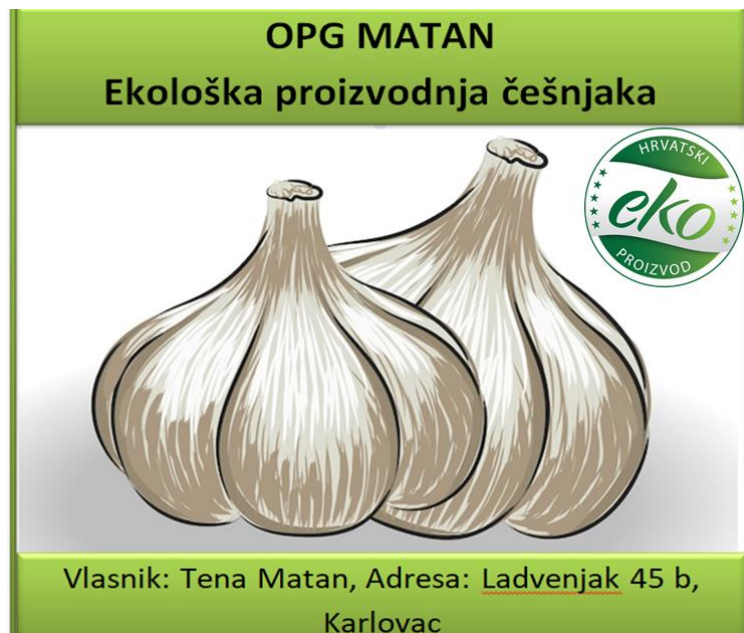
Slika 9: Logo