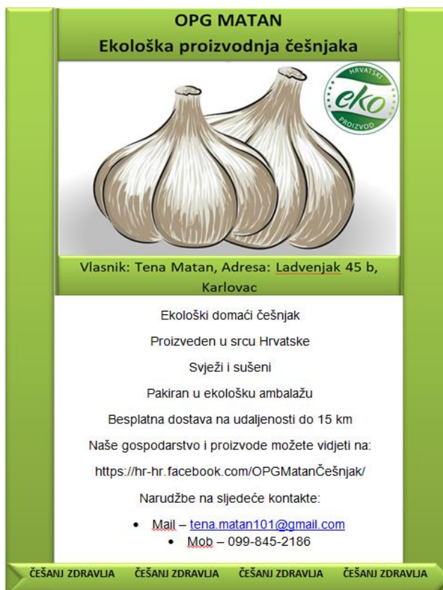
Slika 10: Promotivni letak