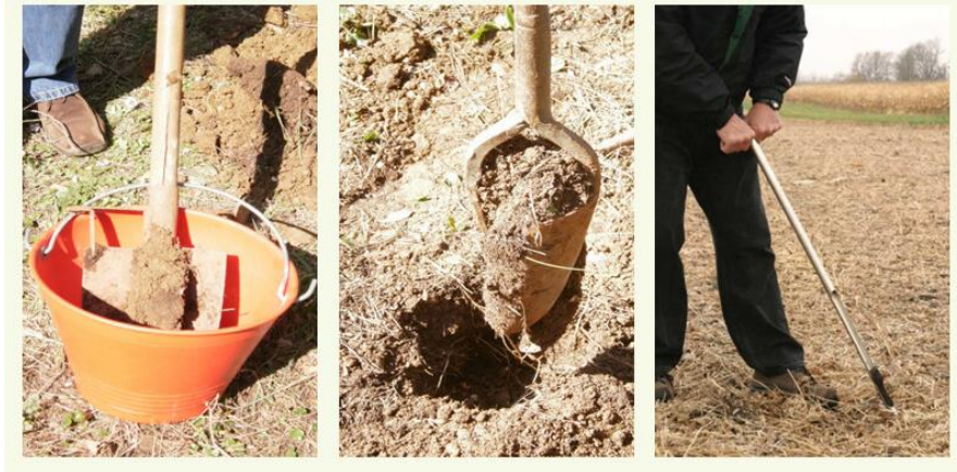
Slika 3: Načini uzimanja uzoraka tla pomoću sondi ili štijače