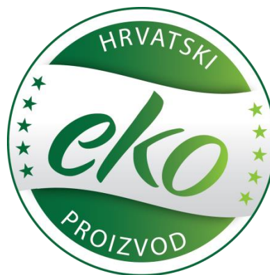
Slika 4: Oznaka hrvatskog ekološkog proizvoda