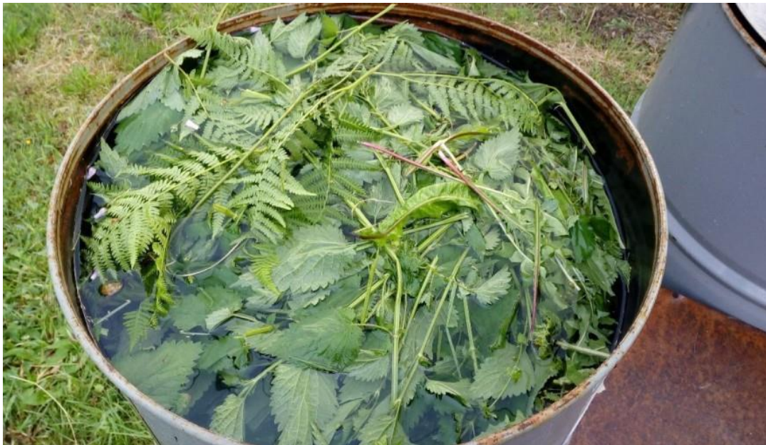
Slika 8: Spravljanje ekološkog zaštitnog sredstva