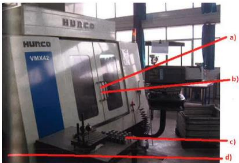
Slika 5. Mjesta opasnosti na CNC glodalici [4]