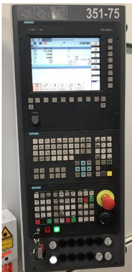
Slika 6. Upravljačka jedinica Sinumerik [15]

Sinumerik ploča (slika 6) opremljena je i numeričkom i abecednom tipkovnicom. Ploča ima LCD zaslon osjetljiv na dodir, ali uključuje i gumbе duž zaslona koji se mogu koristiti za prilagođavanje programa. Najočitiји gumb je središnje zaustavljanje stroja. Ispod ovog gumba nalazi se potenciometer za kontrolu brzine u rasponu od 0 do 120%. Na prednjoj strani ploče nalazi se USB ulaz za spajanje vanjskog uređaja. Kako bismo koristili sve funkcije panela, moramo imati upravljačku tipku u odgovarajućem položaju. Bez ključa ne možete, na primjer, uređivati program ili mijenjati alate u stroju. Ovim jednostavnim sigurnosnim elementom možemo spriječiti neovlaštene osobe da manipuliraju strojem i programima.