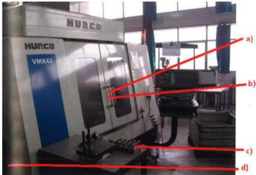
Slika 5. Mjesta opasnosti na CNC glodalici [4]