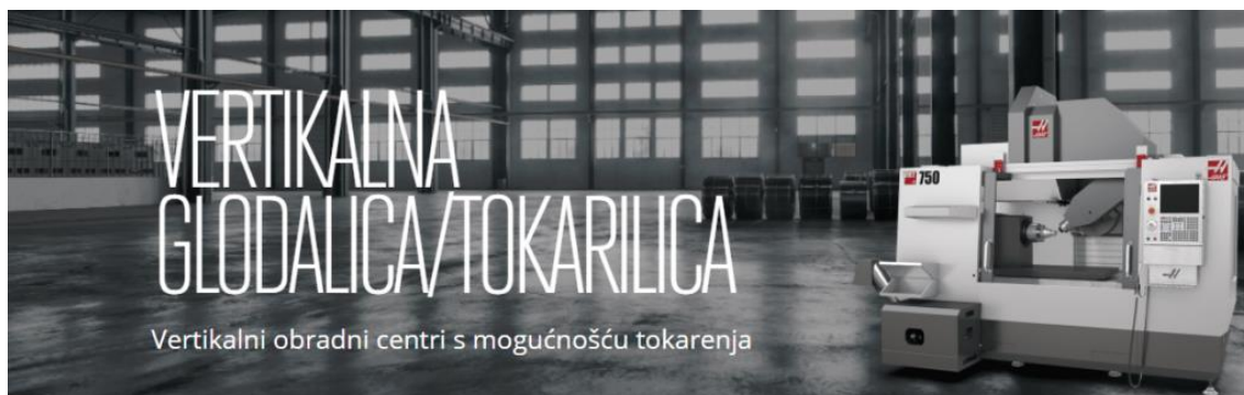
Slika 4. CNC stroj glodalica/tokarilica [3]