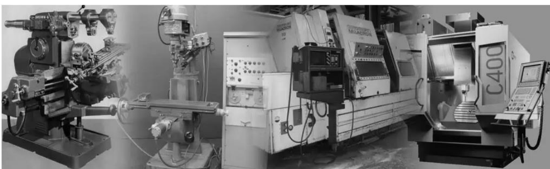
Slika 1. Povijesni razvoj strojeva za strojnu obradu [2]

kvalitete i točnosti obrade, smanjenje utrošenog radnog vremena i povećanje potrebe za kvalificiranim inženjerima, a sve se to ubrzano pojavilo i počelo razvijati nakon Drugog svjetskog rata. Inovacije i promjene donijele su novu eru strojne obrade, omogućujući masovnu proizvodnju dijelova visoke točnosti i fokus na detalje uz značajno smanjenje troškova proizvodnje. Danas koristimo CNC strojeve za izradu malih i jednostavnih do ogromnih, složenih dijelova od mnogih materijala. Slika 1 prikazuje opisanu evoluciju strojne obrade kroz razvoj CNC strojeva. [2]