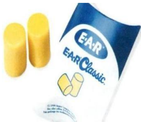
Slika 6. Zaštitna vata [4]