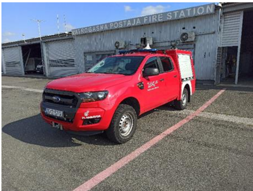
Slika 10. ODRA 1 - Ford Ranger sa vatrogasnom nadogradnjom

Spasilačko vatrogasna služba MZLZ posjeduje ukupno 39000 l vode i 4500 l pjenila sa kapacitetom pražnjenja od 26000 l/min što znači da operator zračne luke može osigurati najvišu spasilačko-vatrogasnu kategoriju aerodroma 10.