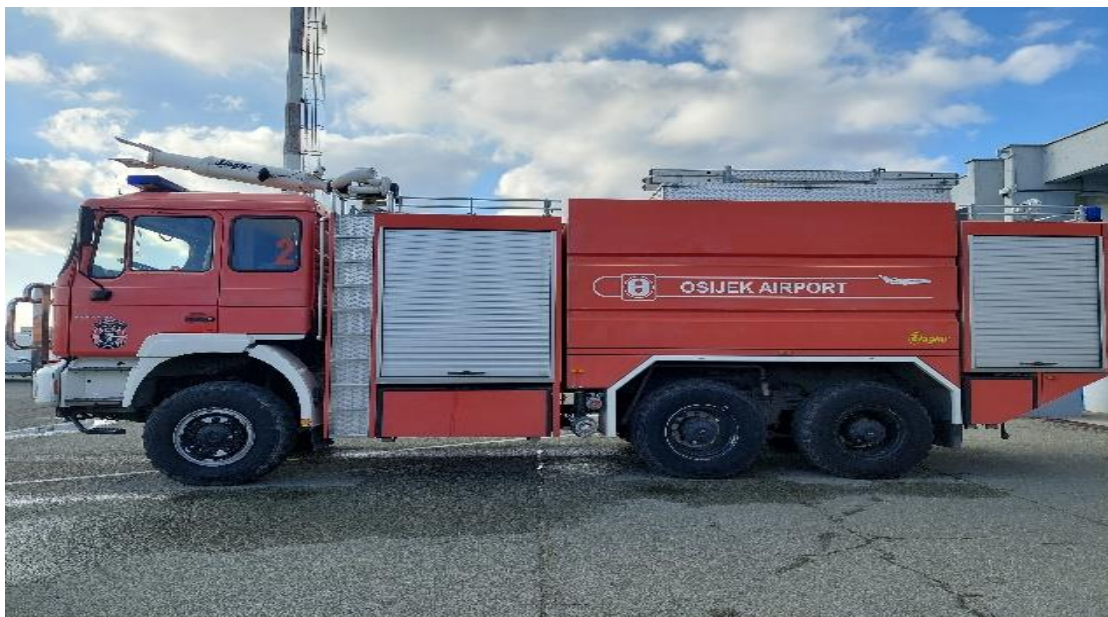
Slika 14. MAN FLF 60/90-11+250P

Od opreme vozilo posjeduje hidraulički alat za rezanje i razupiranje, cijevi i armature za gašenje, bušilicu, kutnu brusilicu, motornu brusilicu sa pripadajućim brusnim pločama za beton i željezo, mehaničarski alat u kutiji, poluga, sjekira, čaklja, štihača, ljestve sastavljače, ljestve rastegače, izolacijske aparate, aparate za početno gašenje požara, nosila, prva pomoć i druga oprema određena Pravilnikom o spasilačko-vatrogasnoj službi na aerodromu.[13]