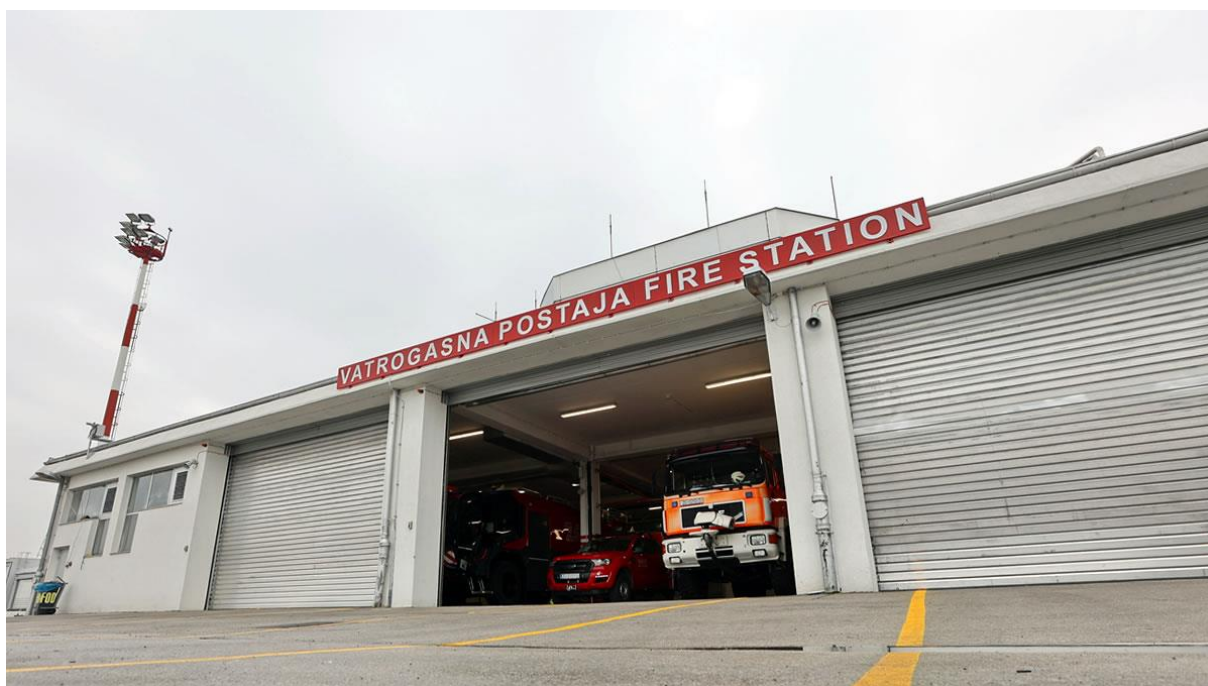
Slika 1. Spasilačko-vatrogasna služba, Vatrogasna postaja Međunarodne zračne luke Zagreb

Operator zračne luke dužan organizirati spasilačko-vatrogasnu službu, ali daje mu mogućnost da osim vlastite spasilačko-vatrogasne službe može imati djelom vlastitu i djelom druge organizacije i u cijelosti druge organizacije pod uvjetom da su zaposlenici druge organizacije osposobljeni za poslove spasilačko-vatrogasne službe.[14]