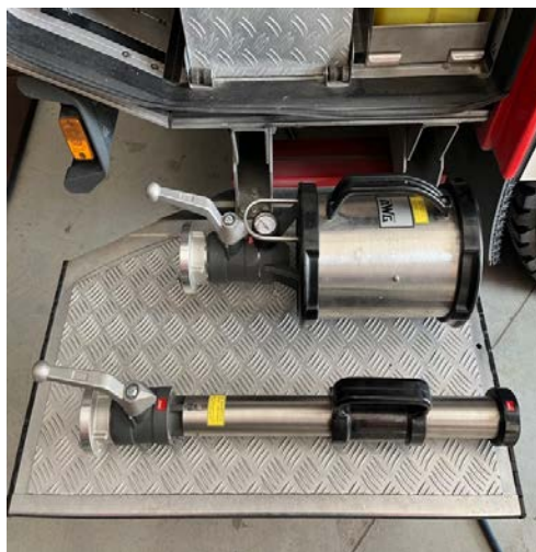
Sl.8. Mlaznice za srednje tešku i tešku pjenu.[4]

Generator lake pjene namijenjen je za gašenje požara zatvorenih prostora. Zbog velike ekspanzije pjene postiže se brzo ispunjanje prostora pjenom. Izrađuje se sa ili bez ugrađenog mješača. Ima i mrežu za stvaranje pjene. Radni tlak za dobivanje najbolje pjene je od 5 do 7 bara.