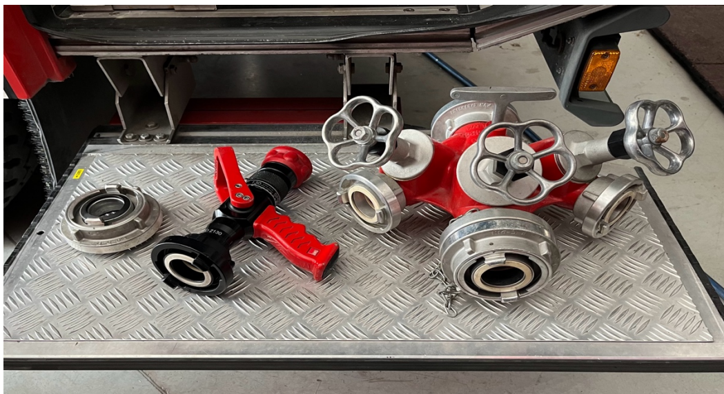
Sl.6. Armature za vodu iz navalnog vozila JVP Trogir (prijelazna spojnica, turbo mlaznica i razdjelnica).[4]

Vatrogasne armature za vodu su vatrogasne spojnice, mlaznice, razdjelnica, sabirnica, ublaživač reakcije mlaza, uređaj za ograničavanje tlaka, dubokosrkač i usisna košara. Najviše se koriste spojnice, mlaznice i razdjelnica.[1]