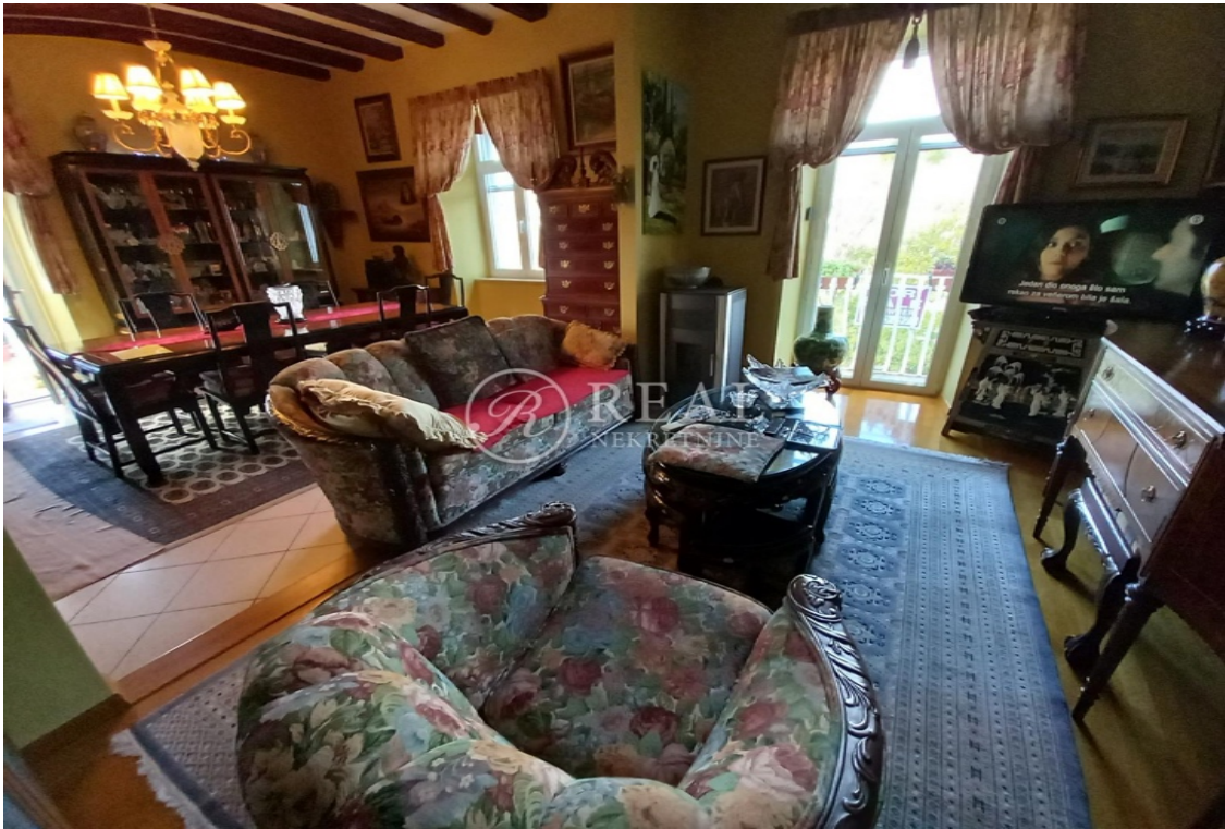
Sl.20. Uređenje stana u staroj gradskoj jezgri u Trogiru.[11]