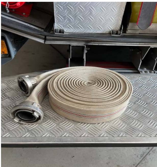
Sl.5. Vatrogasna „C“ cijev.[4]

Različite dimenzije cijevi koriste se ovisno o količini gorivog materijala, temperaturi požara i konfiguraciji terena. Primjerice na požarima objekata koriste se „C“ cijevi, za dopunjavanje kamiona vodom „B“ cijevi, a za šumske požare „D“ cijevi ili vitlo brzo navale (S31,5).