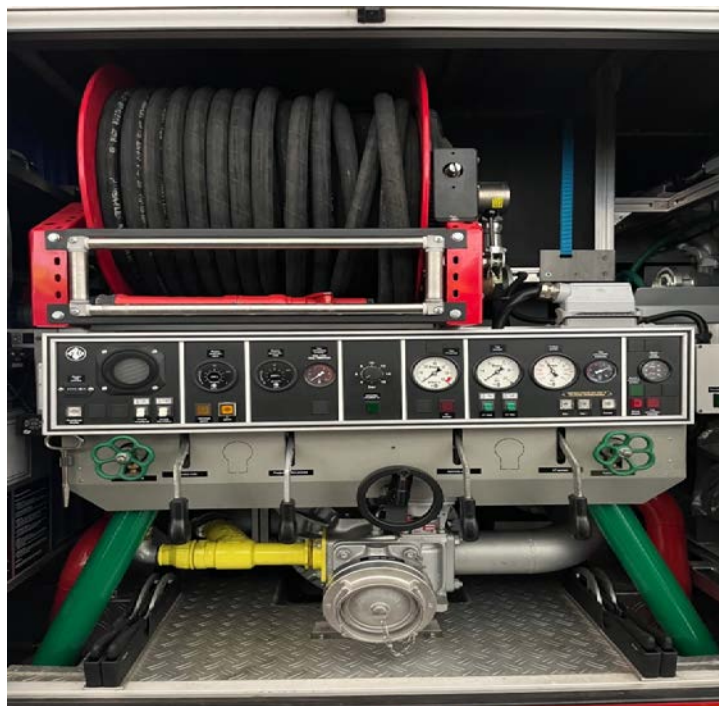
Sl.18. Pumpa ugrađena na vozilo.[4]

Moderno vatrogastvo je nezamislivo bez vatrogasnih pumpi.