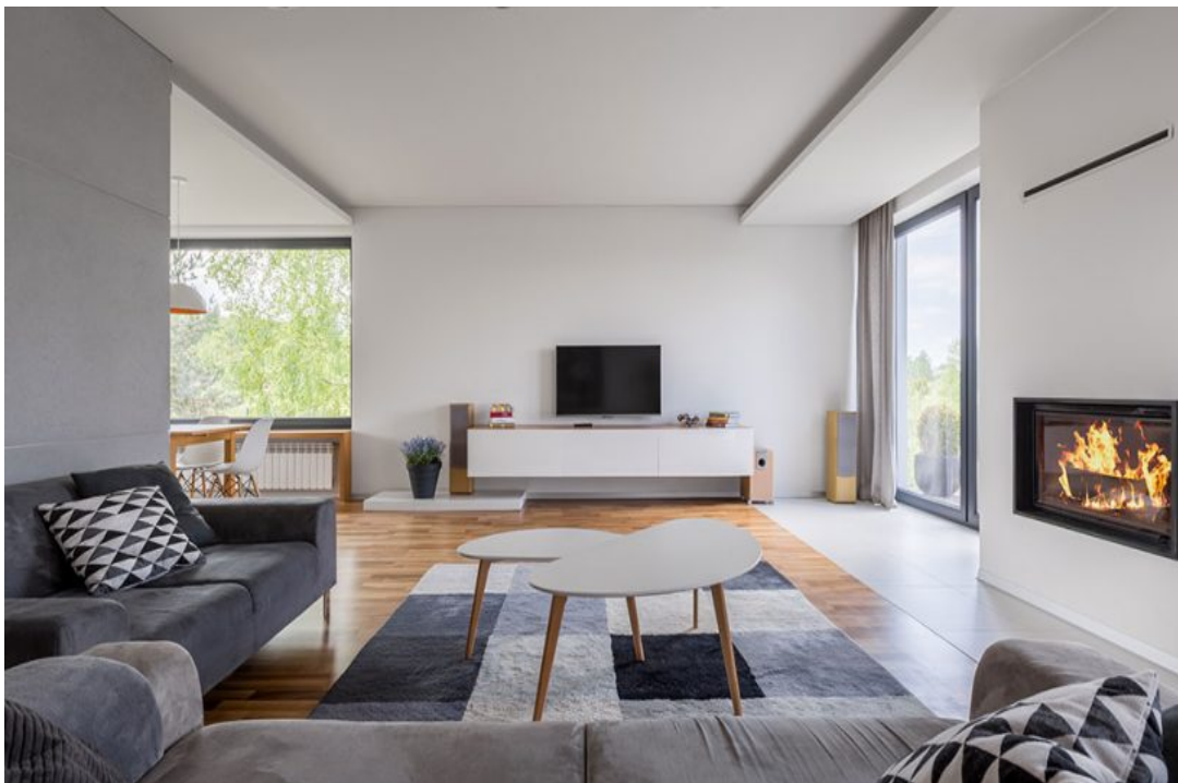
Sl. 21. Uređenje modernog stana u okolici Trogira.[11]