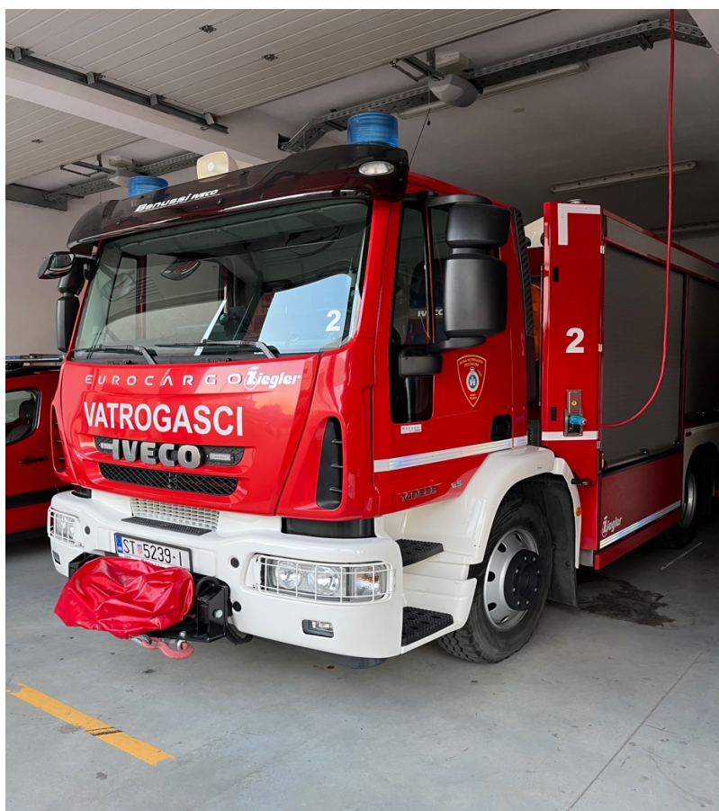
Sl.11. Navalno vozilo JVP Trogir Iveco Eurocargo.[4]

Iveco Eurocargo je navalno vozilo JVP Grada Trogira, vozilo je označeno brojem 2 i prvo izlazi na tehničke intervencije. U njemu se nalaze pneumatski i hidraulični alati koji imaju širok spektar upotrebe ali prvenstveno se koriste kod prometnih nesreća. Ima spremnik vode od 2500 L i spremnik pjenila od 250 L, opremljen je izolacijskim aparatima, aparatima za početno gašenje požara, vitlom brze navale, motornim pilama, prijenosnim ljestvama i ostalom korisnom vatrogasnom opremom.[4]