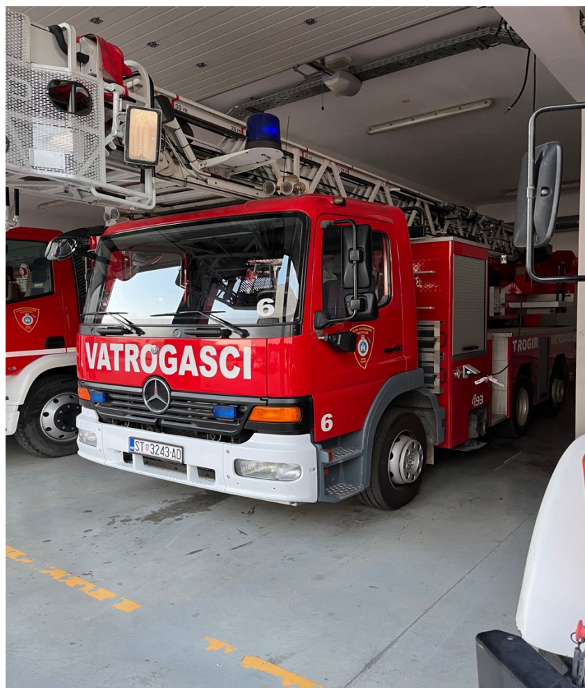
Sl.14.Autoljestva JVP Trogir.[4]

U vozilu se nalazi vatrogasna oprema za rad na intervenciji.[4]