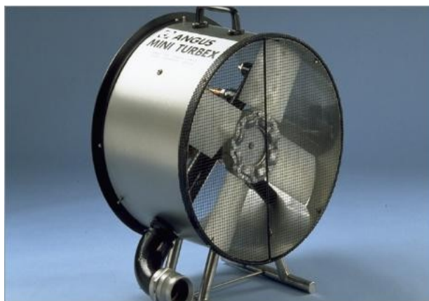
Sl.9. Generator lake pjene.[5]

Generator lake pjene namijenjen je za gašenje požara zatvorenih prostora. Zbog velike ekspanzije pjene postiže se brzo ispunjanje prostora pjenom. Izrađuje se sa ili bez ugrađenog mješača. Ima i mrežu za stvaranje pjene. Radni tlak za dobivanje najbolje pjene je od 5 do 7 bara.