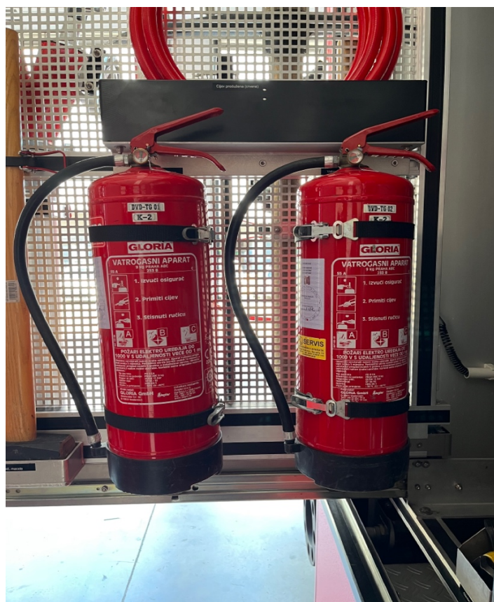
Sl.17. Dva vatrogasna aparata za gašenje prahom iz vozila JVP Trogir.[4]