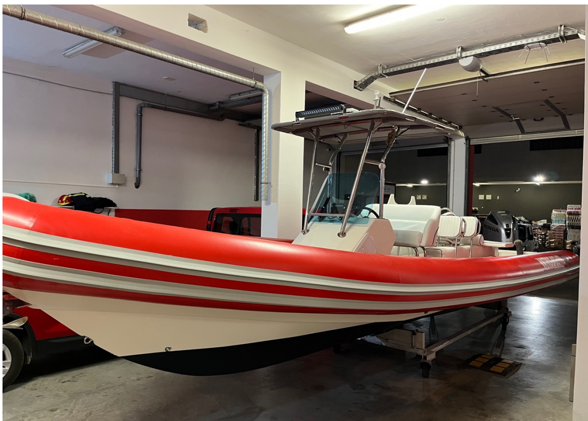
Sl.15. Vatrogasni brod DVD-a Trogir prilikom redovnog održavanja. [8]

Dobrovoljno vatrogasno društvo Trogir posjeduje i vatrogasni brod za prijevoz ljudi i opreme i gašenje požara. Brod je 9 m dug gumenjak sa sjedištima za prijevoz i ugrađenim topom za gašenje na provi. Top se može zamijeniti i ublaživačem reakcije mlaza u slučaju da se potrebno kretati sa mlaznicom po brodu. Na krmi je smještena vatrogasna pumpa koja usisava more i tlači ga kroz cijev do mlaznice. Pogodan je za prijevoz ljudi i opreme na mjesta požarišta gdje kamion ili kombi ne mogu dovesti vatrogasce (na Trogirskom području to je južna strana otoka Čiova i otoci Drvenik Veli i Drvenik Mali). Smješten je luci nedaleko od vatrogasnog doma u Trogiru, po dojavi vatrogasci uzimaju dodatnu opremu ako je potrebna, sjedaju u vozilo za prijevoz ljudi i kreću prema brodu na ukrcaj.[8]