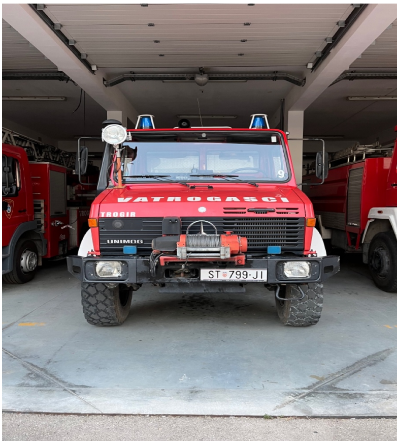
Sl.13. Vozilo za gašenje šumskih požara JVP Grada Trogira.[4]

Opremljen je spremnikom vode od 2500 L, 2 vitla brze navale, cijevima i armaturama za gašenje vodom. Uz autocisternu za nadopunu vodom koja će ga pratiti, nijedan požar otvorenog prostora nije prepreka za ovo vozilo.[4]