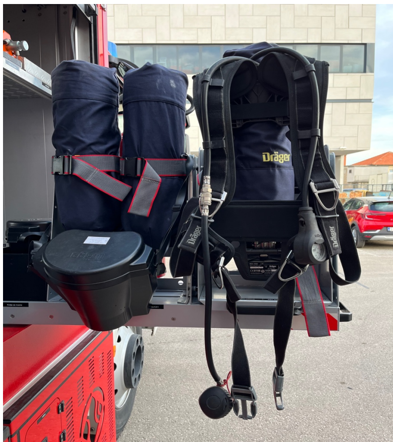
Sl.10. Izolacijski aparat na navalnom vozilu JVP Trogir.[4]

U većini slučajeva vatrogasci koriste zatvorene sustave izolacijskih aparata sa stlačenim zrakom koji su neovisni o okolnoj atmosferi, temelje se na načelu izolacije dišnog sustava nositelja.[7]