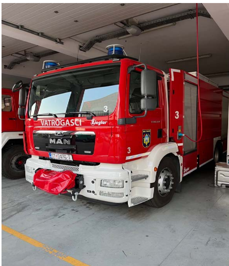
Sl.12. Autocisterna DVD-a Trogir.[8]

Dobrovoljno vatrogasno društvo Trogir, koje djeluje na istoj adresi kao i Javna vatrogasna postrojba Grada Trogira, koristi MAN autocisternu koja nosi 8000 L vode i ima spremnik pjenila od 400 L, na krovu ima bacač vode i pjene. Cisterna je opremljena i armaturama za gašenje vodom i pjenom, izolacijskim aparatima, vitlom brze navale, prijenosnim ljestvama i motornom pilom te može samostalno djelovati na više vrsta intervencija.[8]