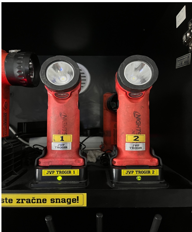
Sl.3. Baterijske svjetiljke JVP Grada Trogira.[4]

Svaki vatrogasac na svom intervencijskom odijelu, pri ulazu u bilo kakav objekt, mora imati baterijsku svjetiljku koja pomaže u slabo vidljivim atmosferama te su vatrogasci uočljiviji drugim vatrogascima na terenu. Svaka svjetiljka koju koriste vatrogasci mora biti u protueksplozijskoj – Ex izvedbi, što znači da ne smije stvarati iskru koja može potaknuti požar u eksplozivnoj atmosferi. Na slici 3 su prikazane svjetiljke koje koristi JVP Grada Trogira.[4]