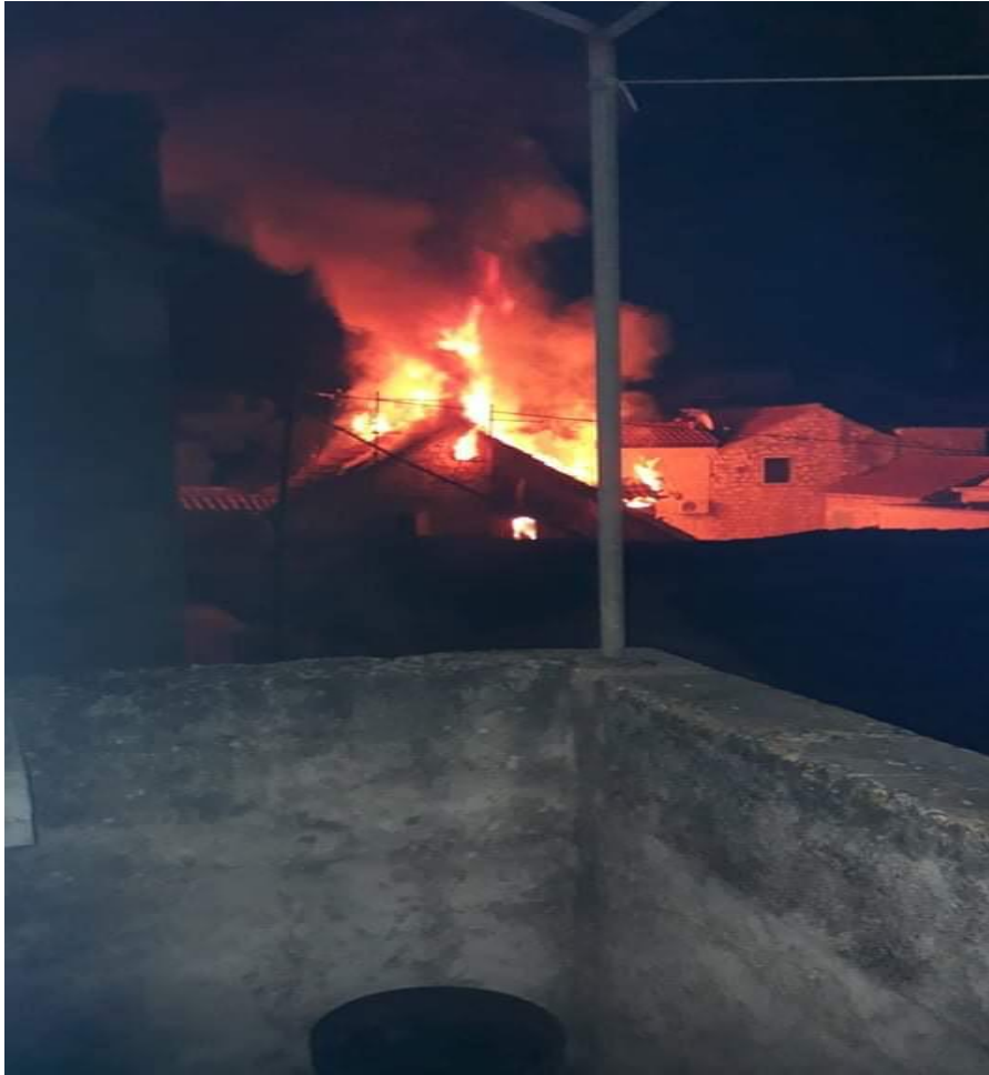
Sl.22. Požar objekta u Trogiru 19.4.2021.[4]

Tijekom idućeg dana, nakon obavljenog očevida PU Splitsko-dalmatinske, pristupilo se konačnoj sanaciji i čuvanju požarišta koji je proglašen ugašenim u 18:30 sati. Dana 22. travnja, dežurna smjena JVP Grada Trogira vršila je uklanjanje kupa i nagorenih greda objekta koje su prijetile padanjem na ulicu.