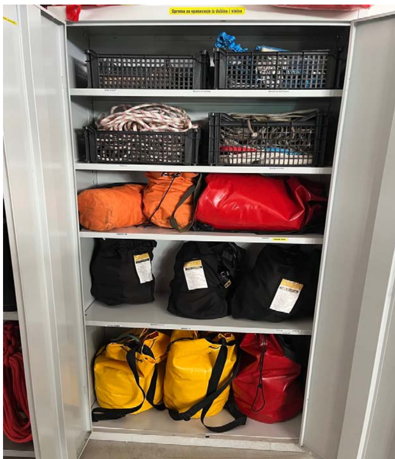
Sl.16. Ormar s opremom za rad na visini JVP Trogir.[4]

U garaži vatrogasnog doma u Trogiru je smješten ormar u kojem stoji samo oprema za rad na visinama i dubinama, specijalizirani opasači, različiti uređaji za rad na visini, konopci, itd..[4]