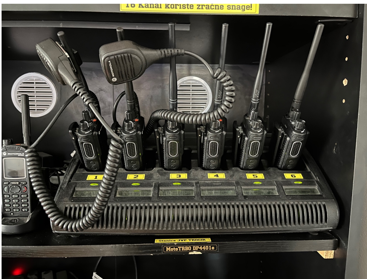
Sl.4. Radio stanice JVP Grada Trogira.[4]

Iako nisu navedene u službenoj podjeli skupne vatrogasne opreme, smatra se da i radio veza pripada na taj popis. Bez radio stanica komunikacija na terenu bi bila nemoguća. Svaka vatrogasna grupa (2 vatrogasca) na terenu ima jednu radio stanicu na koju prima zapovijedi i obavještava nadležne i VOC o stanju na terenu. Ovisno o području na kojem se intervencija odvija, prebacuju se između radnih kanala za komunikaciju na terenu. Na slici 4 su prikazane radio stanice koje koristi JVP Grada Trogira.