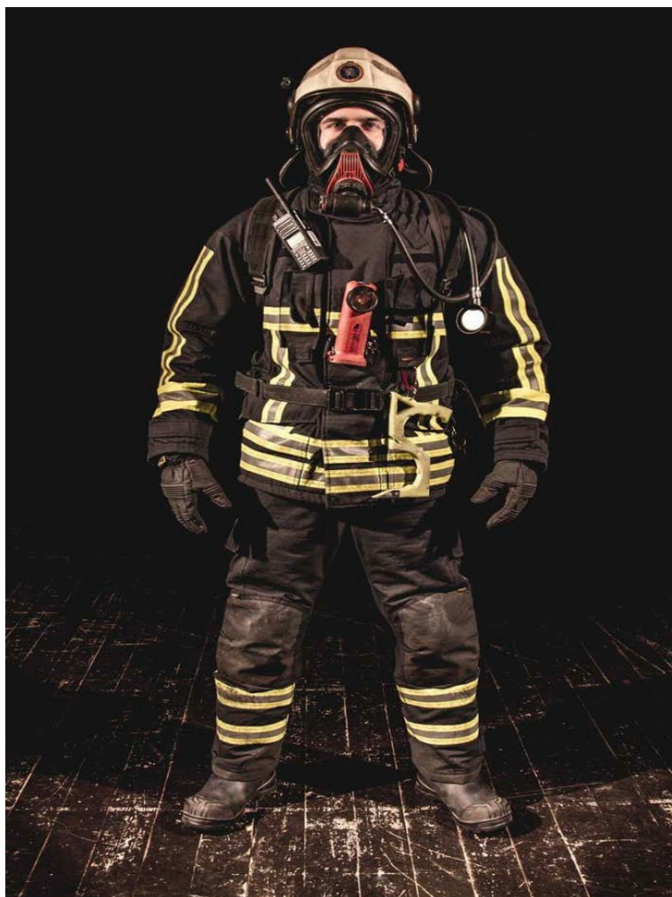
Sl.1. Vatrogasac potpuno opremljen zaštitnom vatrogasnom opremom.[3]

Maska za cijelo lice štiti dišne organe korisnika od udisanja štetnih plinova, izrađuje se od sintetske gume i u potpunosti je priljubljena za lice. Razlikujemo maske normalnog i povećanog tlaka. Ovisno o spoju na masci na nju se mogu priključiti filterar ili plućni automat.[1].