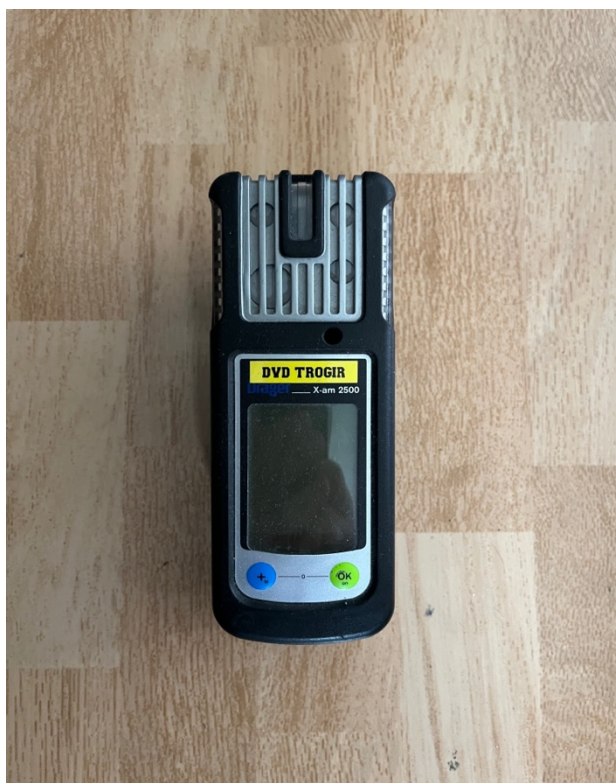
Sl.2. Eksploziometar JVP Grada Trogira.[4]

Eksploziometar je uređaj koji mjeri razinu zapaljivih plinova i para, kisika i ugljičnog monoksida. Vatrogasci ga nose sa sobom u zagađene prostore, ima 2 alarma. Prvi alarm se javlja kada je atmosfera zagađena, ali ne toliko da se ne smije stati u tom prostoru, taj alarm se može isključiti. Drugi alarm se javlja prije nego se u prostoru stvori eksplozivna ili otrovna atmosfera, on se ne može ugasiti i kada se oglasi vatrogasci moraju napustiti prostor. Na slici 2 je prikazan eksploziometar (Drager x-am 2500) koji koristi JVP Grada Trogira.[4]