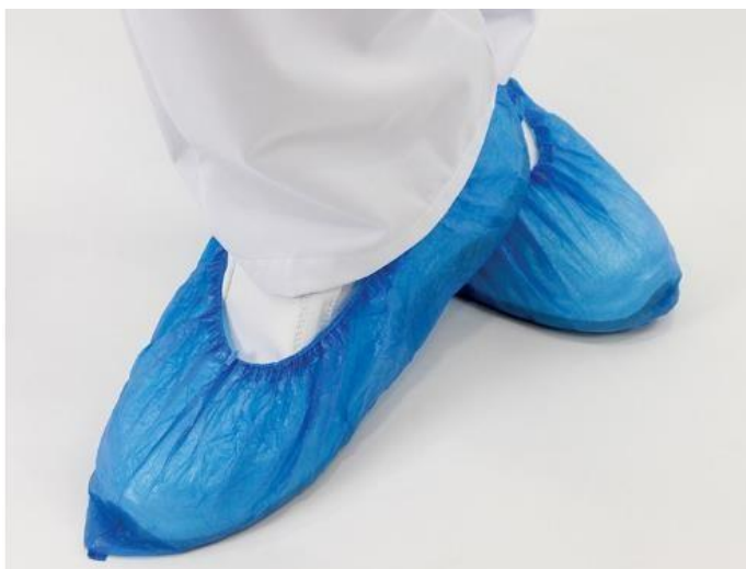
Sl.17 Jednokratne zaštitne navlake za noge [17]