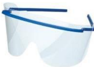
Sl.15. Zaštitne naočale [15]