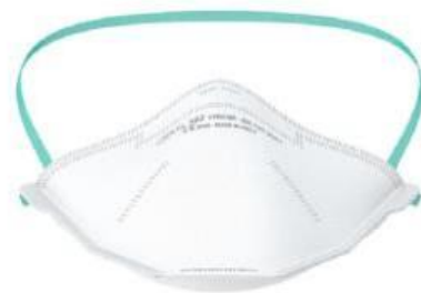
BLS502 FFP2 sklopivi respirator