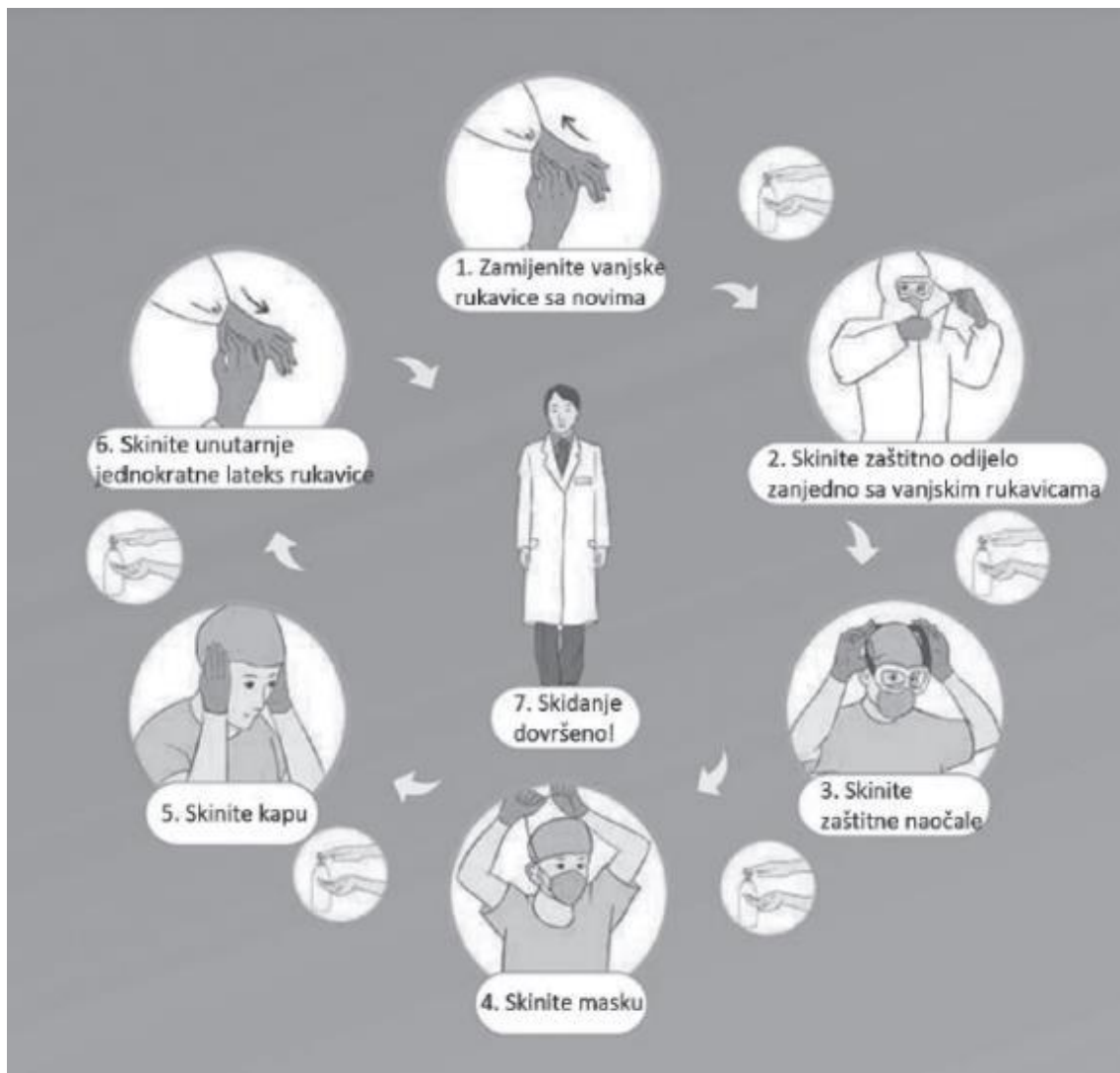
Sl.13 Postupak skidanja zaštitne opreme [13]

s lica. Zbog globalne nestašice i limitirane dostupnosti osobne zaštitne opreme CDC je pripremio smjernice za ponovnu upotrebu jednokratnih maski ukoliko nema drugih mogućnosti. Maska se skida na način da ne dodirujemo kontaminirani vanjski dio, već je hvatamo za gumice ili vezice i skidamo od lica te odlažemo u infektivni otpad i nakon toga obavezno peremo ruke ili ih dezinficiramo alkoholom.“ [10]