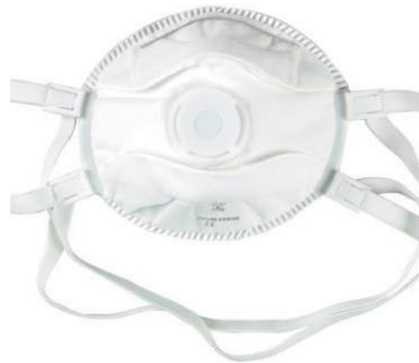
23305 FFP3 sklopivi respirator s ventilom 20/1