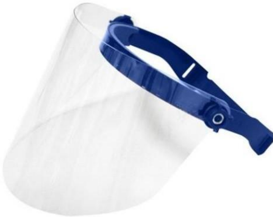
Sl. 14. Zaštitni vizir [14]

Osim zaštitnih maski, odijela, rukavica i ostale opreme, u zaštiti od respiratornih zaraznih bolesti koristi se i zaštitni vizir. Služi tome da zdravstveni radnik što bolje zaštiti lice od prskanja sline, kapljica, patogena. Vizir ne zamjenjuje zaštitnu masku, stoga je potrebno nositi ga u kompletu sa zaštitnom maskom.