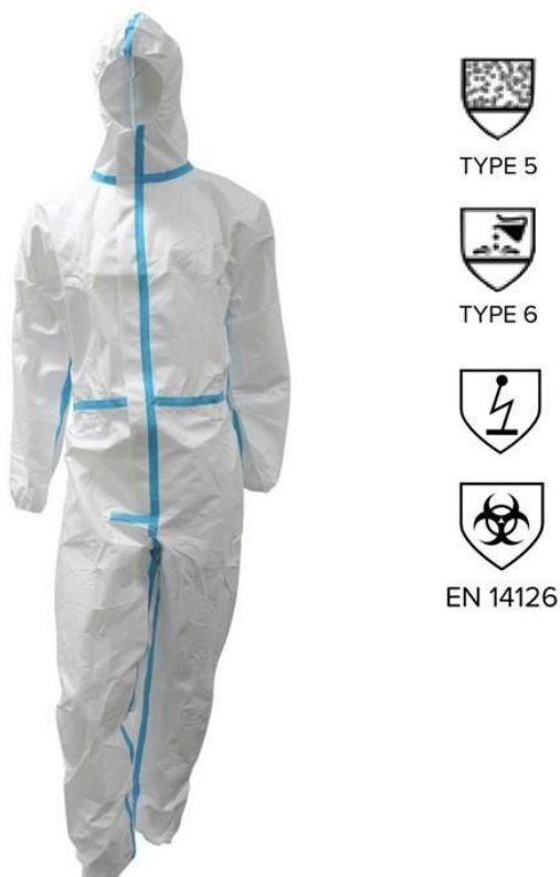
Sl. 2 Jednokratni kombinezon SPFH [2]

U narednom dijelu slijedi opis svakog dijela zaštitne opreme koja se koristila u vrijeme epidemije/pandemije. Sva oprema je proizvedena po važećim standardima i normama EU.