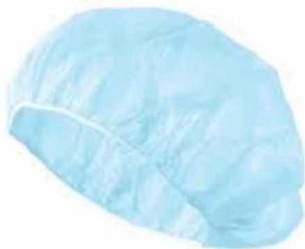
Sl.16 Zaštitna kapa [16]

Uz svu ostalu zaštitnu opremu, zdravstveni djelatnici su tijekom pandemije/epidemije koristili i zaštitne kape.