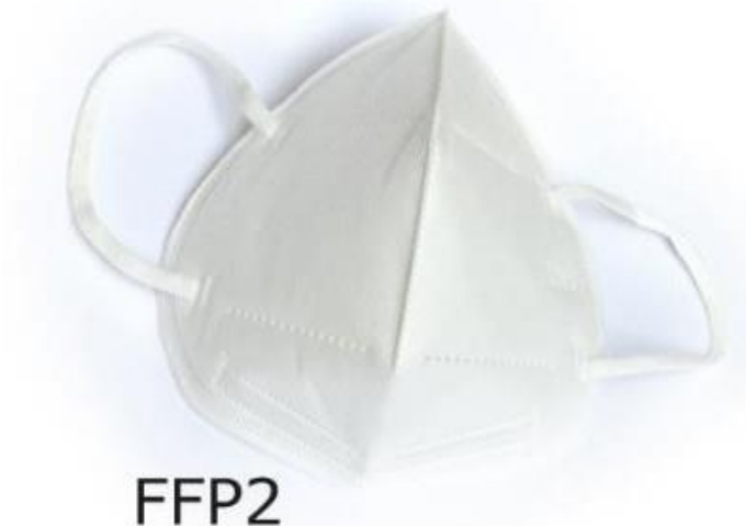
Sl.7 Zaštitna maska FFP2 [7]

Kako bi se zaštitilo dišne organe u najvećoj mogućoj mjeri, maska FFP2 ima svrhu zaštititi od ulaska virusa, prašine i ostalih štetnih čestica. Maske se izrađuju od dva sloja netkane tkanine i srednjeg sloja filtrirajuće tkanine. Princip kako maske djeluju je temeljen na srednjem sloju filtrirajućeg materijala koji ima svojstvo statičkog elektriciteta tako da može apsorbirati nečistoće i male čestice. „Budući da se fina prašina apsorbira na filterski element, a filterski element je statičan i ne može se prati vodom, samousisni filterski respirator protiv čestica treba redovito mijenjati filterski element.“ [10]