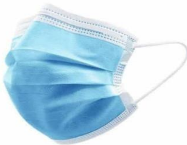
Sl. 6. Jednokratna zaštitna maska za lice [6]

„Obzirom na utvrđenu veličinu SARS-CoV-2 virusa (promjera 60 nm – 140 nm) proizlazi da kirurška maska ne može u potpunosti spriječiti inhalaciju tako malih čestica prisutnih u zraku, a samim tim ne osigurava potpunu zaštitu od štetnih bioloških uzročnika kao što su virusi, kako korisnika tako i drugih osoba.“ [9]