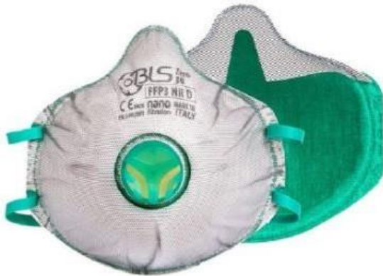
BLS031 ZERO FFP3 respirator