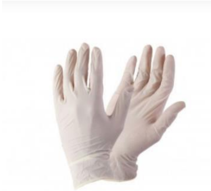
Sl. 3. Zaštitne medicinske rukavice [3]

Zaštitne rukavice koriste zdravstvenim radnicima da ne dođu u kontakt sa kontaminiranim sadržajima poput krvi, izlučevina, sekreta, ekskreta, urina i raznim patogenima koji bi mogli uzrokovati bolesti. Zaštitne rukavice nisu zamjena za pranje ruku jer higijena je u zdravstvenim ustanovama najvažnija prevencija protiv bolesti.