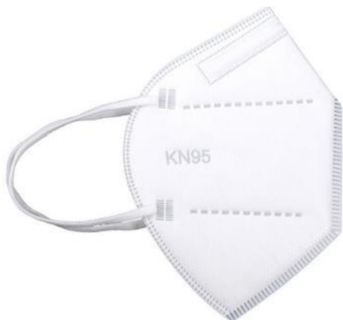
Sl.11 Zaštitna maska N95 [11]