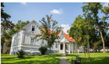
Slika 6 Muzej Moslavine

Izvor: Muzej Moslavine, https://experiences.moslavina.travel/hr/products/muzej-moslavine (1.7.2023.)