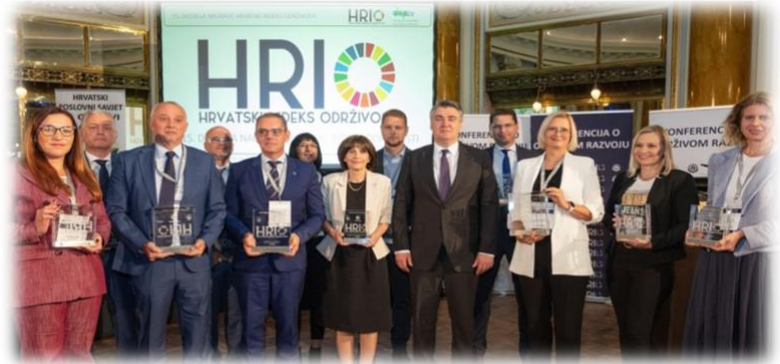
Slika 5. Dobitnici nagrade sa predsjednikom RH