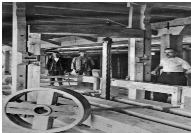
Sl.1. Pilana na vodeni pogon. [3]