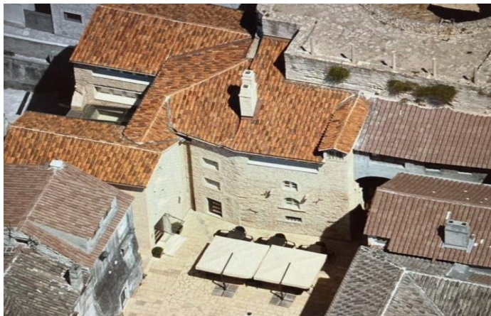
Slika 10. Prikaz hotela Vestibul Palace iz zraka