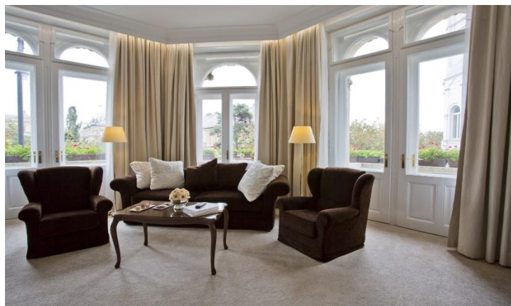
Slika 6. Dnevni boravak u predsjedničkom apartmanu u hotelu Palace