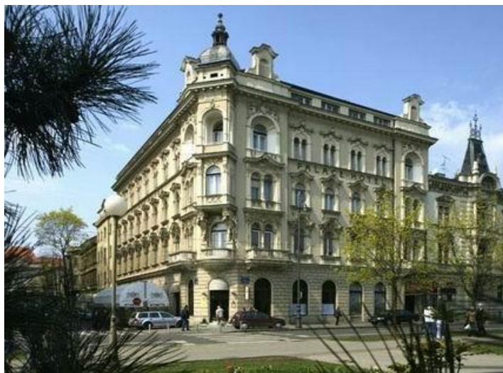
Slika 4. Hotel baština – Hotel Palace Zagreb