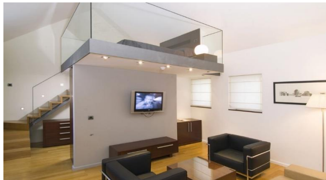
Slika 11. Veliki apartman u Vestibul Palace hotelu