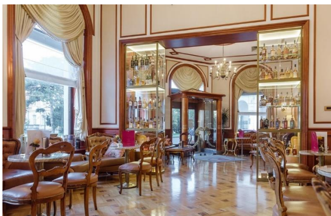
Slika 7. Restoran hotela Palace u Zagrebu