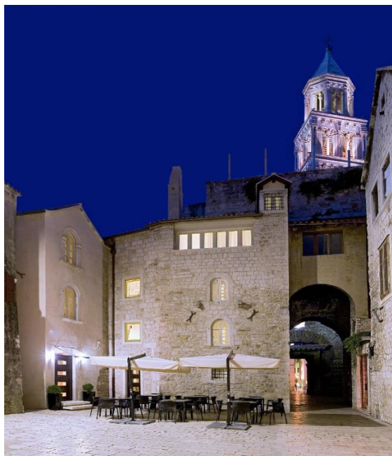
Slika 3. Hotel Vestibul Palace Split