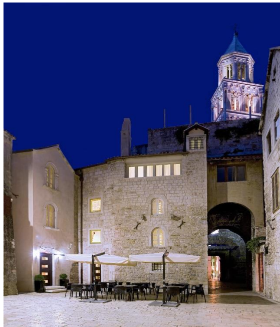
Slika 3. Hotel Vestibul Palace Split