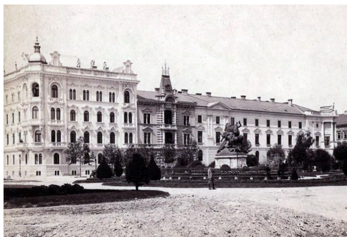
Slika 1. Prikaz hotela Palace Zagreb izvana