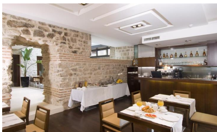
Slika 12. Restoran Magnus