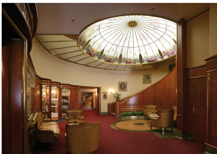
Slika 2. Salon u hotelu Palace Zagreb