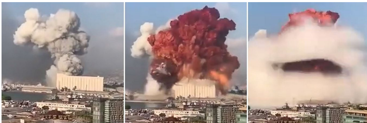
Slika 10.: Plinovi nastali u eksploziji skladišta 12 u luci Bejrut [24]

Najveći dijagnostički izazov za bolničke kliničare na svim razinama skrbi nakon katastrofe bilo je suočavanje s velikim brojem žrtava i višestrukim prodornim ozljedama. Unatoč aktiviranju bolničkog plana za slučaj katastrofe, pacijenti su dolazili u mnogo većem obimu od onoga što bolnički resursi i kapaciteti mogu primiti. Elektronički zdravstveni sustavi nisu uspjeli prihvatiti val pacijenata. Ogroman porast ozljeda spriječio je formalno dokumentiranje kartona pacijenata; mnogi ozlijeđeni i umrli nisu identificirani.