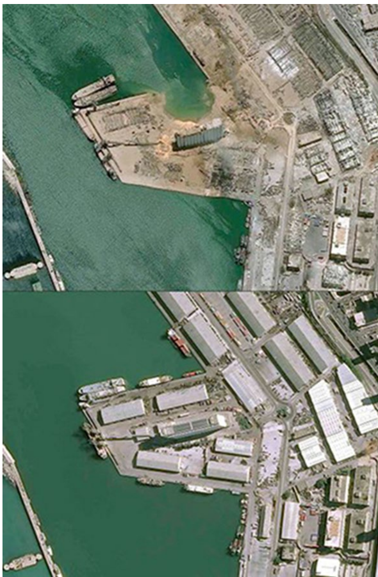
Slika 11.:Satelitska slika prije i nakon eksplozije u luci Bejrut [26].

moćući posljedita. Prema libanonskom zakonu, to bi moglo predstavljati kazneno djelo ubojstva s vjerojatnom namjerom i/ili nenamjernog ubojstva. To također predstavlja kršenje prava na život prema međunarodnom pravu o ljudskim pravima.