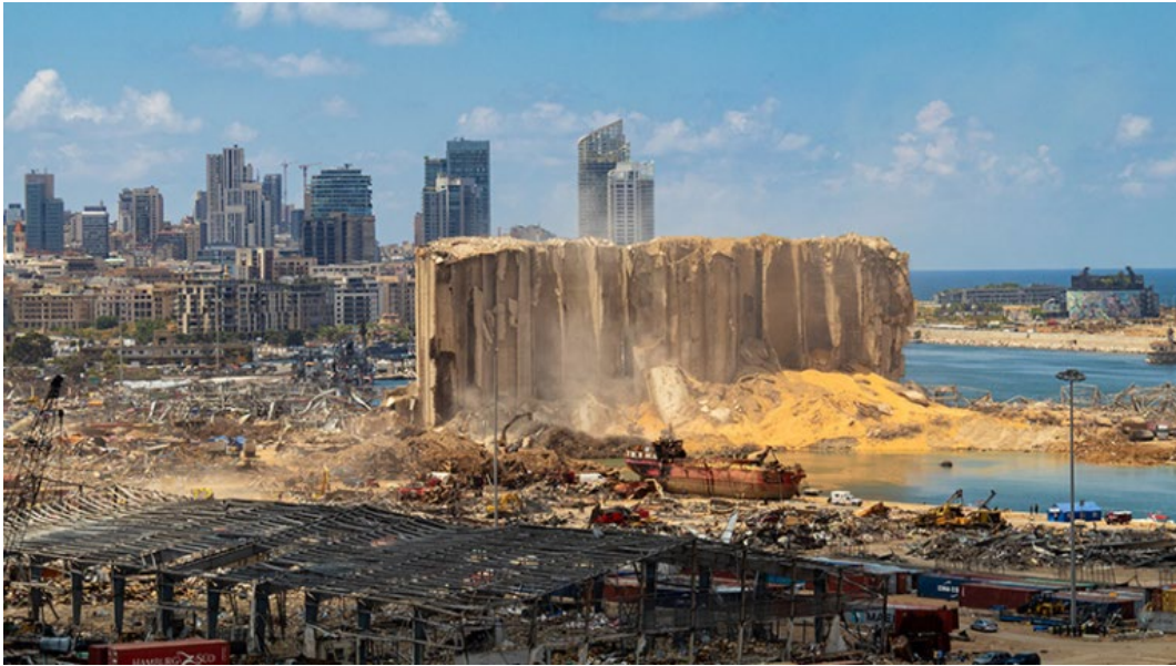
Slika 9.: Izgled silosa u luci Bejrut nakon eksplozije [23].

Eksplorzija u Beirutu izazvala je snažnu eksploziju koja je proizvela krater širine 140 m i potres magnitude 3,3 po Richteru. Eksplozija je također rezultirala ispuštanjem plina amonijaka i dušikovih oksida u zrak (Slika 10.), uz potencijalno opasne toksične tvari iz drugih materijala koji su se također mogli zapaliti kao posljedica eksplozije. Plin amonijak i dušikovi oksidi štetni su za okoliš kao i za dišni sustav. Crveno-narančastu boju dima uzrokovao je dušikov dioksid, \text{NO}_2 , produkt razgradnje AN. Crveno-narančasti oblak je nakratko bio okružen bijelim oblakom kondenzacije.