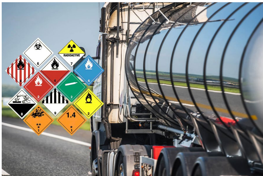
Slika 4.:Prijevoz amonijeva nitrata [13].

Amonijev nitrat prevozi se u cisternama (slika 4.). Na svakoj cisterni na vidljivom mjestu mora biti pričvršćena metalna ploča sa slijedećim oznakom: