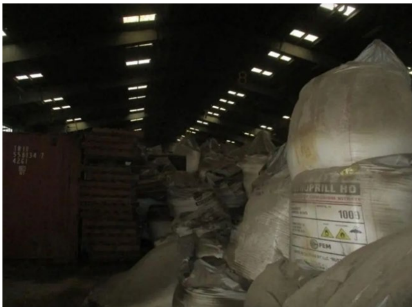
Slika 8.: Hangar 12 u bejrutskoj luci [22].