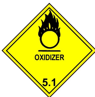
Slika 3.: Simbol za oksidirajuće tvari [3]

Za listice osnovne opasnosti karakterističan je broj klase u donjem dijelu. U slučaju amonijevog nitrata to je listica prikazana na slici 2.