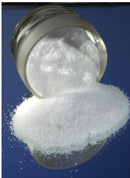
Slika 1.: Amonijev nitrat [9].

Amonijev nitrat se prodaje u nekoliko oblika, ovisno o upotrebi. Tekući amonijev nitrat može se prodavati kao gnojivo, općenito u kombinaciji s ureom ili se tekući amonijev nitrat može koncentrirati da se dobije talina amonijevog nitrata za upotrebu u procesima stvaranja krutih tvari.