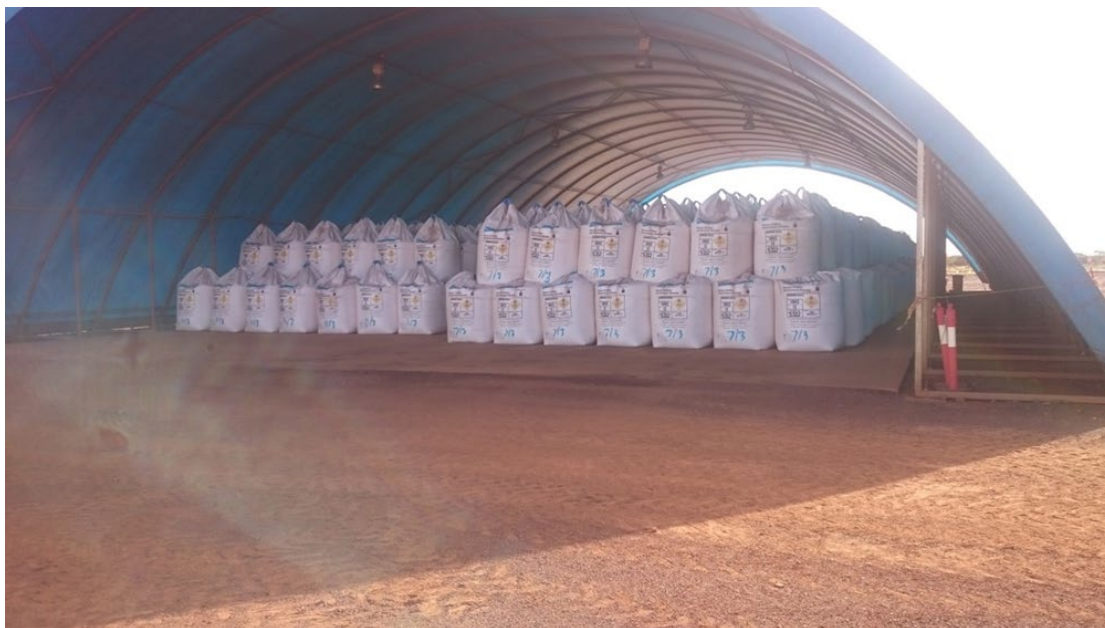
Slika 6.:Skladištenje zapakiranog amonijevog nitrata na otvorenom [18].

Osnovni uvjeti skladištenja amonijevog nitrata u skladištima su sljedeći: