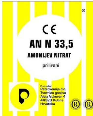
Slika 2.:Komercijalno dostupni amonijev nitrat kao gnojivo [10]

Za čisti amonijev nitrat (gnojivo) treba posebna poljoprivredna dozvola. Osim što se koristi za poljoprivredu, njegove soli se miješaju s tekućim eksplozivima i koristi se kao eksploziv. Dodaje mu se pijesak (dolomit) u obliku kalcija, i ostali spojevi, da bi se smanjila mogućnost od eksplozije. Eksplozivi na bazi amonijeva nitrata su najjeftiniji i najčešće su korišteni gospodarski eksplozivi [7]. Fizikalno-kemijska svojstva amonijevog nitrata prikazana su u Tablici 1.