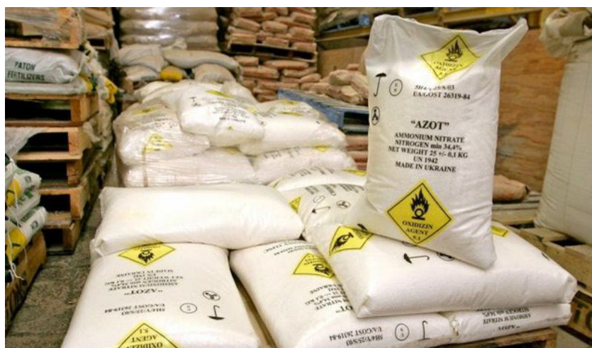
Slika 7.:Skladištenje amonijevog nitrata u zatvorenom prostoru [20].

Ako se urea skladišti u istoj zgradi s gnojivima na bazi amonijevog nitrata, organizirati skladište tako da se ovi proizvodi ne mogu međusobno kontaminirati ili djelovati u slučaju požara [19].